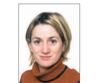
Piše: PAVLA KLIMER

Če se vam je zgodilo, da ste poleti in v zgodnji jeseni povsem pozabili na svoj jedilnik uvrstiti kislo zelje, lahko to nadoknadite v mrzlih dneh, ki so pred vrati. Večkrat bomo imeli kisle dneve, manj kisli bomo, če se malce pošalimo. V mrzlih