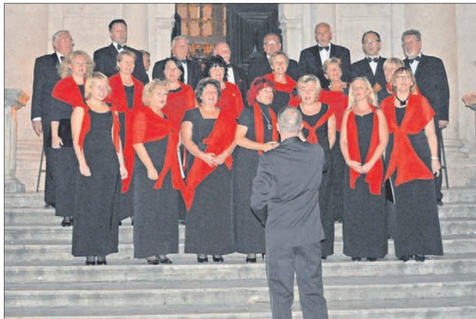
Zbor Orfej je v Dubrovniku zbranim zapel tudi na stopnicah, ki vodijo v katedralo sv. Vlaha.