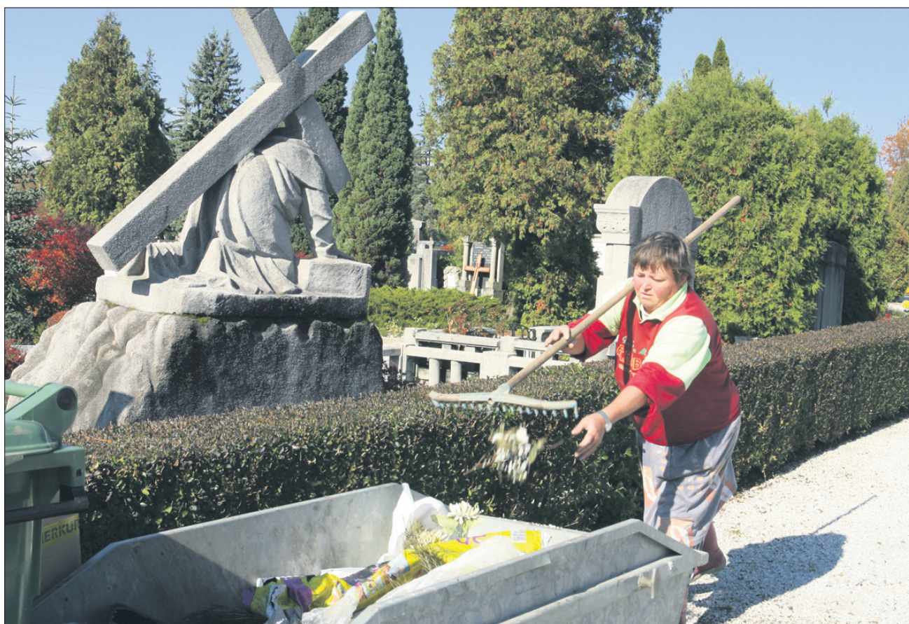
Vsak ima svoj križ