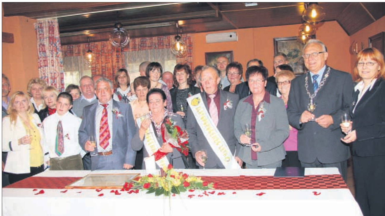
Zlatoporočenca s svati