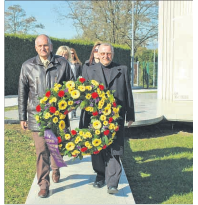
Predstavniki MOC so se poklonili tudi žrtvam na Teharjah.