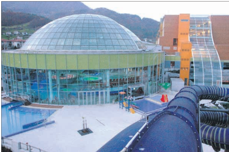
Otroci naj bi se zastrupili v zunanjem manjšem bazenu z igrali.

Zastrupitev se je zgodila v petek okoli poldneva, ko se je četverica (otroci so stari 4, 5, 9 in 15 let, med njimi trije dečki in ena deklica) kopala v zunanjem rekreacijskem bazenu termalnega centra Wellness park Laško. Otroci naj bi nenadoma začeli kašljati, imeli naj bi težave z dihanjem. Najprej so jim priškočili na pomoč bazenski reševalci, ti so poklicali še zdravstveno reševalno službo. Malčke so odpeljali v celjsko bolnišnico, kjer so preiskave pokazale, da zastrupitev pri enem otroku zahteva