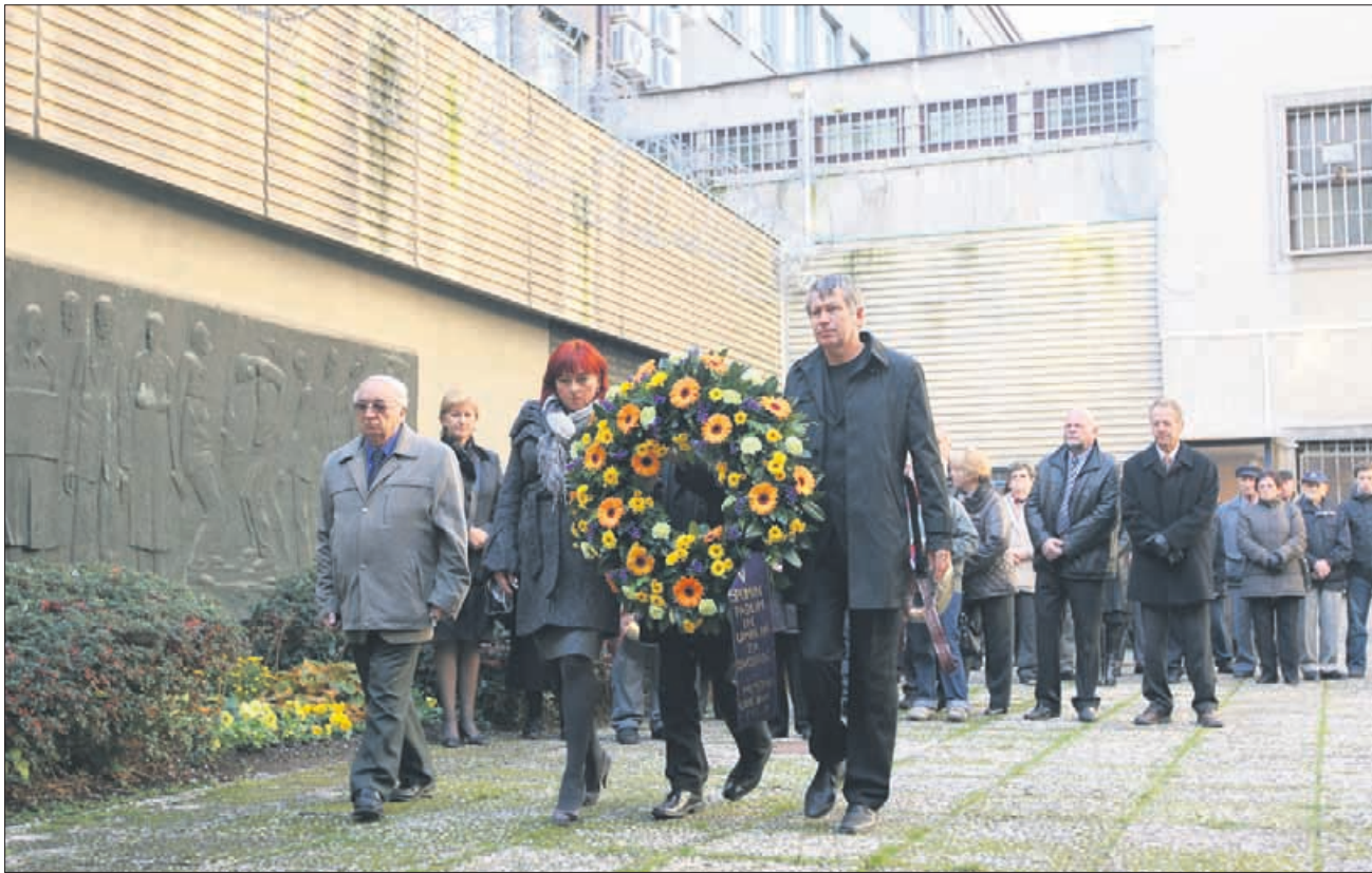
Slovesnost v Starem piskru