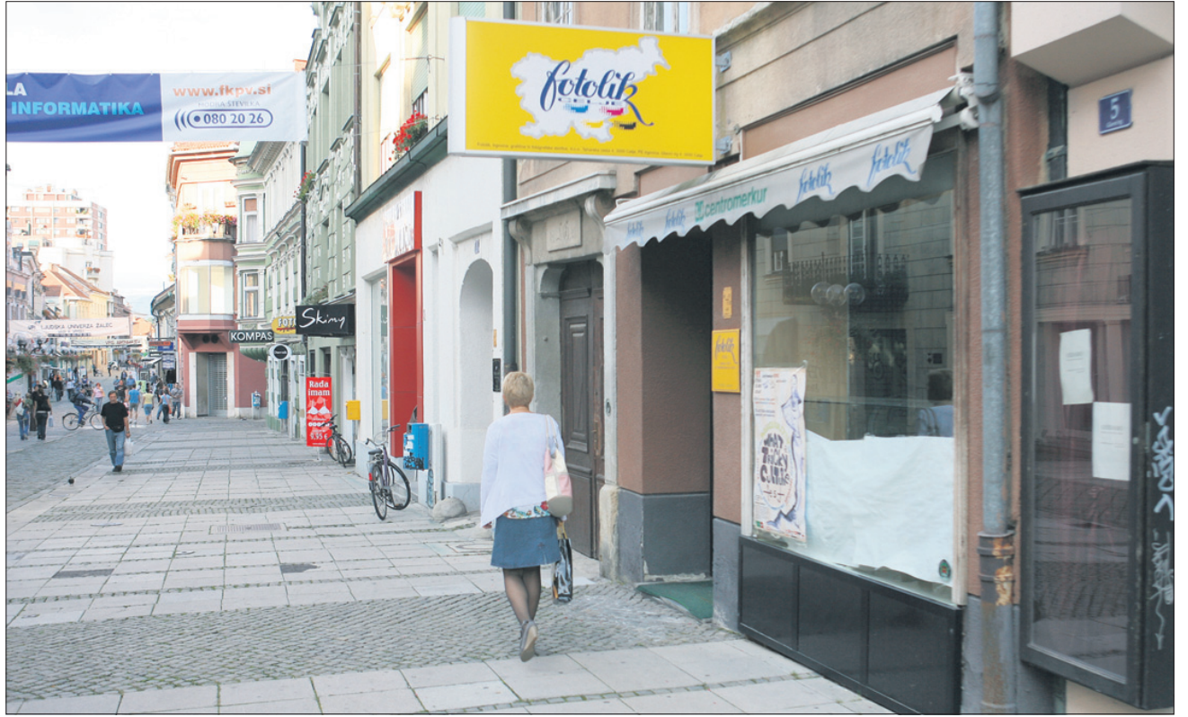
Preveč lokalov v mestnem jedru sameva, ponudba trgovin je skromna.