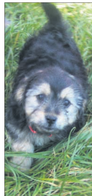
Kaj me tako gledaš? A sem mogoče podobna sovi ali kaj?(Buba)

Uradne ure: od ponedeljka do petka od 8. do 16. ure; ogledi psov: od ponedeljka do petka od 12. do 16. ure. Sprehajanja od ponedeljka do petka od 12. do 16. ure, ob sobotah od 10. do 12. ure (obvezna predhodna najava vsaj en dan prej po telefonu zavetišča). Telefon: 03/749-06-00; internetni naslov www.zonzani.si