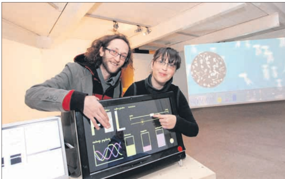
S spreminjanjem nastavitve na računalniškem zaslonu na dotik se spreminjata tudi mikro in makro svet morja na velikem platnu.

Postavitev ima vse značilnosti računalniške igre, obiskovalca pa interaktivno popelje v krhkost ekosistema. Gre za nekakšen shematični prikaz prehranjevalne verige, za katero sta avtorja podatke pridobila v Morski biološki postaji Piran. Preko zaslona na dotik lahko gledalec sam ustvarja svojo razstavo, tako da s spreminjanjem ponuje