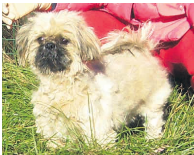
Gobček sem namočil v katran, zdaj pa si ga ne morem umiti. Imate morda kakšen predlog, kako naj bo moj smrček spet bel? (Bendži)

sliko. Na eno takšnih sem naletela v Portu na Portugalskem. Bilo je precej veliko in polno zasedeno, na njem pa so počivale živali, ki so živele v 60. letih prejšnjega stoletja. Zanimivo je bilo prebirati imena in letnice rojstva živali, za katere se je po lepo urejenih grobovih videlo, da so bile ljubljene.