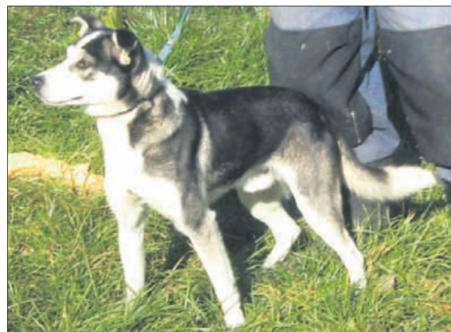
Če si ti mini dalmatinka, potem sem jaz mini huskey. Prednost manjše velikosti pa je ta, da bomo mi, miniji, celo življenje ostali prikupni. (8515)

Uradne ure: od ponedeljka do petka od 8. do 16. ure; ogledi psov: od ponedeljka do petka od 12. do 16. ure. Sprehajanja od ponedeljka do petka od 12. do 16. ure, ob sobotah od 10. do 12. ure (obvezna predhodna najava vsaj en dan prej po telefonu zavetišča). Telefon: 03/749-06-00; internetni naslov www.zonzani.si