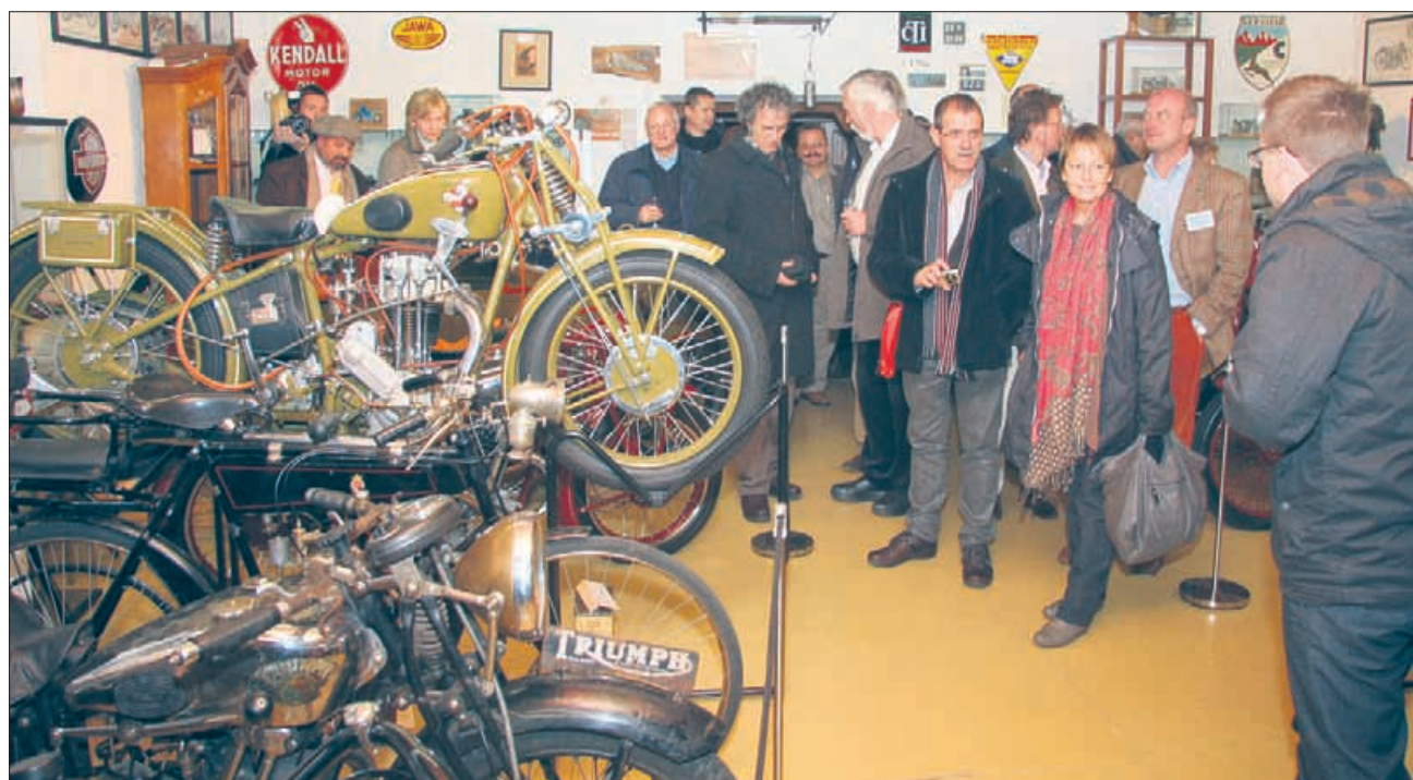
Delegacija med ogledom muzeja