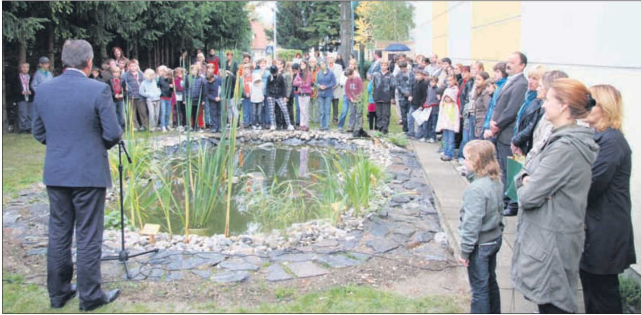
Učilnica na prostem v OŠ Petrovče

V sredo, 6. oktobra, so na Osnovni šoli Petrovče slovesno predali svojemu namenu kar dve pomembni pridobitvi – učilnico na prostem in prenovljeno in razširjeno šolsko jedilnico.