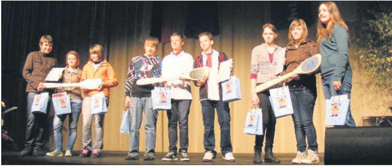
Najboljše tri ekipe ob podelitvi bronaste, srebrne in zlate kuhalnice