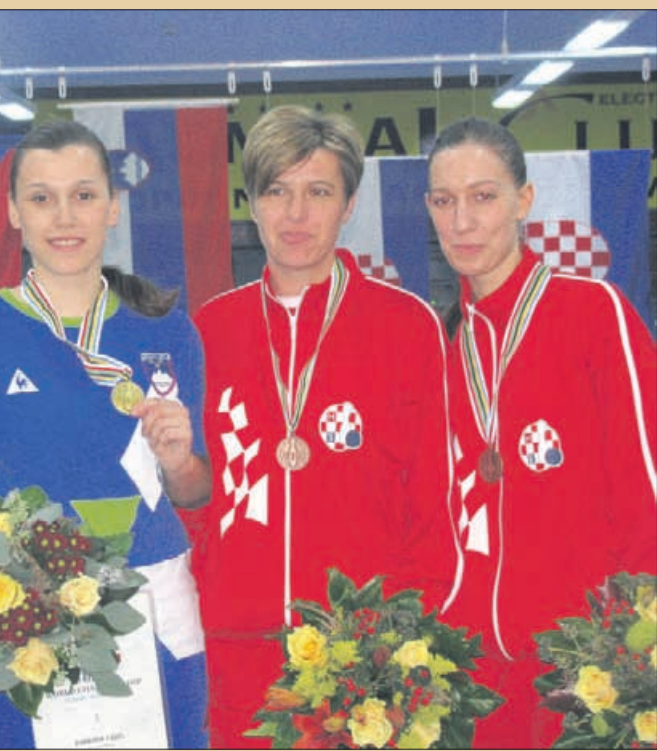
Prvakinja. Drugo mesto je osvojila Čehinja, tretje pa Hrvatice.