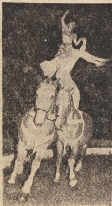
Akrobata na dirjajočih konjih povzročita, da gledalcem zastaja dih

Ko gledalcem zastaja dih v napetih trenutkih, si niti ne predstav-