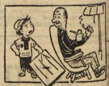
»Očka, kako to, da se zgodi vsak dan natanko toliko kolikor gre v časnik?«