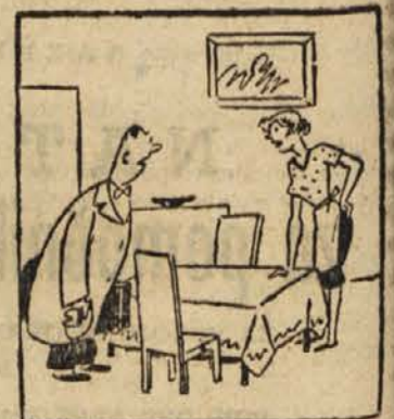
»Ali res nimate ne majhnih otrok, ne psov, ne mačk, ne klavirja ali radia?« vpraša gospodinja. »Ne ničesar nimam. Le moje nalivno pero nekoliko praska, ko pišem. Ali vas ne bo to motilo?«