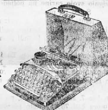
Telefon št. 22

Brzjavni: Krispercoloniale Ljubljana — Telefon št. 2263