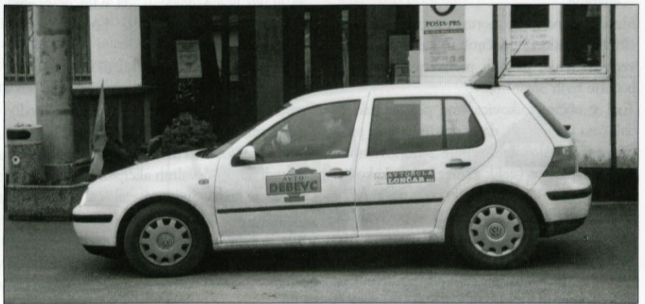
Zasluzi ime ljudski avto - golf.