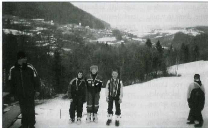
Najboljši mladi skakalci so prejeli medalje.

Ker so bile snežne razmere ugodne, smo se Zlatopoljci odločili, da pripravimo še eno tekmo v smučarskih skokih. Pred mesecem dni za Pokal Občine Lukovica, tokrat za Pokal Zlatega Polja.