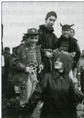
Pustni karneval na Viru

Leto je že spet naokrog in tudi tokrat smo se Prepihove maškarce na pustno nedeljo podale na ogled enega izmed številnih karnevalov po Sloveniji, tokrat nam mnogo bližje (lansko leto smo obiskali Cerknico), in sicer na Vir. Ob pol dvanajsti uri smo se zbrali v dvorani Kulturnega doma Janka Kersnika v Lukovici, kjer smo "privlekli" na plan vse vrste najrazličnejših oblačil, lasulj, ličil ... in se v eni uri in pol spremenili v