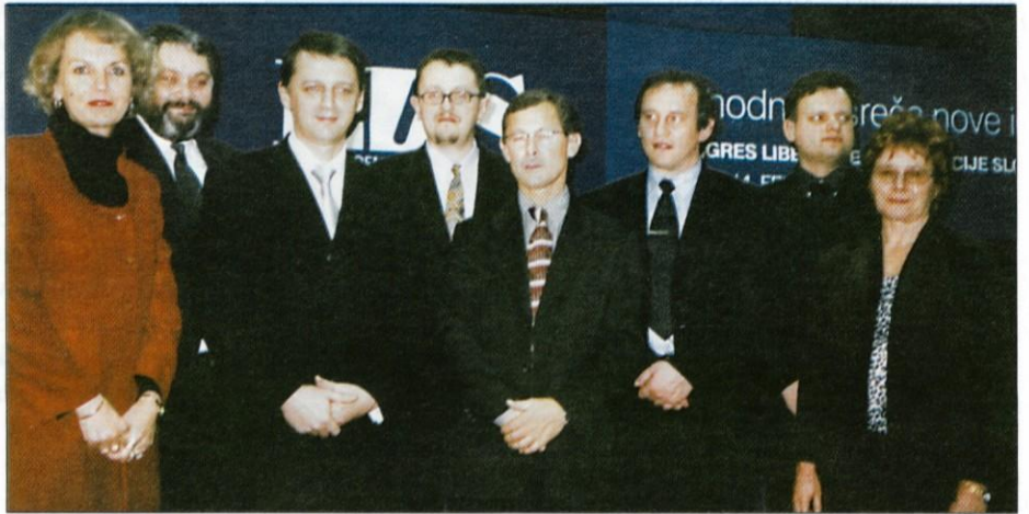
Tone Rop v družbi strankarskih kolegov in kolegic

V nagovoru po izvolitvi je novi predsednik LDS Anton Rop poudaril, da se bo zavzemal za večjo povezanost med vrhom stranke in lokalnimi odbori na terenu, v regijah in v posameznih občinah in mestih. Stranka se bo pod njegovim vodstvom na državnoborskih volitvah prihodnje leto trudila vsaj ponoviti - če ne celo izboljšati - pretekle rezultate. "Naša