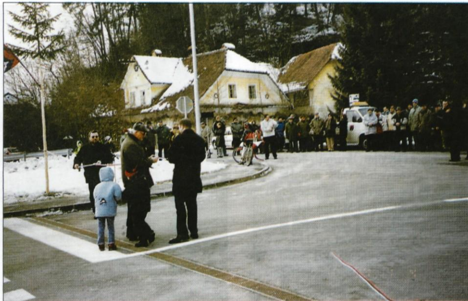
Ob odprtju se je zbralo precejšnje število krajanov.

Tik pred odprtjem je župan v kratkem nagovoru spomnil navzoče, da je nova pridobitev povezana z začetno fazo avtocestnega projekta in pomeni odpravljanje črnih točk v dolini Črnega grabna. O nujnosti ureditve križišča se je govorilo že pred osmimi leti. Minilo je kar nekaj let, da je Občina Lukovica v sodelovanju z DDC in KS Lukovica uspela križišče dokončno urediti v kar nekaj etapah, saj je bilo med drugim potrebnega veliko truda in