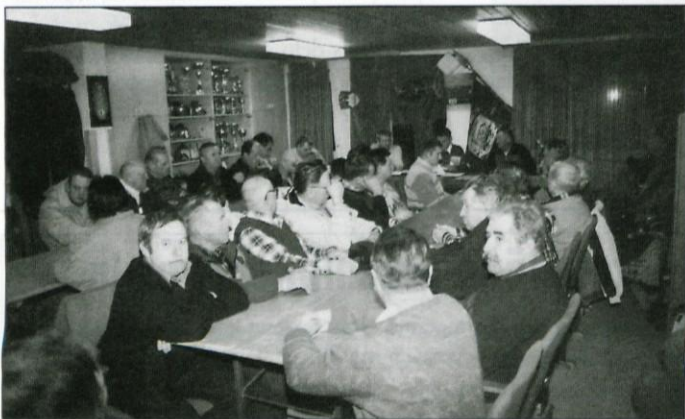
Občni zbor v PGD Prevoje