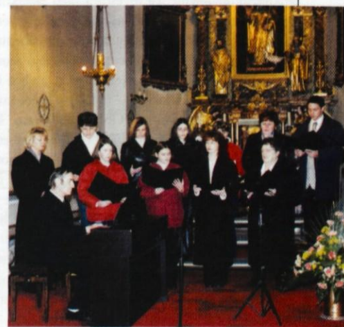
V župnijski cerkvi v Dobu.