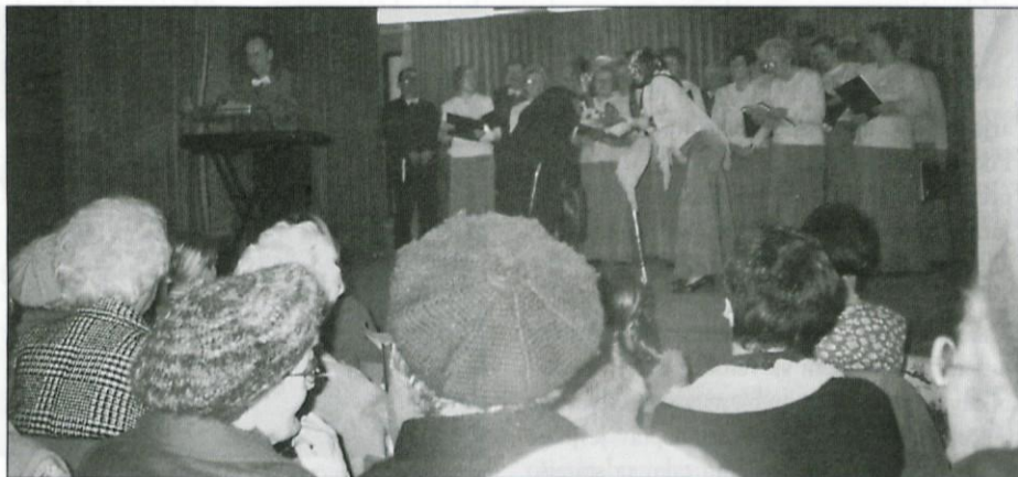
Skeč je razgibal vse navzoče.

Skeč na temo težav, ko nastopi v starosti naglušnost, je razgibal vse navzoče. Tako pri-