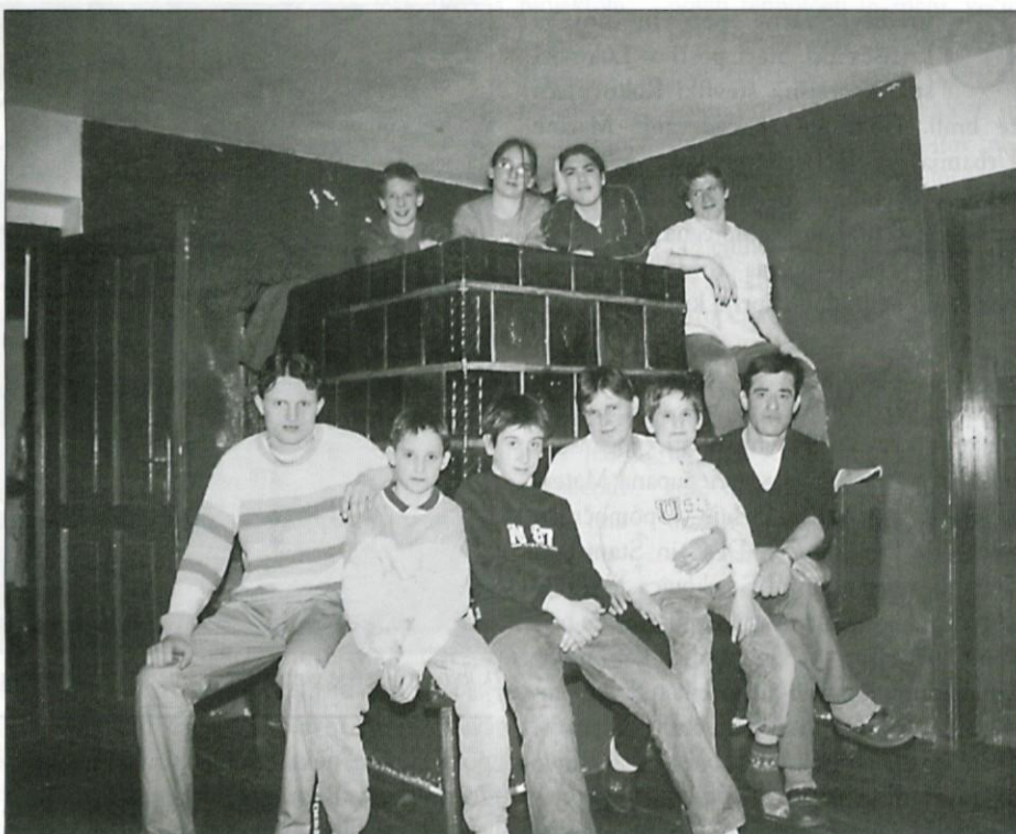
Ob večerih se zbere vsa družina ob topli krušni peči.

"Menim, da niso imeli večjih težav. Res je seveda, da nekdo potrebuje več časa in drugi nekoliko manj, a na koncu se vendarle vsi