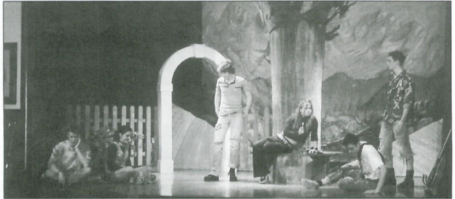
Prizor iz igre Pod vaško lipo