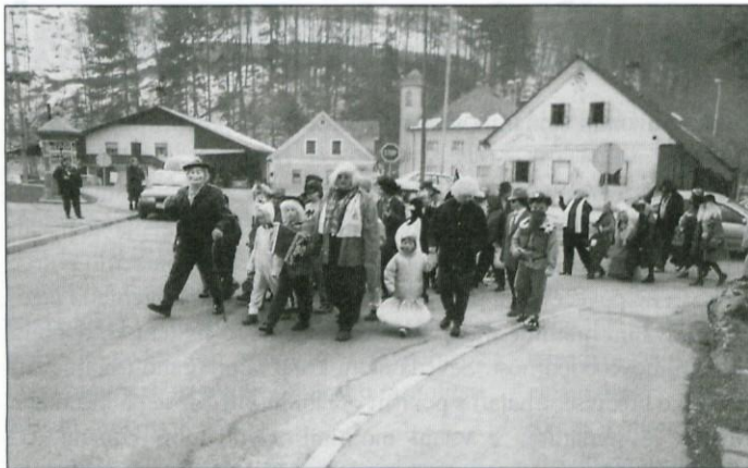
Maškare so krenile proti kulturnemu domu.

Že tretje leto zapored so na pustno nedeljo blagoviški planinci organizirali veselo rajanje maškar. Na igrišču, kjer so se zbrali, jih je bilo tokrat kar za enonadstropen avtobus.