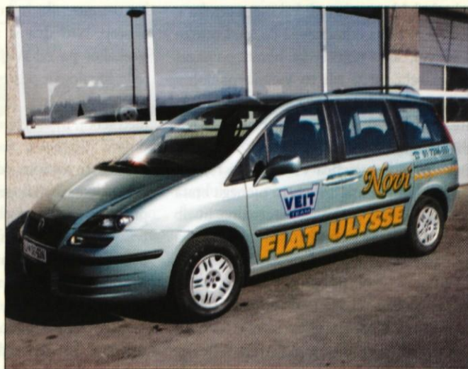
Kolikor nudi novi Fiat-Ulysse, niti ni tako velik.