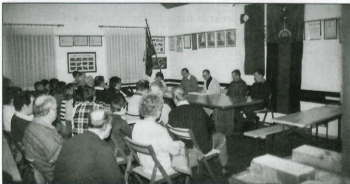
Občni zbor v PGD Krašnja