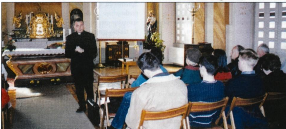
Predavanje ob pomoči tehnike in prakse