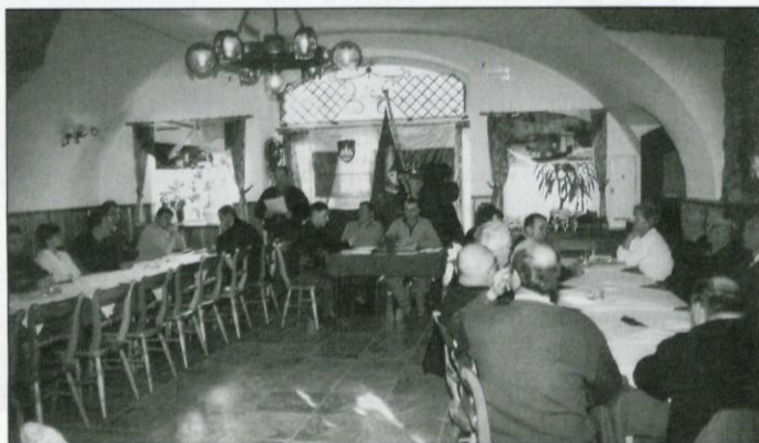
Občni zbor v PGD Lukovica