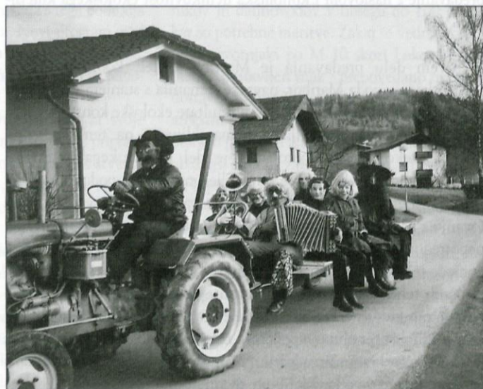
Maškare na svojem pohodu