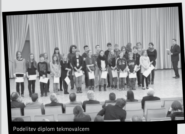
Podelitev diplom tekmovalcem

Drugega mednarodnega tekmovanja EMONA 2013 se je udeležilo 137 mladih glasbenic in glasbenikov iz osmih držav, ki so tekmovali v šestih starostnih kategorijah. EMONA je tokrat vrata odprla vsem glasbenikom, ki se izobražujejo v obstoječih glasbenih ustanovah, saj smo imeli dve kategoriji za učen-