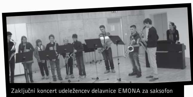
Zaključni koncert udeležencev delavnice EMONA za saksofon

Ob nastopu je bilo jasno, da so ustvarjalni, motivirani, sproščeni in dovzetni za novosti ter da so sposobni pridobljeno znanje odlično realizirati na odru pred polno dvorano. Z delavnico za mlajše spodbujamo in krepimo ljubezen do glasbe, dela in poustvarjalnosti. V njej se povezujemo profesorji Konservatorija za glasbo in balet Ljubljana in gostujoči učitelji iz Slovenije, mladim glasbenikom pa damo možnost, da navežejo nove stike in se spoznajo z učitelji saksofona.