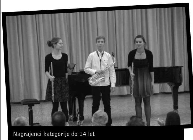
Nagrajenci kategorije do 14 let