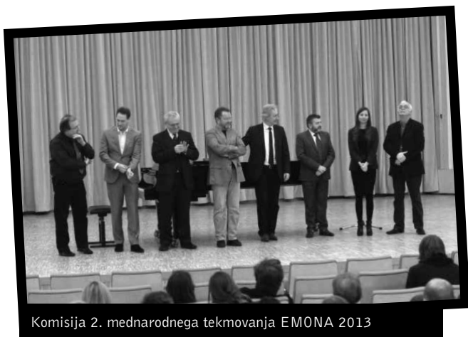
Komisija 2. mednarodnega tekmovanja EMONA 2013