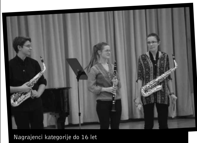
Nagrajenci kategorije do 16 let

no raven, saj je bila razlika med prvo- in osmouvrščenim tekmovalcem le dobri dve točki.