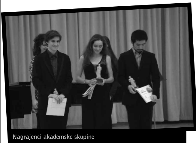
Nagrajenci akademske skupine