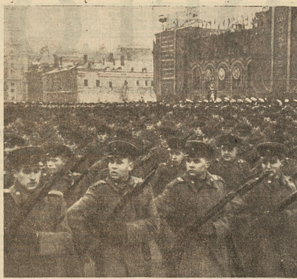
23. 2. počete 36 let odkar je bila ustanovljena slavna in nepremagljiva Rdeča armada

Izdelki, barvani po novem načinu, bodo le malo dražji. Računajo, da bodo letos pobarvali po novem načinu 15.890 ton izdelkov, v letu 1954 pa že 50.000 ton.