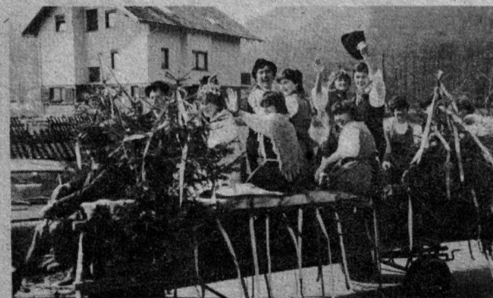
Tudi takle veseli prizor je bilo videti na dan otvoritve in poteka razstave v Mozirju