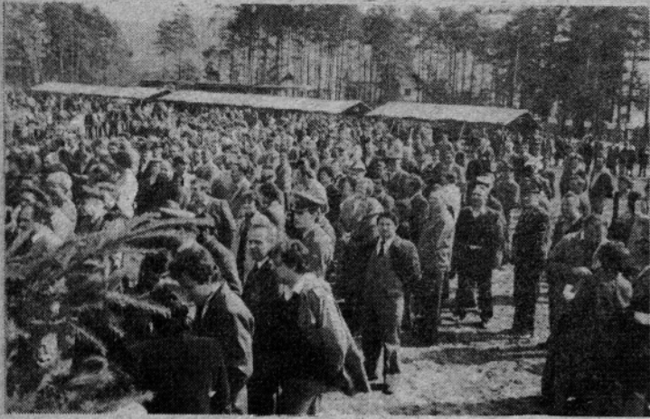
Množičnost je bila poleg ostalega odlika veličastne razstave živine