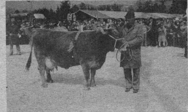
Je že bilo kaj videti na razstavi! Lepotic na pretek in veliko ponosnih rejcev, ki so dobili priznanje za trdo delo in uspeh.