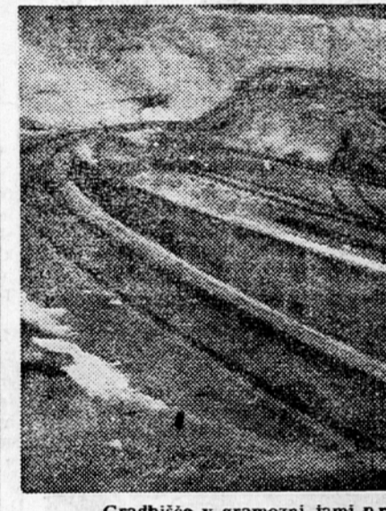
Gradbišče v gramozni jami pri Naklem je že pripravljeno.

V obeh glavnih objektih se mora začeti delo že v aprilu. Zato bodo gradnja teh objektov skrajno pospešili. Delavnice bodo gradile izbrane zidarske brigade po Turščevem sistemu ob stalnem tekmovanju. Se letos bodo v novi tovarni izdelali montažne dele za najmanj 32 mon-