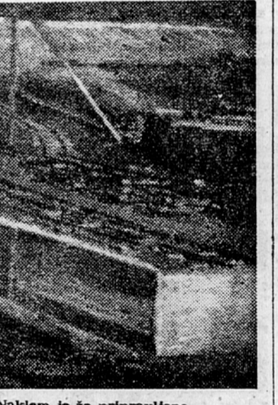
Gradbišče v gramozni jami pri Naklem je že pripravljeno.

Taka hiša ima 4 dvosobna in 4 enosobna stanovanja s kuhinjo, kopalnico, straniščem in predsobo. Stiri stanovanja imajo še balkon. Dvojne stene iz lahkega betona zagotavljajo enako toplotno izolacijo, kakor jo nudijo masivne stene iz zidakov. Tudi notranja oprema stanovanj bo taka, da bo za-