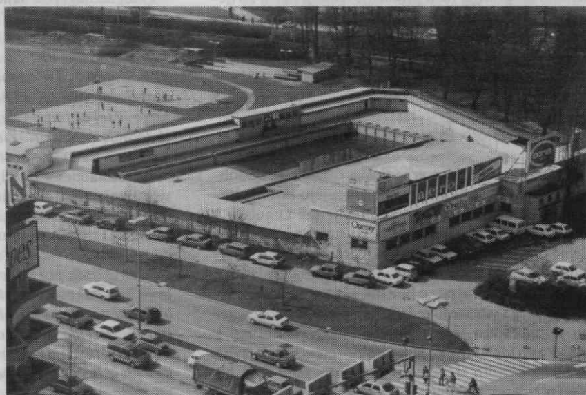
Kopališče danes (marec 1989) pogled s hotela Lev