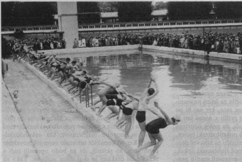
Potem ko je dr. Puc krstil kopališče, se je 24 plavalk in 24 plavalcev pognalo v vodo

»Človek potrebuje hrane, sonca, zraka in vode. Zato je kopanje in plavanje gotovo najbolj zdravi sport, ki krepi telo in jači živce. Sport je velike nacionalne, gospodarske in državne varnosti. On je tisti faktor, ki nam bo ohranil sedanje in bodočo generacijo zdravo in duševno čilo, da bo zmožna uspešno tekmovati v današnjih težkih in mrzlično hitečih časih v gospodarstvu in kulturi drugim narodom, da