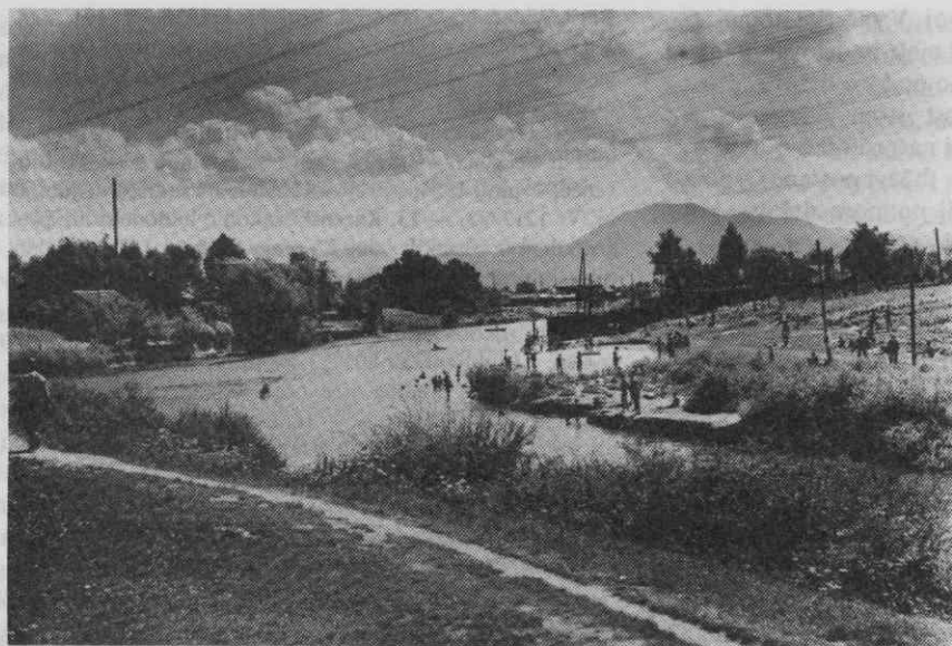
Veliko Ljubljančanov se je v prostem času namakalo na Špici