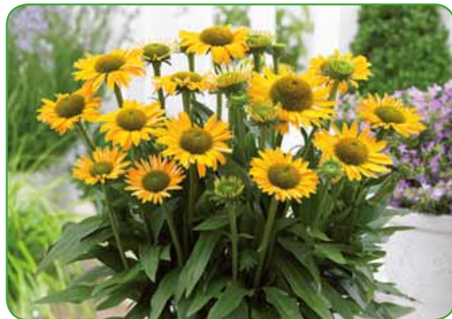
Ameriški slamnik ohrani lepoto dolgo v zimo, če ga že prej ne uporabimo za poletne šopke.

Na vrtu običajno želimo doseči barvne kontraste, saj so take kombinacije najzanimivejše in najprivlačnejše. Za to