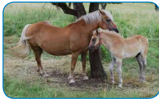
Kobila in žrebiček se skrivata pod drevom

je, sam mela malo več cajta, pa sam odila pri nas, v Zasavji, gor v bregé. Na enoj od tej poti sam vidla eno lepo verstvo, samo ka ga je vert nej steu odati. Po tistom sam spoznala nauvoga pojba in tüdi on je steu, ka bi küpila paverstvo. Dvej leti sva se vozila po cejlöj Sloveniji. Tak sva tüdi najšla en ram v Búdincaj, steroga sva si prišla večkrat poglednot, samo ka se nama je nej vidlo tau, ka se v tom rami nej dalo več živeti. Te pa se je pripelo mimo en človek in nama je pravo, ka je tü bliži en ram, steroga odavle ena ženska, stera žive v Dajčlandi. Gda sam té ram vidla, se mi je trno povido, pa tüdi samo ver-