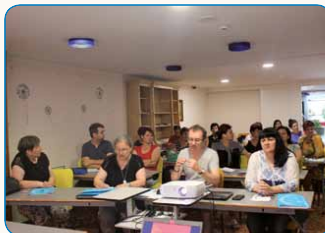
SEMINAR SLOVENSKEGA JEZIKA IN KULTURE ZA SLOVENSKE UČITELJE IZ PORABJA stran 9