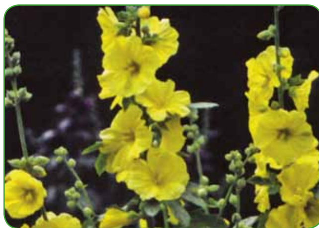
Počitek za oči ustvarjajo svetla barva rumenocvetnega rožlina, ki se odlično počuti v bližini visokih travnih bilk.

S številnimi trajnicami rumene barve lahko na vrtu hitro dosežemo vidne učinke, saj se krepko razrastejo že v letu ali