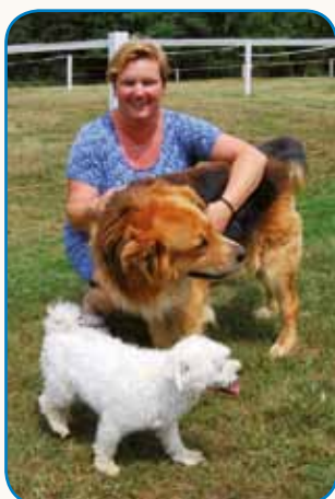
PAVNA TUDI MATŪRE stran 4