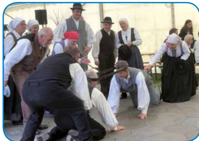
Folklorna skupina s slovenske Koroške je nutpokazala hejčne pojbinske špile

pevski zbor ZSM Števanovci, na konci so generalni vikar audaleč blagoslovili »Porabsko srcé«.