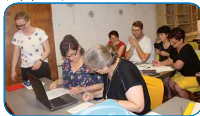
Pedagoška delavnica o pouku slovenščine s pomočjo IKT tehnologij

primeri dobre prakse, vsekakor koristne informacije, odlični novi pristopi, ki pa žal še za enkrat ne morejo biti kar umeščeni v madžarski šolski sistem. Sledila je še evalvacija seminarja, zaključek in kosilo ter po kosilu povratek domov.