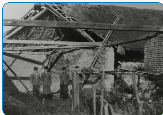
GNEŠNJE TJEJPE VEČ NE MOREŠ V ROKÉ VZETI stran 8