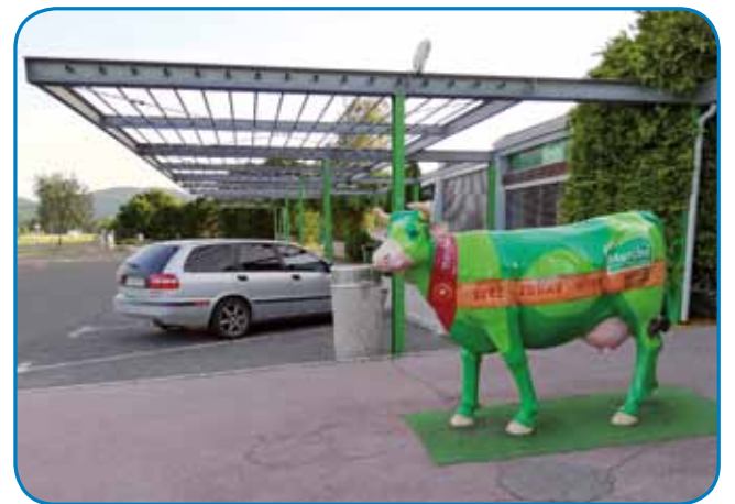
Če gestejo zelene krave, gestejo čedni Slovenci tö

ka mi je pripovejdo, ka sem se več nej poküso pitati, kak leko slejpi človek tekste lektoréra. Vüpam, ka ga eške gda srečam. S padašom sva se podala v center. Če sem vam v zimi napiso, ka so mi Ljubljano vkrad-nili, leko povejm, ka je bila tistoga letnoga petka kralica Slovenije pá takša kak nekda. Leko sva se v meri špancerala pri vodej Ljubljanici, tihinski turisti so se nej sinjavali, s vsikše oprejte terase se je čüla lejpa muzika. Napravila sva eden veuki kraug, pa v ednoj bauti za knige, štera je bila eške do edenajsete vöre oprej-ta, küpila pripovejst o malom medvedi »Moj prijatelj, Piki Jakob«. Te slovenske knige Ka-jetana Koviča sem v mlašeči lejtaj najraj emo. S padašom sva trüdniva spadnila v postelo. Dvajsti minut nut, vöro pa pau v varaši, dvajsti minut nazaj pejški - že prvi risauski večer naja je zmanthro.