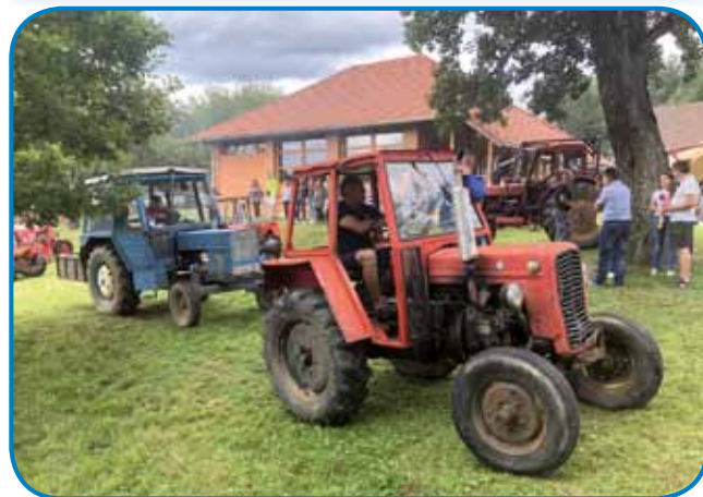
V Andovci so rogatali više trestí lejt stari traktorge

dli dosta pojbinski špil, s šterimi so se nekda paverski legéngé po končanom deli hejcali.