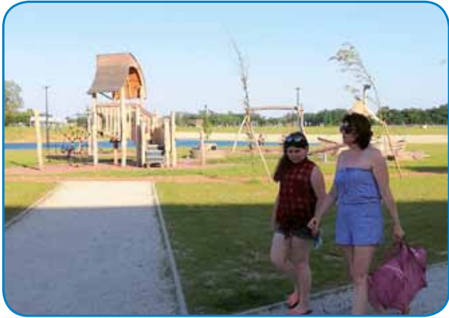
Na igrišči murskosobočkoga Expana se je nej preveč mlajšov špilalo

Za štiridnevne svetke se dosta vogrski držin poda na paut, depa tiste duge vikende, šteri samo tri dni trpijo, ranč tak vnaugi vöponücajo. Vej pa če človek v petek po službi štar-ta, pa si za torek slobauden den vzeme, leko skoro pet dni vküper vandriva. Tau pa je že lejpi počinek.