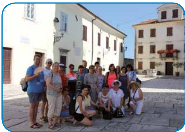
Na glavnem trgu istrskega mesta Motovun

Osnovno šolo Koper, kjer so nas pozdravili s kulturnim programom učencev. Čudovit uvod v petdnevno bivanje v Kopru so po večerji nekateri zaključili še s kopanjem v morju, spet drugi pa smo še malce pokramljali o vtisih prvega dne.