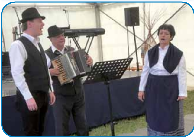
Nauva porabska pesmarska skupina »Porabski trio«