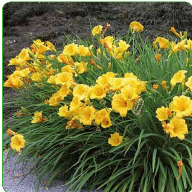
Maslenica Zlata zvezda ima nižjo rast in je izredno učinkovita kot obroba okrasnih gred, saj s svojim gostim listjem zakrije in omehča rob grede. Nedavno sem jo uporabila v šopku z plahtico, bodoglavcem in cvetiščem ameriškega slamnika.

V času počitnic in dopustov imamo več časa za razmišljanje. Za prijeten, rahlo staromodni videz ji lahko dodamo rastline