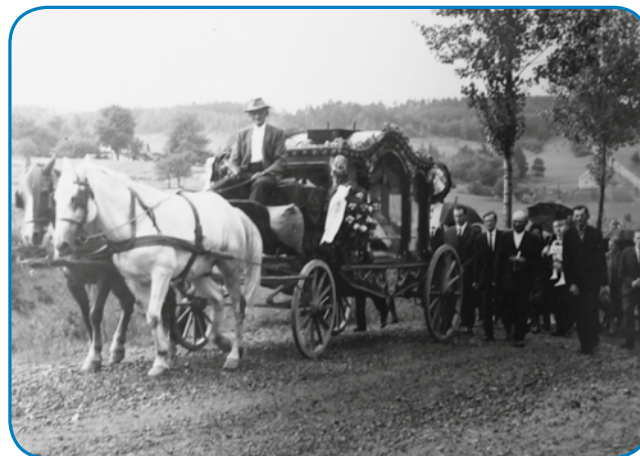
Pokapanje; Zolina očó je 1969. leta mrau, tak so ga pelali na cejntor

»Tejsti tjejp, ka ga zdaj delajo, tejtstoga že ne moreš tak