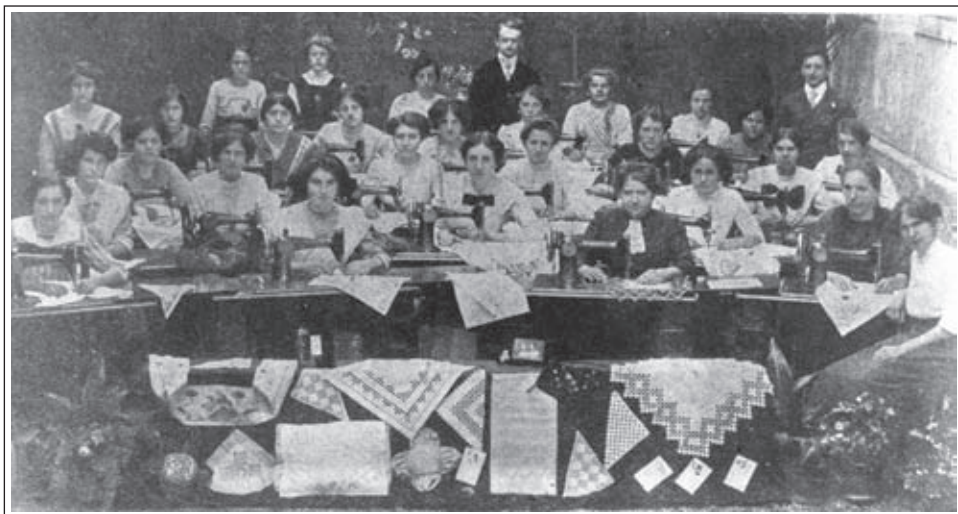
Tečaj za umetno vezenje v Idriji, leta 1913. (SŠM, razstavna zbirka, inv. št. 4244)

prikaz prenosa znanja na mlajše generacije od prvih začetkov v zgodnjem obdobju do kasnejšega, ko je državna oblast že posegla na področje izobraževanja z ustanavljanjem šol za izobraževanje obrtnega stanu.