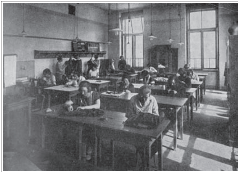
Ženska obrtna šola. Oddelek za šivanje. Izvestje Tehniške srednje šole v Ljubljani (1930/31), str. 19. (SŠM, zbirka letnih poročil)

novitev učiteljsča za izobrazbo kvalificiranih učnih moči na teh šolah. Jeseni 1911 je bilo na Dunaju odprto učiteljsiše obrtnih šol. Pouk je trajal dve leti in se je končal z zrelostnim izpitom. Učiteljice, ki so že poučevale na obrtnih šolah za šivanje perila in oblek, a niso končale učiteljsča, so morale svoje strokovno znanje dopolniti v dveh zaporednih počitniških tečajih na Dunaju in v Pragi. 35