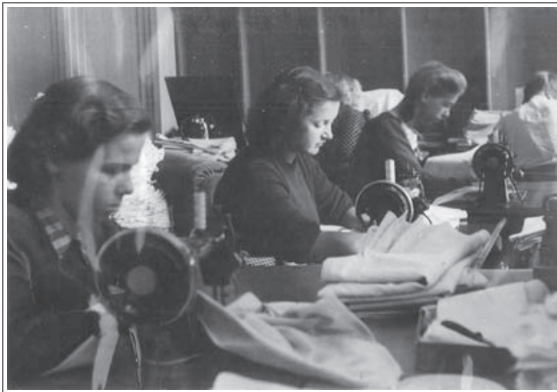
Šivilje v šivalnici v Kranju.