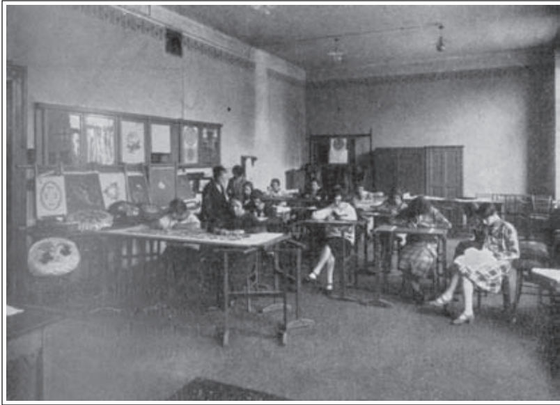
Ženska obrtna šola. Oddelek za vezenje. Izvestje Tehniške srednje šole v Ljubljani (1930/31), str. 19.