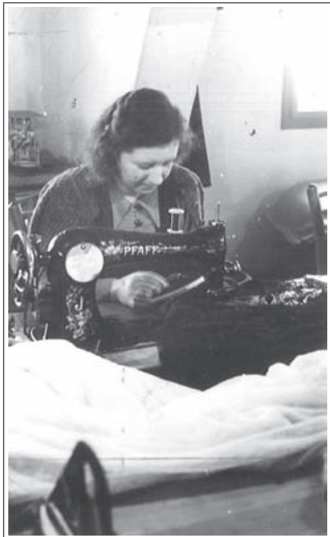
Šivilja pri delu.

Največ deklet si je za svoj bodoči poklic izbralo krojenje in šivanje oblek. Povpraševanje je bilo večje kot je imela šola prostorov in primerne kadra. Vsa dekleta niso imela možnosti, da bi se vpisale na oddelek za šivanje in krojenje oblek, zato so se številne vpisale v druga dva oddelka. Naslednje leto so imela ta dekleta prednost pri sprejemu - vpisu v prvi letnik krojenja in šivanja oblek. Število učenk na oddelku za šivanje oblek je ostajalo v višjih letnikih dokaj stalno. Številne gojenke drugih dveh oddelkov so se tudi v višjih letnikih prepisovale v oddelek za krojenje in šivanje oblek. V zadnjih letih pred vojno pa je pravzaprav zadnji med oddelki, oddelek za vezenje, počasi zamiral. Večina deklet iz tega oddelka se je odločila za prepis v druga dva. 40