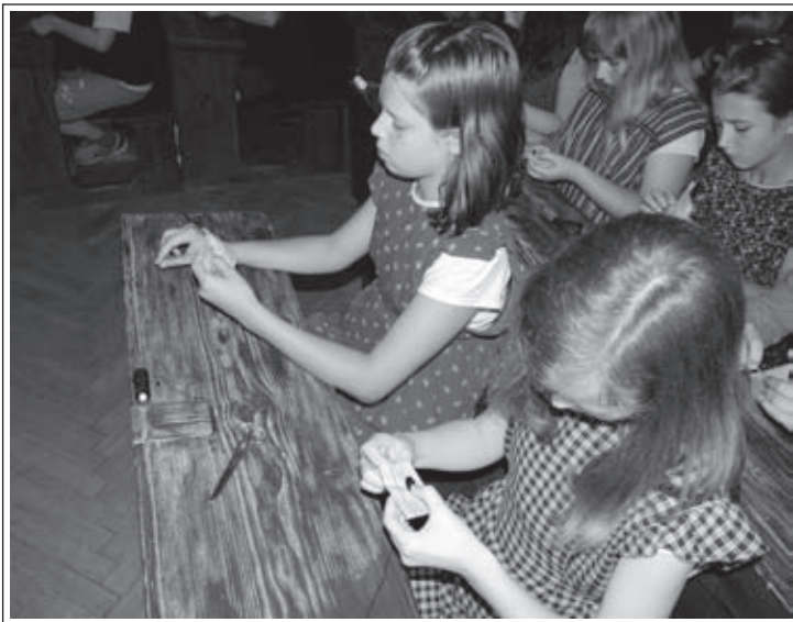
Tako se učimo šivati v Slovenskem šolskem muzeju. Pri učni uri ročnih del iz leta 1926: »Prišijmo si gumb!«

so bile pomembne knjižnice. Vsaka je imela oddelek za učence in oddelek za učitelje. Želja vsake knjižnice je bila, da bi imela vsa glavna dela obrtnih strok, ki so jih predavali na šoli, in naročeno eno glasilo obrti, ki je bila zastopana na šoli. Knjižni fond so dopolnjevali bolj z darili kot z nakupi, tako tudi večino šolske opreme in učil. 46