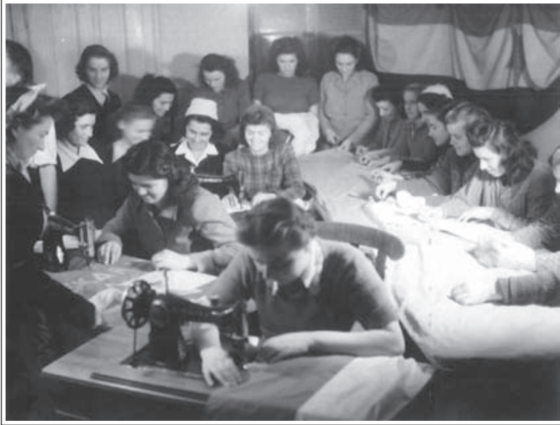
Šiviljsko znanje so v posameznih obdobjih ljudje pridobivali tudi na tečajih. (Arhiv Republike Slovenije fond AS – 1202/238, šivalnica, tečaj pred drugo svetovno vojno)

Kersnik. 18 Prva je delovala konec 18. stoletja, druga pa v prvi polovici 19. stoletja. Obe sta izobraževali predvsem zidarje in tesarje.