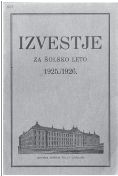
Izvestje Tehniške srednje šole v Ljubljani (1925/26). (SŠM, zbirka letnih poročil)

pouka je bilo naslovljenih na Poverjeništvu deželne vlade, ki je bilo prepričano, da je treba čim prej odpreti vrata vseh ljubljanskih obrtnih šol. Vsi odgovorni, predvsem pa mestni magistrat, so morali pripraviti vse potrebno za začetek pouka. Pouk se je začel prvega oktobra 1920. A zapletov na področju obrtno nadaljevalnega šolstva ni bilo konec. Komaj so odprli vrata teh šol, že se je izkazalo, da ni finančnih sredstev za vzdrževanje. Mestna občina ni imela dovolj sredstev, da bi nosila vsa bremena vzdrževanja, a drugih finančnih podpor ni bilo. Posledica teh težav je bila odločitev, da s pričetkom šolskega leta 1922/23 pouka ne bo. Že po vojni so bili vsi zainteresirani zelo nejevoljni, ker so bile šole zaprte. Ob vnovičnem zaprtju je prišlo do demonstracij, vajenci in vajenke so nosili razne transparente, kot npr.: "Dajte nam pouka. Odprite obrtno nadaljevalne šole." Obrtni naraščaj si je želel pouka. Šole so bile zaprte vse