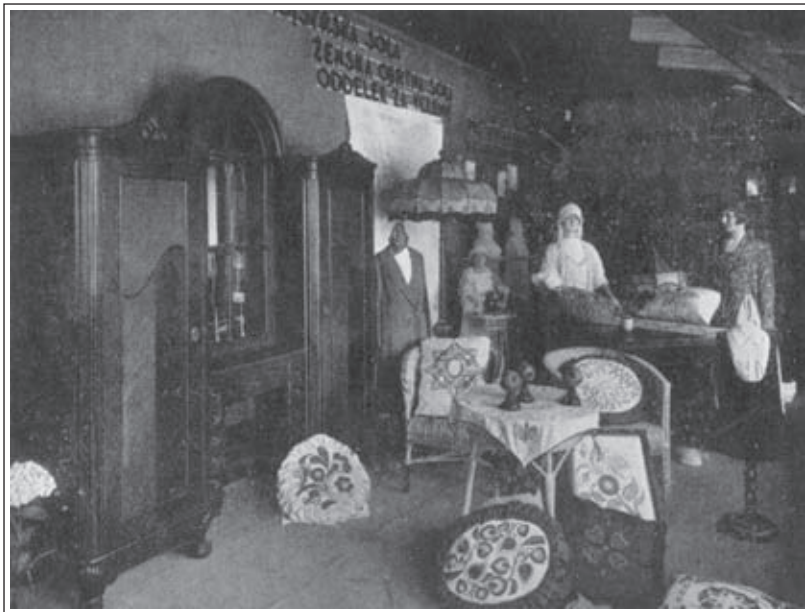
Z jubilejne razstave leta 1926. Izvestje Tehniške srednje šole v Ljubljani (1926/27), str. 34. (SŠM, zbirka letnih poročil)

Vrtači ni bila zgrajena za šolo in zato je bila dokaj neprimerna za pouk. Preselila se je le moška šola. Ženska šola je ostala v omenjeni stavbi vse do leta 1920.