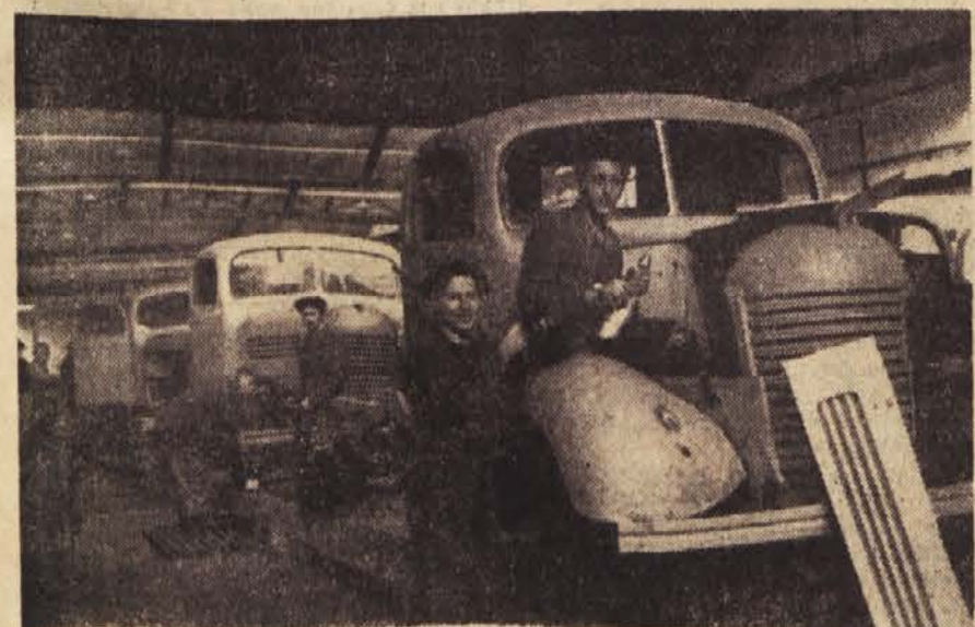
Delo v zaključni fazi montaže

Kolektiv Tovarne avtomobilov v Mariboru je dosegel v tekmovalju v počastitev desete obletnice ustanovitve Osvobodilne fronte že lepe uspehe. Razen proizvodnji je posvetil največ pozornosti političnemu in kulturnemu delu. Njegov 23-članski predavateljski aktiv je med tekmovaljem priredil po oddelkih tovarne 148 političnih predavanj. V decembru je sindikalna podružnica poslala predavatelje tudi na vas: v Rače, Fram, Goričko, Pragersko, Poleskavo in Braunšvajg. Do tega meseca so priredili člani TAM 54 političnih predavanj na vasi, kjer so številni člani kolektiva tudi prostovoljno delali: v oktobru 1354, v novembru 2500,