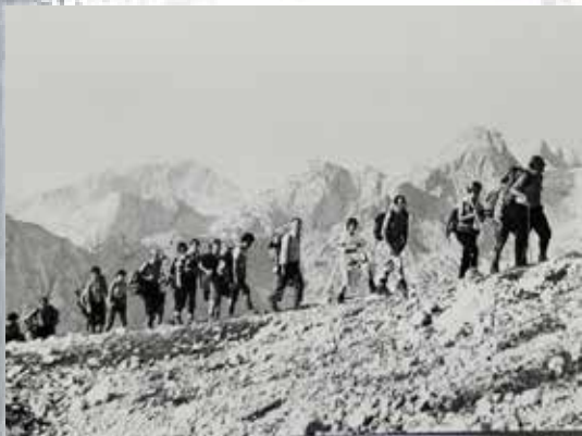
VZPON NA TRIGLAV 2864 m 1976