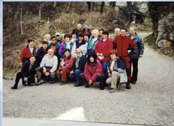
KOSTELJ – 2006