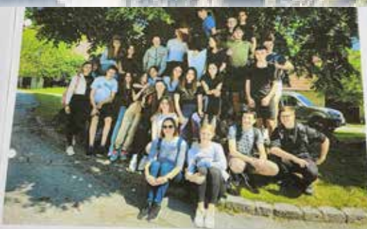
SVEČINA, 02. 6. 2022

POBORNJE BIZAKOV ŠKOLNICE 4 CELJU 70 1461 SVEČINA IN PREDSTAVILNI ŽNANJKOSTI 9461