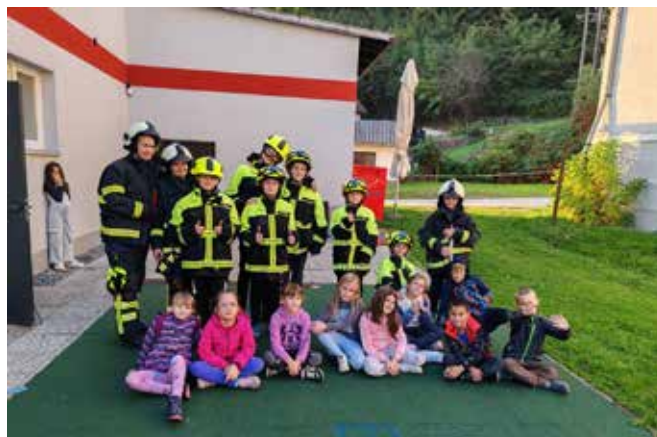
Ob zaključku gašenja hiške

Zahvaljujemo se vsem gasilkam in gasilcem za njihov prosti čas ter donatorjem in podpornikom za pomoč, brez katere delo društva ne bi bilo tako uspešno. Hvala tudi vodstvu