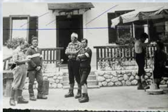
VODSTVENI KADER 1978