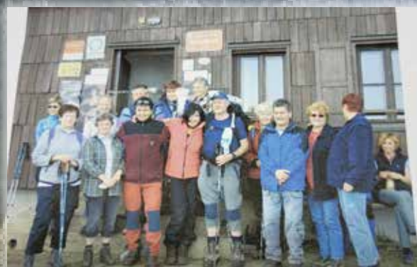
KRIŠKA GORA – 14. 4. 2007