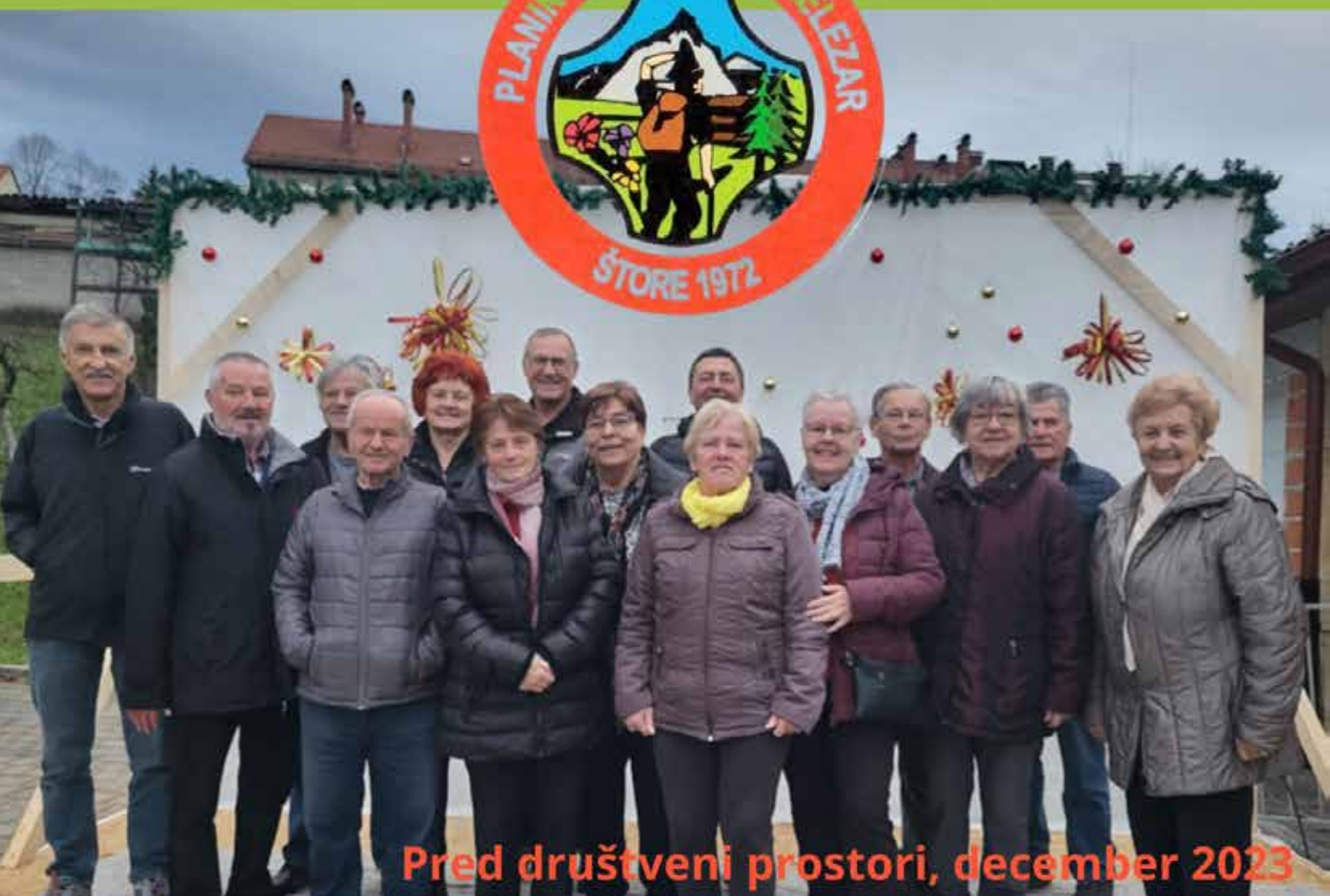
Pred društveni prostori, december 2023