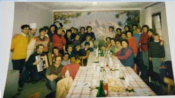
DAN ŽENA - 12. MARCA 1988