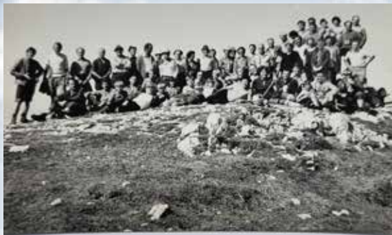
ŽELEZARSKI POHOD NA PECO 13.9.1975