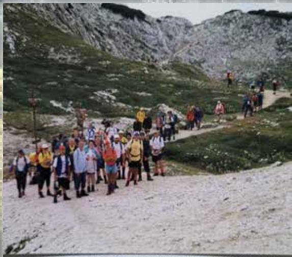
NA KRIŽIŠČU POTI PROTI DOMU NA PLANIKI IN KREDARICI 14.-16.8.1998