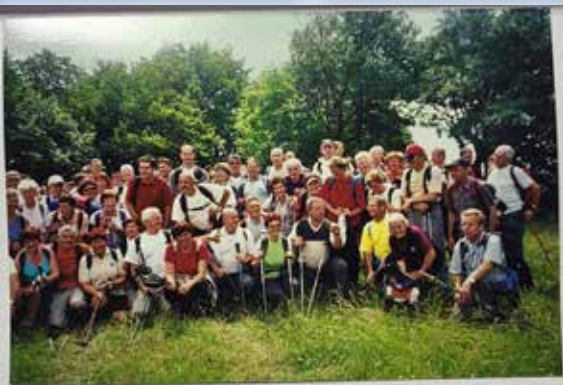
LISCA – 2007