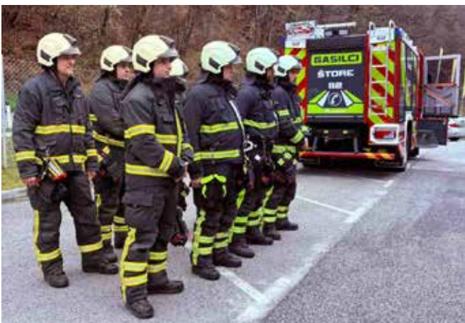
Društvena vaja pri podjetju HAWE

Od druge polovice septembra do sredine novembra smo bili člani PGD Štore dejavni na številnih področjih. V tem času nismo imeli intervencij. Sodelovali smo na Evropskem tednu mobilnosti, kjer smo se predstavili otrokom iz OŠ Štore in Vrtca Lipa. Konec septembra smo se udeležili blagoslova in dviga zvonov na Teharjah. Veliko aktivnosti smo izvedli v oktobru, mesecu požarne varnosti.