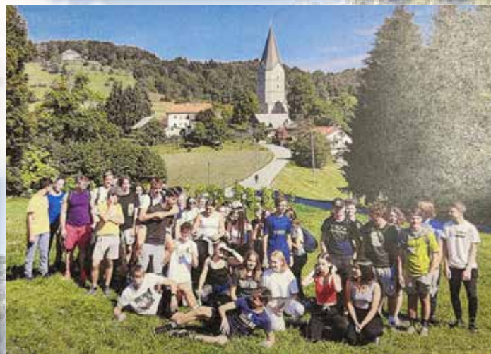
VELIKA PLANINA 2019 O.Š. ŠTORE