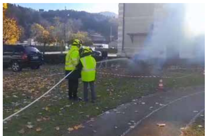
Gašenje hiške ob dnevu odprtih vrat

Tudi delo z mladino je bilo zelo pestro. Staršem in otrokom smo predstavili letošnji načrt dela ter organizirali kosanjev piknik. Mladi so nabrali kosanjev, mi pa smo ga spekli in se družili. V petek, 17. oktobra 2025, smo v času vaj pripravili mini gasilsko intervencijo, kjer je mladina uspešno pogasila »hiško«. Zadnji petek pred počitnicami smo se na povabilo PGD Prožinska vas udeležili Noči čarovnic.