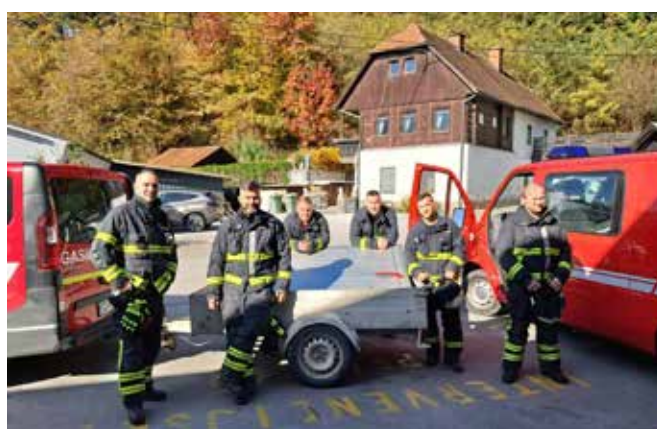
Operativci - vaja zagatnice pred izvedbo

šole in vrtca za dobro sodelovanje ter Občini Štore za finančno podporo. Vsem občankam in občanom želimo srečno, zdravo, uspešno in varno leto 2026 ter čim več druženj ob prijetnih priložnostih.