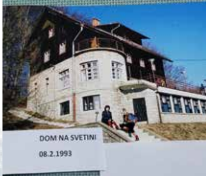
DOM NA SVETINI 08.2.1993