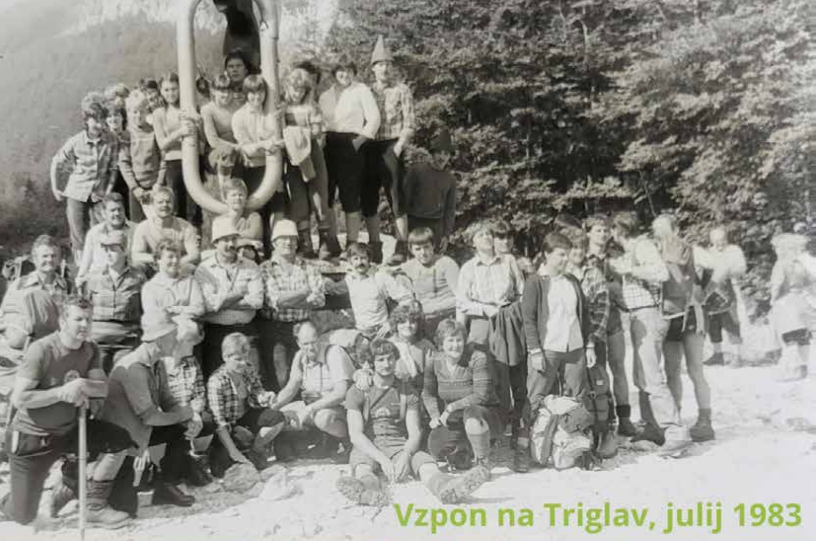
Vzpon na Triglav, julij 1983