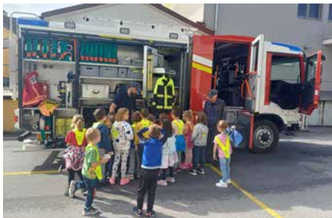
Ob dnevu mobilnosti

V soboto, 25. oktobra 2025, smo pripravili dan odprtih vrat. Postavili smo otroški poligon in igrala, razstavili vozila in opremo ter obiskovalcem ponudili okusni golaž. Posebnost dneva je bila taktična vaja »Zagatnice 2025«, izvedena na železniški postaji Štore. Po vaji so se otroci preizkusili na poligonu. Veseli smo, da sta se nam pridružili dve novi pionirki.