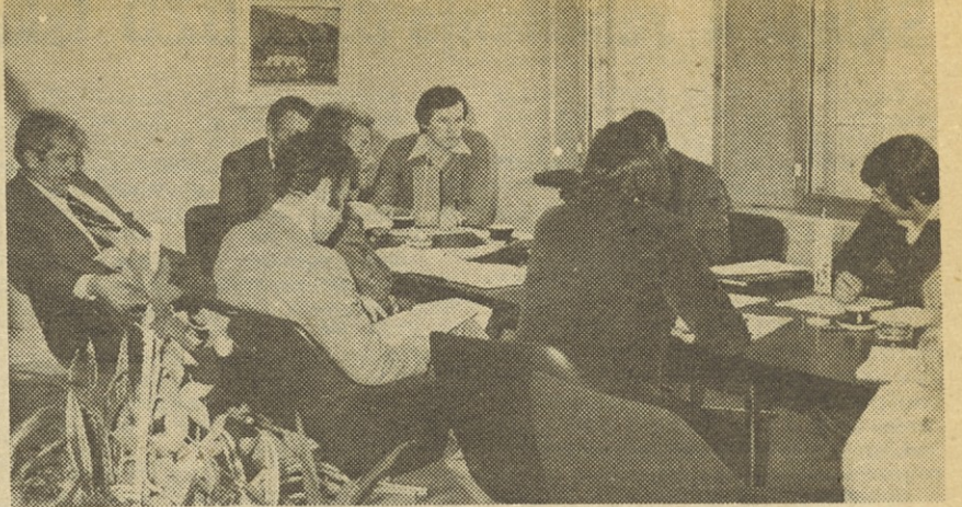
25. decembra je bila seja časopisnega sveta glasila „Iskra“, na kateri so obravnavali vsebinske in oblikovne zasnove našega glasila ter načrt usmeritve in delovanja našega glasila v novem letu. Razprava je tekla tudi o predračunu za leto 1979 in novi ceni glasila, na koncu pa je bila na dnevnem redu informacija o samoupravni organiziranosti glasila „Iskra“ in uskladitvi samoupravnih aktov.