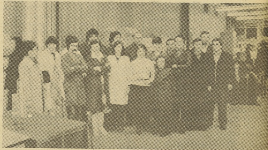
Dvajset srečnikov, ki so za novo leto dobili stanovanja.

Skladno z zahtevami zakona o združenem delu opredeljuje statut tudi vsebino zapisnikov vseh organov SOZD ter njihovo hrambo, dalje obveznosti SOZD do sindikata in drugih družbeno političnih organizacij, pri čemer ureja medsebojne pravice in dolžnosti organov SOZD ter sindikata, na koncu pa način sprejemanja, spreminjanja in dopolnjevanja statuta ter ostalih samoupravnih splošnih aktov.