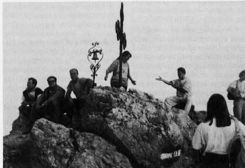
Škedenjska mladina na Lovcih