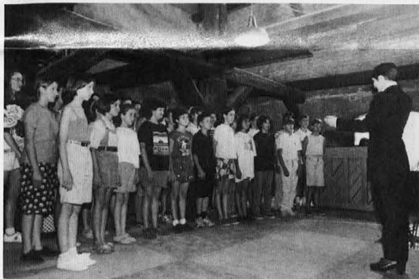
Posnetek s ponedeljkovega koncerta v Rižarni