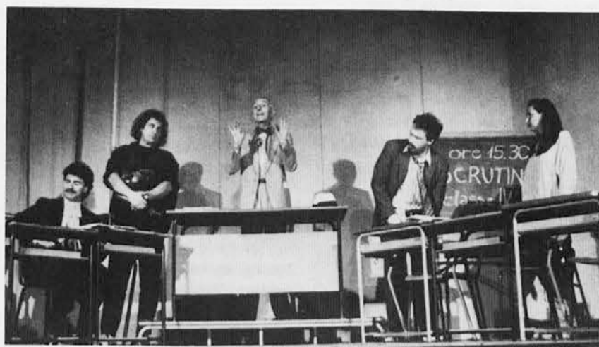
Ena izmed nastopajočih gledaliških skupin

V prejšnjih tednih sta potekala v Gorici dva poletna festivala: festival amaterskih gledališč in lutkovni Alpe Adria Puppet festival.