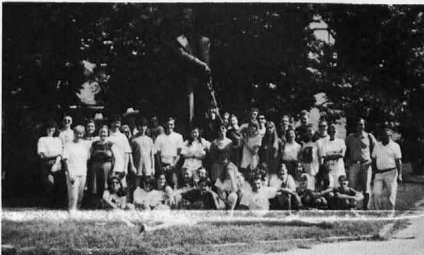
Goriški in tržaški maturanti