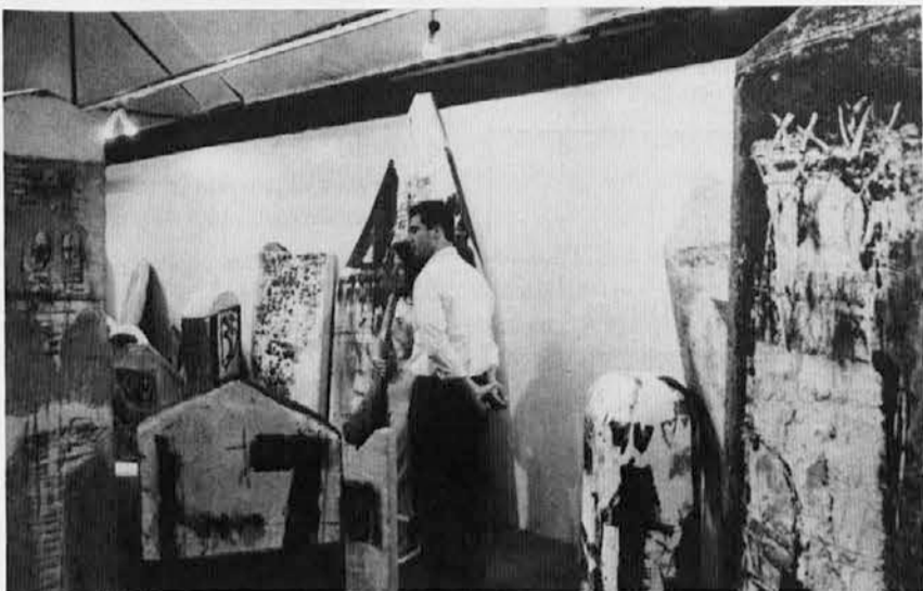
Pogled na razstavo Giorgia Celibertija