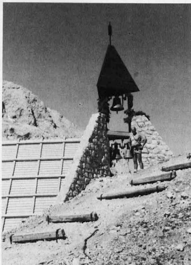
Postanek ob kapeli na Kredarici med poletno hojo v slovenske gore