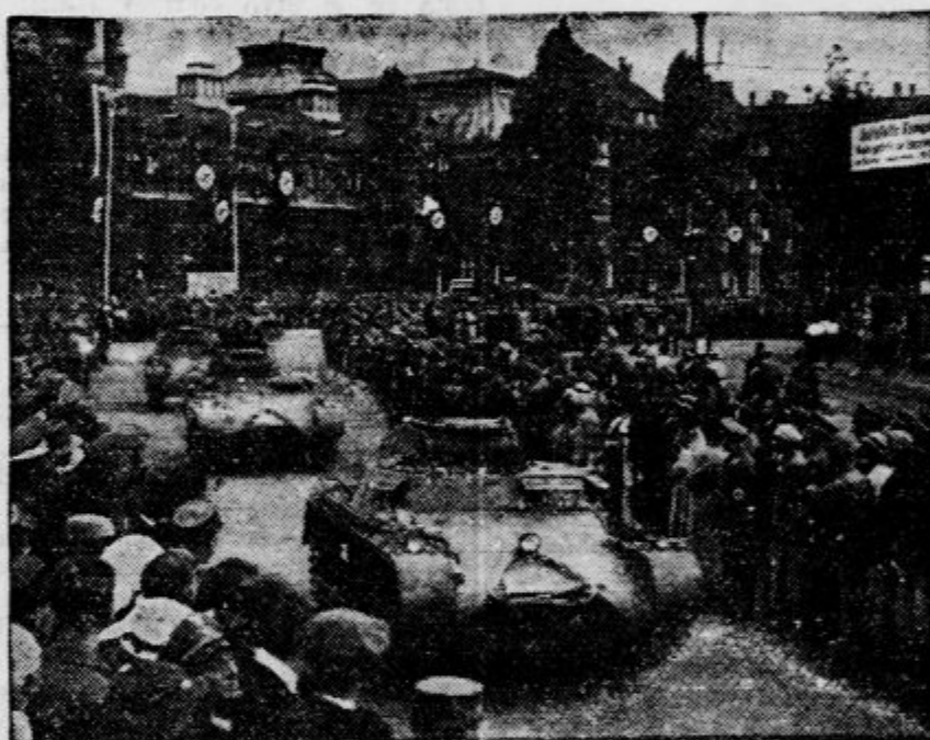
O priliki norimberskega kongresa narodno socialistične stranke so vozili po mestnih ulicah prvi nemški povojni tanki, ki so jih zdaj odkrito pokazali domači in tuji javnosti