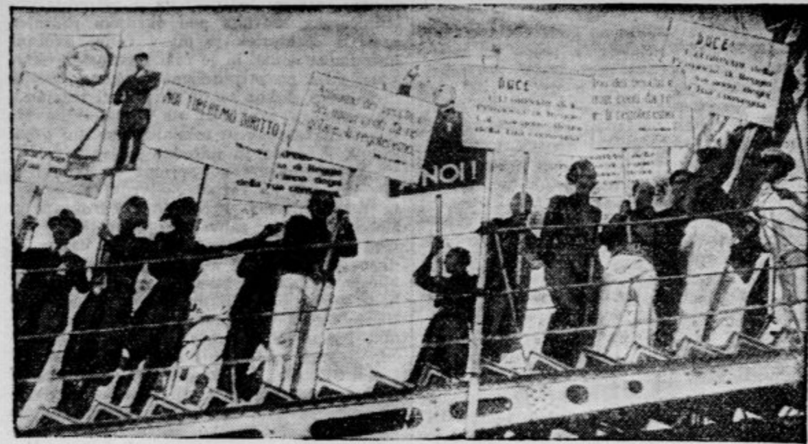
Italijanska ladja »Saturnia« v trenutku, ko je v Neapelju odrinila od brega s 4000 miličniki. Slednji vihtijo deske s citati iz Mussolinijeve govora, da ni več mogoče ustaviti fašističnega pohoda v Vzhodno Afriko