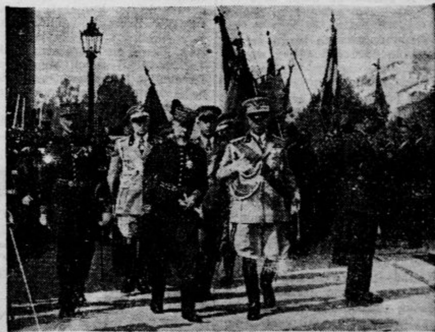
Maršal Badoglio je položil te dni na grob francoskega Neznanege vojaka spominski venec italijanske vlade. Poleg maršala koraka vojaški poveljnik Pariza, general Gouraud