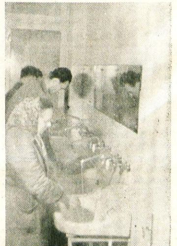
V modernih in higienskih kopalnicah in umivalnicah se delavci po delu dobro umijejo in tako preprečijo marsikatero bolezen

Vsak novinec, ki pride v tovarno Peko, mora opraviti tridnevni seminar, kjer se seznanijo z osnovami dela in s strukturo podjetja. S posebnimi predavanji so seznanili novince z varnostjo pri delu in o osebni higieni. Lani se od novo sprejetih delavcev ni nihče poškodoval. Letos bodo pripravili seminar za mojstre in predelavce, da jih bodo podrobno seznanili o varnosti na posameznih delovnih mestih. V podjetju še zdaleč ni poskrbljeno za varnost vseh delavcev tako, kot bi moralo biti, vendar, ko bo tovarna obnovljena, bodo tudi delavci delali v lažjih pogojih in bolj varno.