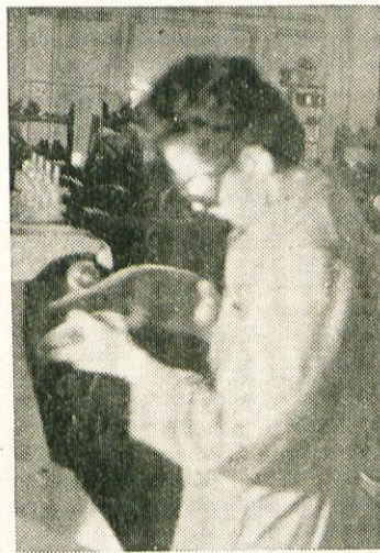
Delavec pri rezkalnem stroju ima zavarovane oči s posebnimi očali. Tako so preprečili stalne poškodbe oči

Z razvojem industrije se spreminjajo tudi delovni pogoji naših delavcev. Varnostna služba skrbi, da so delavci čim bolj zavarovani pred nesrečami in da delajo v zdravih prostorih. Nastali so številni novi poklici, ki se bavijo z varnostjo in z higiensko tehnično zaščito pri delu. Danes imamo po tovarnah varnostne tehnike in inženirje, industrijske psihologe, socialne delavce ter zdravnike specialiste za medicino dela.