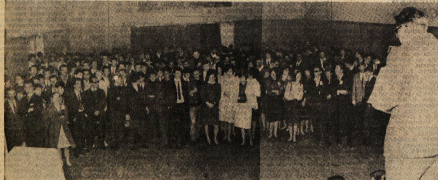
Pogled na dvorano med govorom

V svojem govoru je predstavnik Mladinske iniciative obsodil krivično ravnanje občine ob postavitvi spomenika padlim borcem za svobodo na pokopališču pri Sv. Ani