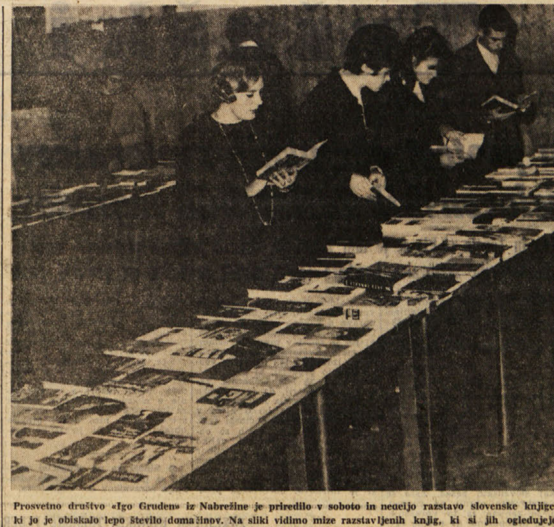
Prosvetno društvo «Igo Gruden» iz Nabržine je priredilo v soboto in neceljo razstavo slovenske knjige, ki jo je obiskalo lepo število domačinov. Na sliki vidimo mize razstavljenih knjig, ki si jih ogledujejo ljubitelji lepega slovenskega branja

DEVICA (od 23.8. do 22.9.). Danes v poslovnem pogledu ne boste najbolj pripravljeni, vendar vam bo sreča stala on strani U. Postavstvi moč vaši ravstvi. TEHTNICA (od 23.9. do 23.10.). Manjši spvr v delovnem kolektivu ne bo ogrozil obtega uspeha, nekega posla. Preridajte se tatančneje o iskrenosti nekega prijatelja, stva. SKORPIJON (od 24.10. do 22.11.). Spremenite svojo taktiko, dosleli boste ustrežnejše rezultate. Dan