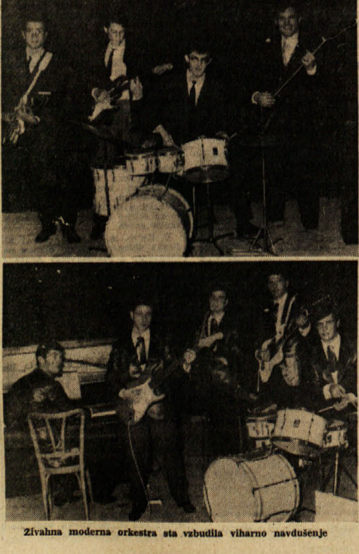
Zivahna moderna orkestra sta vzbudila viharno navdušenje

Nove srbske knjige Na dan praznovanja osvoboditve Beograda se je v knjižnih izlozbah pojavilo šest knjig 56. ko. la Srpske književne zadruge. Zadnja edicija te stare založniške hiše izpričuje novo usmeritev za ložbe, ki si prizadeva za lastno fiziognomijo in za prvo mesto med drugimi založnicami. Svojo najstarejšo zbirko «Kolo» b. zadruga v prihodnje posvetila najbolj aktualnim pojavom v jugoslovenski in tuji književnosti. Slova izmed najpomembnejših izložniških akcij zadruge do veliki antologija srbskega pesništva od 13. do 20. stoletja, ki bo začela izhajati v začetku prihodnjega leta. Ta založba bo izdala med drugim tudi zgodovino Slovenskega izpod peresa Milka Kosca.