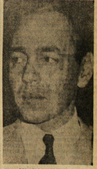
Maroški kralj Hasan