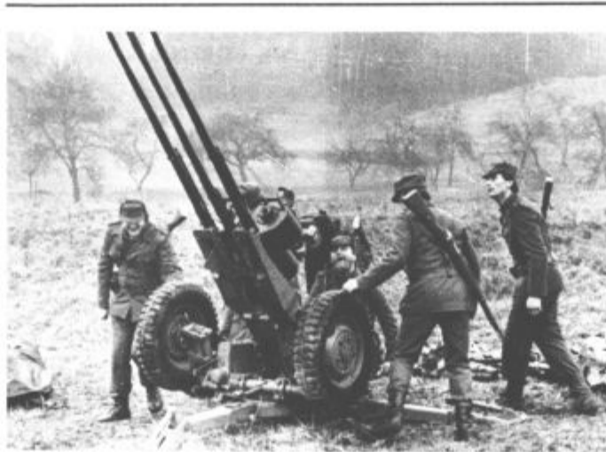
Enote TO imajo za protiletalsko obrambo v svoji sestavi tudi topne in rakete

O problematiki Rekreacijsko turističnega centra Golte so govorili na seji prejšnji teden tudi člani velenjskega izvršnega sveta. V celoti so podprli predlagani program za pokritje izpada finančnih sredstev in tudi vse aktivnosti, ki jih predlaga ta kolektiv. J. P.