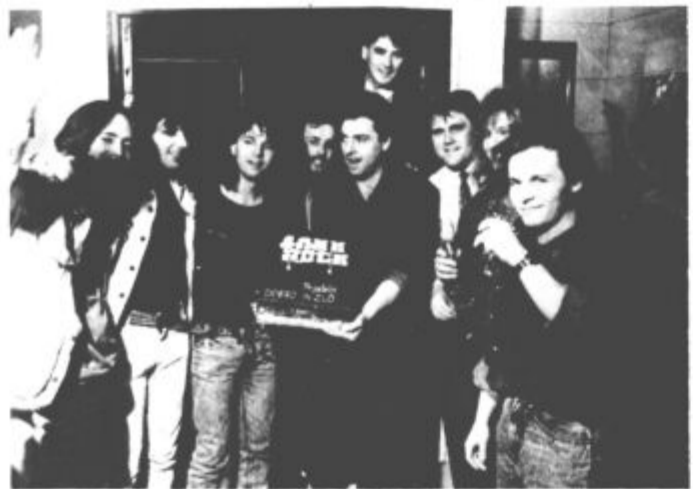
Upihnilni so svojo drugo svečo