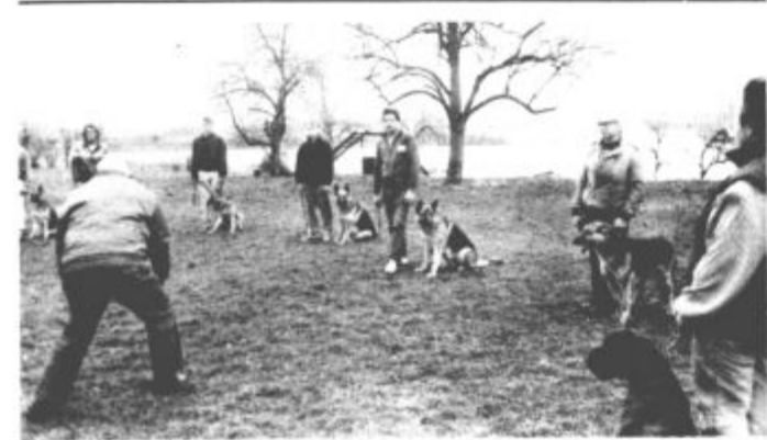
Šolanje rodovniških psov — Dvakrat na teden poteka na poligonu v Pesju šolanje rodovniških enoletnih psov za izpit »A« — osnove poslušnosti. Za šolanje psov je veliko zanimanje, tečaj pa vodijo člani Kinološkega društva. Šolanje poteka vsak ponedeljek in četrtek v tednu, tudi če dežuje. (L. O.)