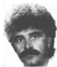
Piše: VINKO VASLE