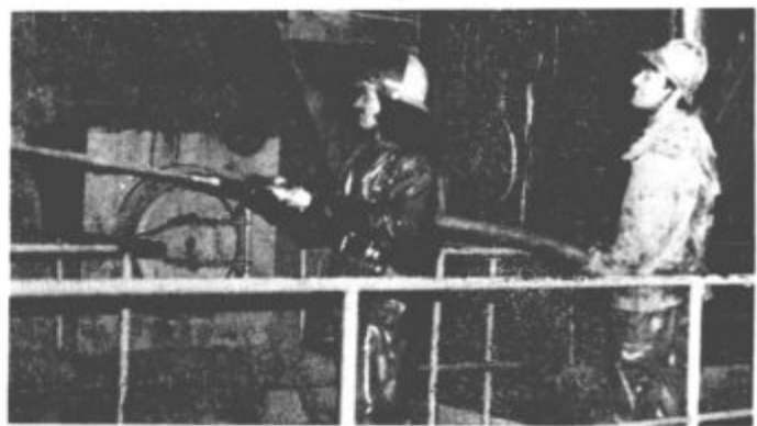
Čiščenje z vodnim curkom so opravili izkušeni gasilci