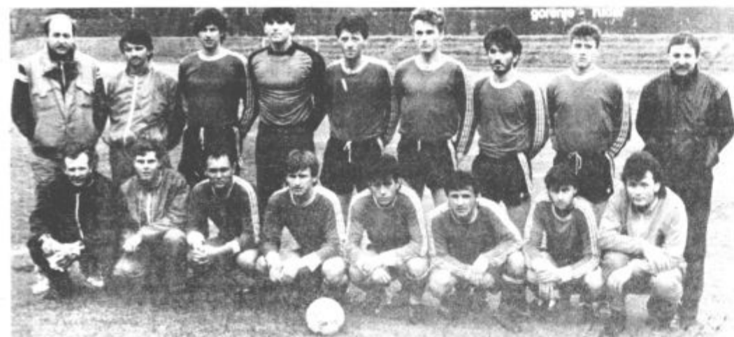
Rudar — bodo igrali za vrh? (vos)