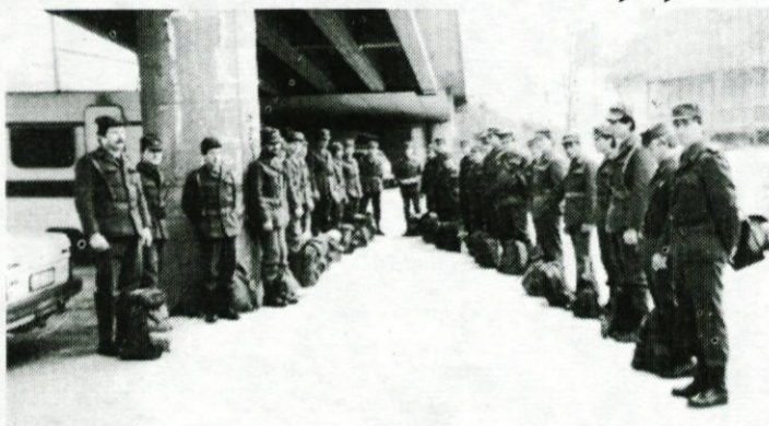
Pregled enot TO pred načrtovanim usposabljanjem