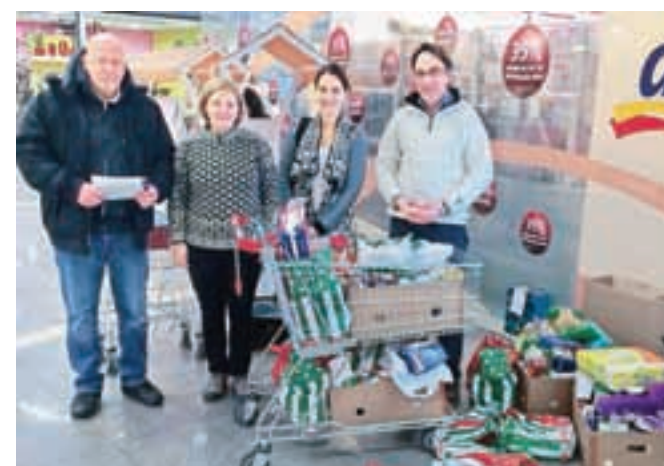
Dobrodelna akcija je med obiskovalci nakupovalnega centra naletela na izredno pozitiven odziv.

veliko dobrin. Ob zaključku dneva smo zbrane prispevke odpeljali k družinam, kjer so nas pričakali obrabi, polni veselja in predvsem hvaležnosti za hrano ter druge življenjske potrebščine. Članice in člani obeh dobrodelnih klubov bi se radi iskreno zahvalili vsem, ki ste nam pomagali pri zbiranju prispevkov za socialno šibke družine, predvsem pa vodstvu nakupovalnega centra Qlandia, ki nam je omogočilo izvedbo akcije. Izvedbo podobne akcije načrtujemo tudi v pomladanskem času, pred veliko nočjo, ko bomo ponovno zbirali hrano za kamniške družine.