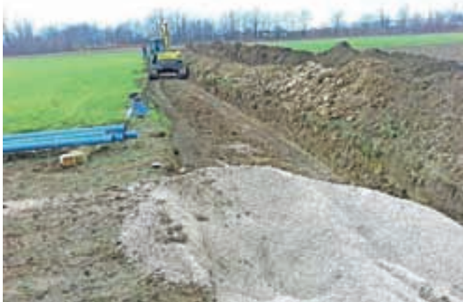
Zelena zima je gradbincem za zdaj naklonjena. Tako se gradi tudi vodovod med Volčjim Potokom in Šmarco.

kanalizacije v teh dneh polagajo tlačni vod skupaj z vodovodom od obstoječe transformatorske postaje do prvih hiš, saj na tem delu ni gravitacijske kanalizacije. Izvajalec pa je že končal z deli na stranskem kanalu, ki poteka pod opornim zidom. Nadaljuje se tudi gradnja kanalizacije v Stranjah; izbrani izvajalec je že začel z gradnjo stranskega kanala ST, ki poteka od obstoječe kanalizacije pri objektu Spodnje Stranje 5A naprej ob Stranjskem potoku. Skladno s terminskim načrtom se nadaljuje tudi nadgradnja Centralne čistilne naprave Domžale-Kamnik, katere solastnica je tudi Občina Kamnik.