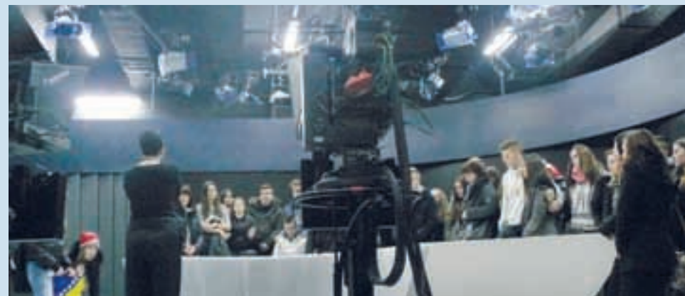
S sarajevskimi vrstniki v prostorih Aljazeera Balkans