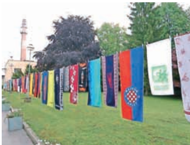
Svilanitove brisače bodo odslej nastajale v Turčiji.

nam v podjetju niso povedali. Prav tako o položaju neradi govorijo delavci, sindikata v podjetju sploh nimajo. V Kamniku bo po besedah direktorice ostala le minimalna proizvodnja, poleg nje pa oddelki razvoja, oblikovanja in trženja ter Svilanitova trgovina. Blagovna znamka Svilanit ostaja, a brisače, kravate in posteljina, ki so jih 75 let izdelovali v Kamniku, bodo odslej izdelane v Turčiji.