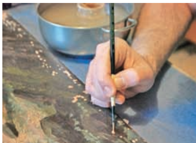
Konservatorstvo in restavratorstvo je Matevž združil s svojo ljubeznijo do slikarstva.