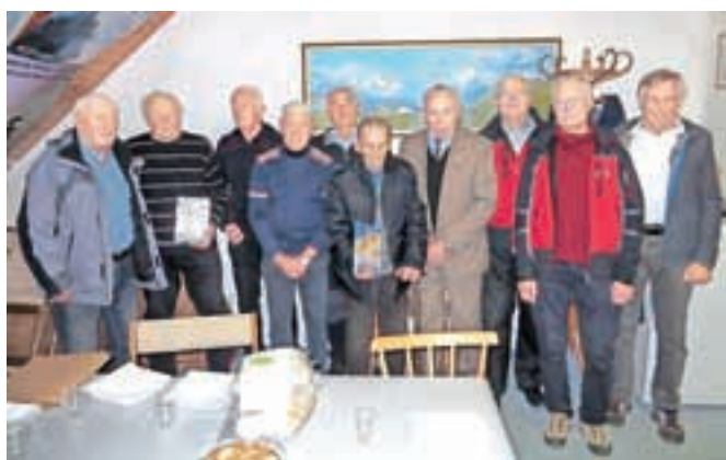
Jubilanti na družabnem srečanju