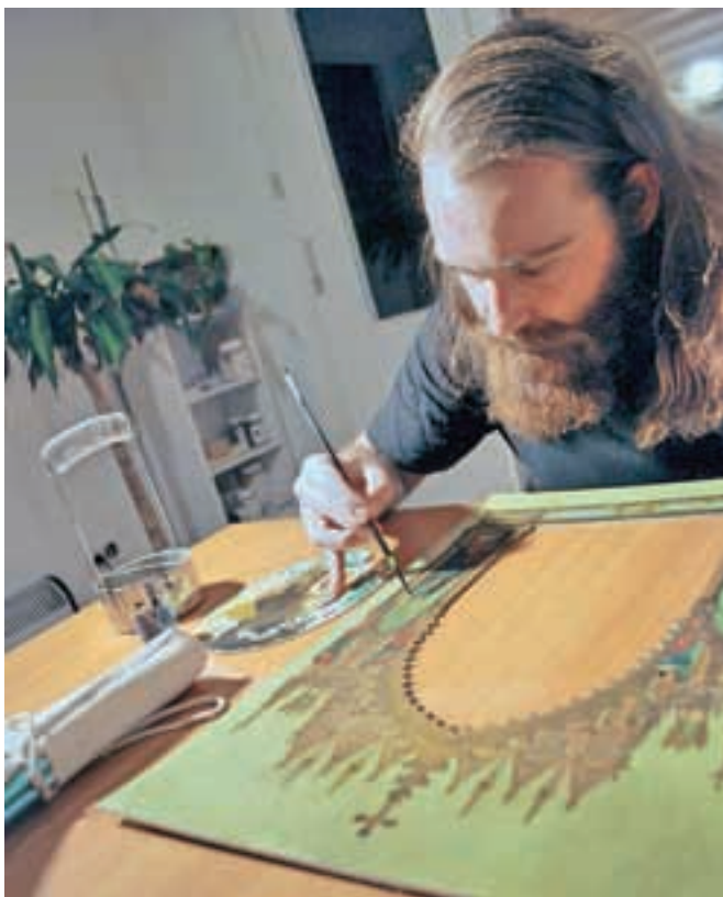
Poleg štafelajnih slik se ukvarja tudi z restavriranjem stenskih slik kamnite plastike, štukature, lesenih predmetov in pohištva.

večjo mero pazljivosti in so lahko zato dolgotrajni. Od prvih raziskav do zaključka posega lahko mine več let. Konservatorsko-restavratorski poseg sestavlja vrsta postopkov: menjava neustreznega podokvirja, odstranjevanje nečistoč, odtranjevanje porumenelega laka, utrjevanje slikovnih plasti, odstranjevanje platna za podlepljanje, kitanje, retuširanje, lakiranje «