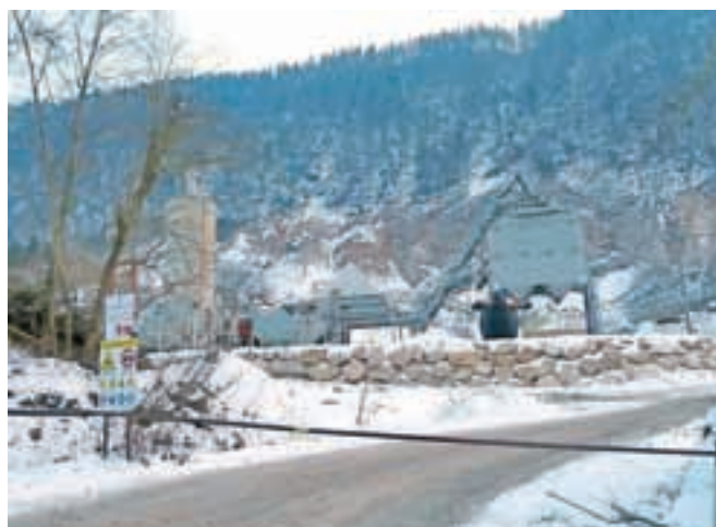
Peskokop Črna, kjer od oktobra deluje tudi mobilna asfaltna baza.

Z Inšpekcije za energetiko in rudarstvo Inšpektorata RS za promet, energetiko in prostor so nam sporočili: »Gradbeni inšpektor je 24. septembra lani odredil, da zavezanec v roku dveh