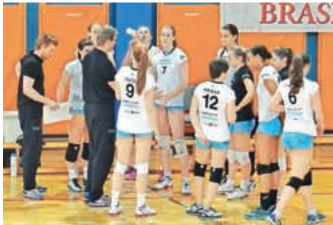
Kamničanke so v Braslovčah nepričakovano izpadle že v polfinalu pokala Slovenije.