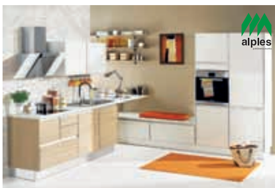
Akcija velja do konca meseca.