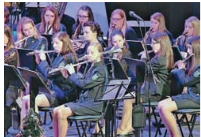
Mestna godba Kamnik je tudi ob koncu minulega leta pripravila svoj tradicionalni praznični koncert.

nepogrešljive kamniške mažoretke. Le dva dni za tem pa so dvorano znova napolnili glasbeniki Simfoničnega orkestra Domžale-Kamnik, ki so pripravili že 44. novoletni koncert in praznično vzdušje pričarali z deli Rossinija, Straussa, Puccinija, Leharja in Bizeta. Obeh dogodkov se je udeležil tudi župan Marjan Šarec, ki je nastopajočim čestital za glasbene uspehe, zbranim pa voščil ob praznikih.