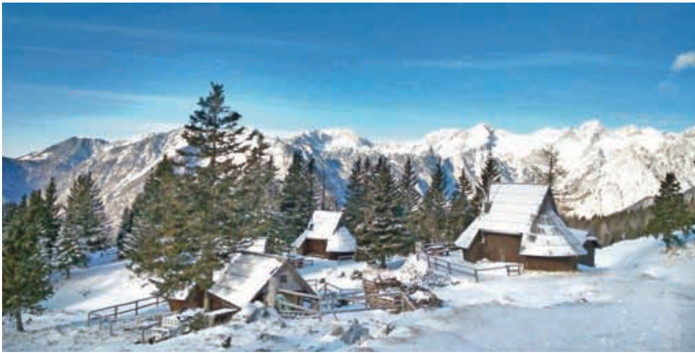
Na Veliki planini trenutno skorajda ni več snega, a narava ni tam gor zato nič manj privlačna.

Letošnja zima s snegom na Veliki planini še ni bila dovolj radodarna, in čeprav pravega smučanja na planini že nekaj let ni več, so v družbi Velika planina pripravljene tudi na zimsko sezono. Na zagon čaka nova otroška vlečnica, v začetku februarja pa bodo odprli še prenovljeno gostišče na spodnji postaji nihalk.