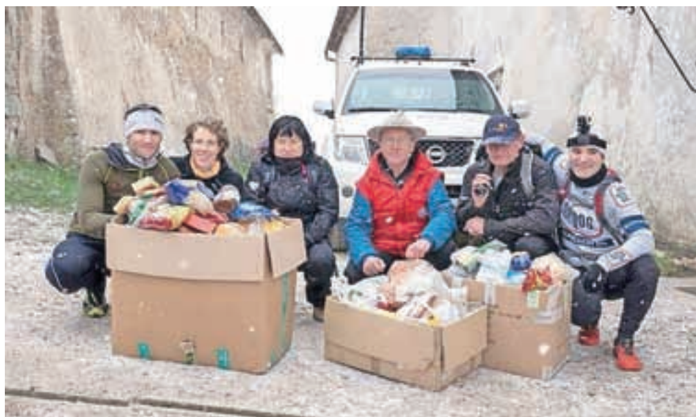
Zbirali smo hrano za Anino zvezdico in snežilo je

Vsako izvedbo lige skušamo tematsko obarvati in jo enkrat posvetimo varnosti, drugič teku trojk. V januarju se nam je pridružilo prenovljeno kamniško društvo AMD Kamnik, ki je najboljšemu ligašu dneva podarilo letno članarino AMZS plus. V prazničnem obdobju meseca decembra smo zbirali hrano za Anino zvezdico. Vsa od tekačev je do Sv. Primoža prinesel živilo