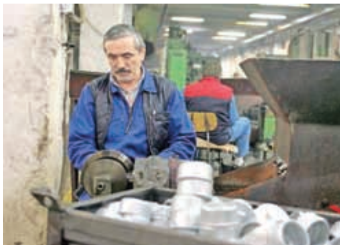
Zaposleni v podjetju opozarjajo na neznosne razmere, a direktor očitke zavrača.

Na Inšpektoratu RS za delo so nam potrdili, da so pred dnevi prejeli novo prijavo, ter dodali, da so v zadnjih