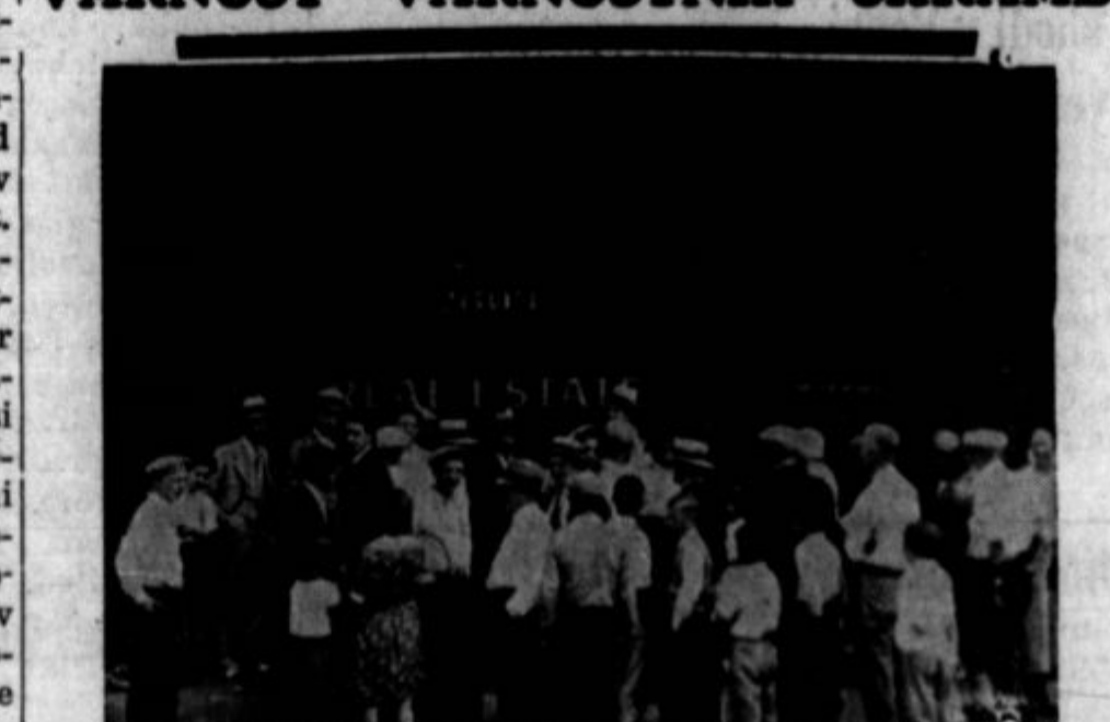
Ker so banke propadale druga za drugo, so si ljudje najeli takozvane varnostne shrambe (safety deposit boxes) ter spravili v nje svoj denar in druge vrednote. Te varnostne predale imajo banke in tudi firme, ki se pežajo s prodajanjem nepremičnin, transferiranji posojil in sličnimi posli. Prošli teden ponosi so udri roparji v varnostno shrambo firme Koch & Co. v Chicagu, kjer ima predale mnogo strank. Dobili so po raznih domnevah nad sto tisoč dolarjev v gotovini, vrednostne papirje pa so večinoma pustili. Na sliki je pročelje Kochove firme. Rop je bil izvršen ponoči.