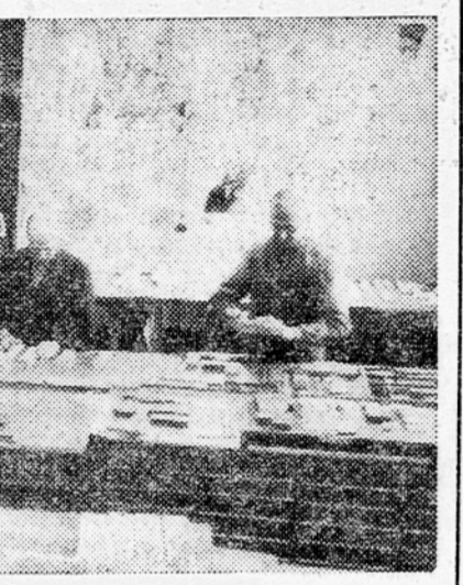
V ročni stavnici