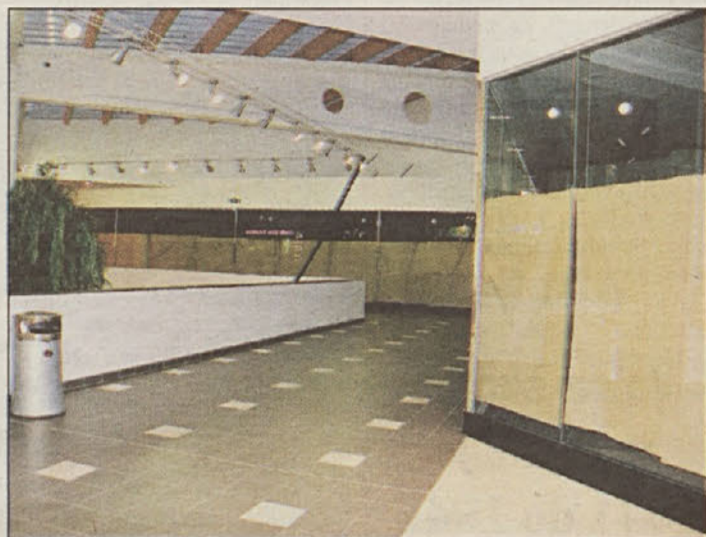
Tretjina poslovnih prostorov v Intermarketu je izpraznjenih.

mestu. Še v tem mesecu naj bi po oddaji naročila prišli do verifikacije variant. A gordijski voz med vsebinami dejavnosti, storitev in življenja v mestnem jedru ostaja nerešljiv.