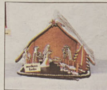
Jaslice za okras in pod zob

V ljubezni do njenega hobija, ki raste z nabiranjem izkušenj, nastajajo okraski za posamezne prazni-