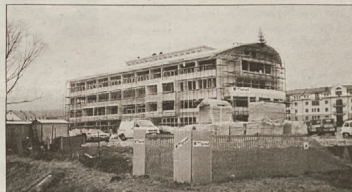
Po nekaterih ocenah je v okviru izgradnje ZD Krško opravljenih 85% gradbenih, 15% obrtniških del, 35% instalacij ter 45% zunanje ureditve.