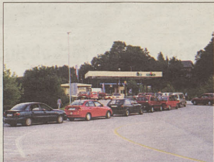
Na mejnem prehodu Slovenska vas je za leto 2002 obljubljena ureditev prometnega režima.

Promet na samem mejnem prehodu bo izboljššan z izgradnjo 800 m novih čakalnih pasov in krožiščem na njihovem drugem