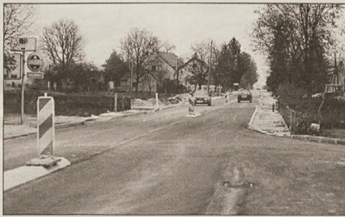
Dela povzročajo preglavice tako voznikom kot prebivalcem. Nasipi za dovoze k hišam, ki segajo do polovice voznega pasu, pa nejevoljo.

ceste s skoraj 143 milijoni SIT, občina Brežice pa v skladu s podpisanim sofinancerskim sporazumom prispeva dobrih 82 milijonov SIT. S.V.