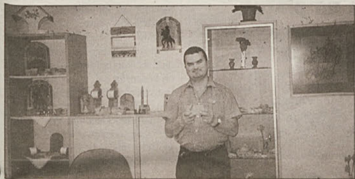
Izdelki varovancev Varstveno delovnega centra enote Sevnica

Krško, Sevnica - Varstveno delovni center Leskovec z enoto v Sevnici je z dnevom odprtih vrat pokazal, kako skupno 73 varovancev pod pedagoškim vodstvom preživlja vsakdanje varstvo. Izdelujejo lične okrasne in uporabne predmete, najbolj pa so ponosni na posebno leseno darilno em-