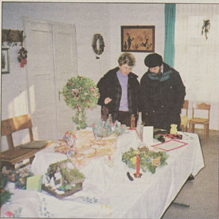
Obiskovalci so lahko našli vse, kar polepša decembrske praznike.

Dolenja vas – Sekcija za ročna dela Društva MePZ Žarek Dolenja vas je v začetku decembra v Gasilskem domu v Dolenji vasi na ogled postavila ročno izdelane božično-novoletne okraske in druga ročna dela. Ob otvoritvi so nastopili pevci sekcije ljudskih pevcev Ajda Društva MePZ Žarek. L.P.