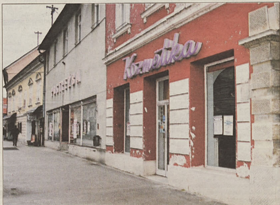
...na strani 3 Na Cesti prvih borcev ni ne domačinov in ne obiskovalcev, pa tudi "vsebin" zanje ne.

Zdaj kupna moč pada in ni več množic hrvaških kupcev, saj tudi pri njih na obrobju Zagreba rastejo nakupovalni centri. Zlasti v Brežicah, kot trgovskem središču, to dejstvo postaja kruta realnost. Osrednja ulica v Brežicah postaja – ulica duhov. Kaj in kje se mora premakniti, da bi mestno središče ponovno zaživel. Podobno je tudi v Intermarketu Brežice, kjer je uprava optimistična in napoveduje skorajšnjo zapolnitev praznih poslovnih prostorov. Najemniki pa imajo svojo zgodbo, in čeprav se bojijo govoriti, jo počasi že razkrivamo.