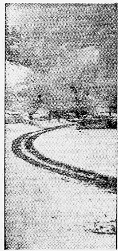
V Dolomitih je že zapadel sneg. Smetek je iz Srednje vasi.

Končno ureja zakon primere ujetništva, prisilnega dela, zapora, internacije, konfinacije, deportacije in prisilne izselitve s temi primeri tudi čas zapora, čas v taboriščih ali internaciji zaradi sodelovanja v bivi; španski republikanski armadi ali v vojaških oboroženih formacijah antifašističnega gibanja v drugih državah. Tudi tu ne bo velike razlike nasproti sedanjemu stanju in že sedaj utrjena praksa tudi v bodoče ne bo delala prevelikih težav pri priznavanju te dobe. Navedsti moramo tu samo pogoje, ki upravičujejo zavarovance za štetje navedene dobe v pokojninsko dobo. Prvi pogoj je, da so bili zavarovanci neposredno pred navedenimi okoliščinami ukrepi oziroma v drugi skupini primerov neposredno pred vstopom v oborožene formacije v delovnem razmerju; kolikor na tega pogoja ne izpolnjujejo, terja zakon, da imajo vsaj 15 let vstevne delovne dobe. V to delovno