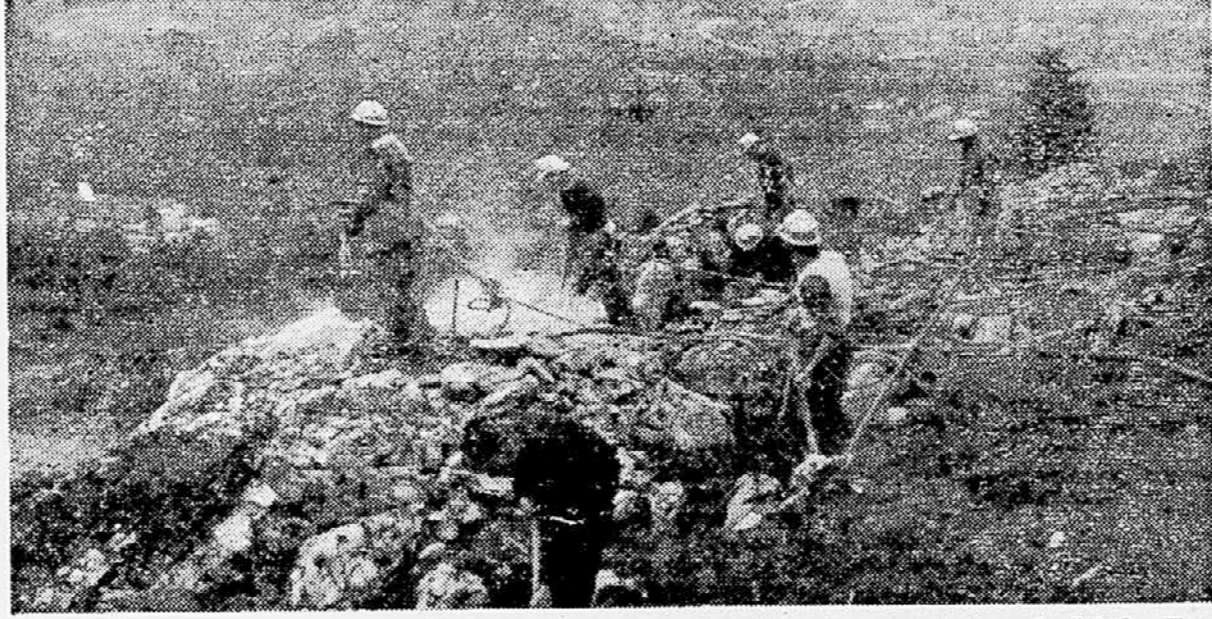
Praktično delo minarjev - tečajnikov na Verdu. Vsi minirji imajo varnostni pas in čelado. Ko opravljajo svoje delo, so z vrmi privezani, da zaradi morebitnega padea ne pride do nesreče. Opraviti morajo vse faze dela, od vrtnja od vrtnja z rračnimi kladivi, do polnjenja vrtnj z razstrelivom in do odstrela z vžgalno vrvice, z elektriko ali z detonacijsko vžgalno vrvice.

Res bi bilo dobro, urediti vse to do sezone; tudi zato, ker je verjetno, da bo dotlej moderniziran še cestni osek od Petrijne do Kasteleca in bo torej cestna zveza od Ljubljane do morja vsa moderna in varna. Kakšna škoda (tudi na času), če bi morali avtobusi samo zaradi teh dveh postaj, oziroma zato, ker ju ni, izgubljati čas zaradi vožnje delno še po stari cesti.