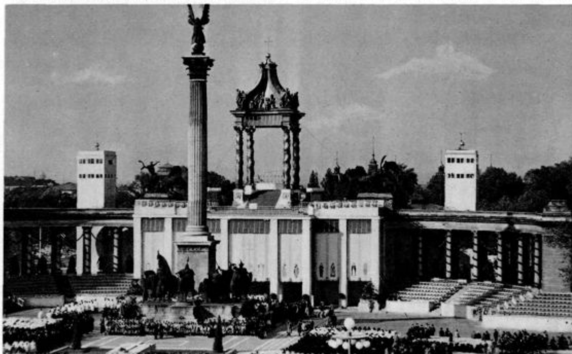
Kongresni oltar v Budimpešti

Rad trpim v vicah, saj bom tam že na varnem, da te več ne izgubim. O Jezus, samo zadnji koticček vic mi daj, pa bom že srečen.