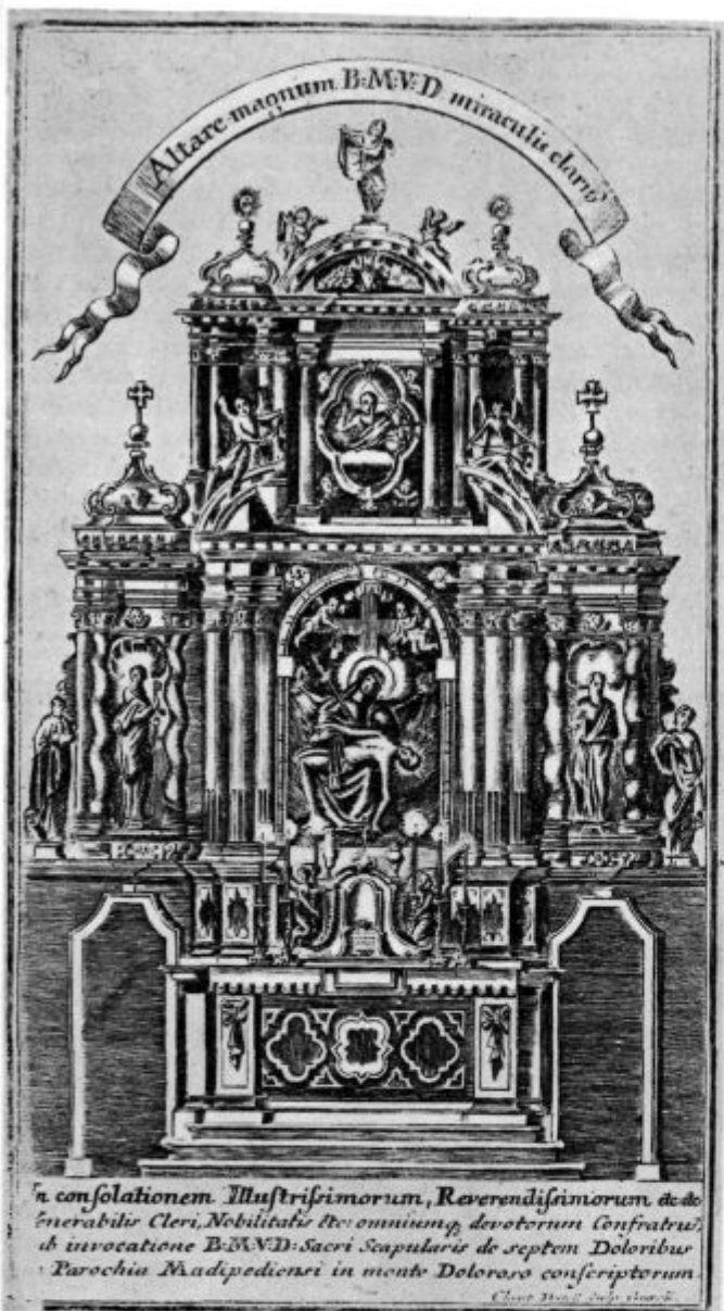
Stara slika velikega oltarja Z. M. b. na Zalostni gori pri Mokronogu

jo dobil, zato si pa tudi ne upaš nanjo odgovarjati.«