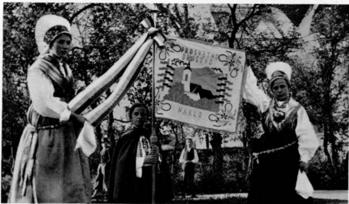
Novi prapor prosvetnega društva v Naklem

Tisti mali deček je z zavezanimi očmi in z golimi rokami stopil na oder. Zdaj je poglobil roko v posodo, izvlekel listek in ga iz-