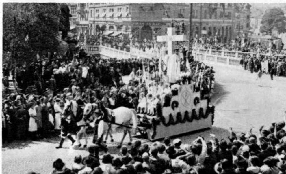
Spomn na mednarodni mladinski tabor v Ljubljani od 26. — 29. junija 1938 Simbolična slika „Vera“ v slavnostnem sprevodu

1. Jako ličen bakrorez večje oblike, ki kaže veliki oltar. Napis se glasi na gornjem delu: Altare magnum B. M. N. D. miraculis claris — na spodnjem pa: In consolationem Illustrissimorum, Revendissimorum etc. etc. Venerabilis cleri, Nobilitatis etc. omniumq. devotorum confratru' ab invocatione B. M. V. D. Sacri Scapularis de septem Doloribus in Parochia Madipediensi in monte Dolorosa conscriptorum. Sliko je vrezal v baker Christian