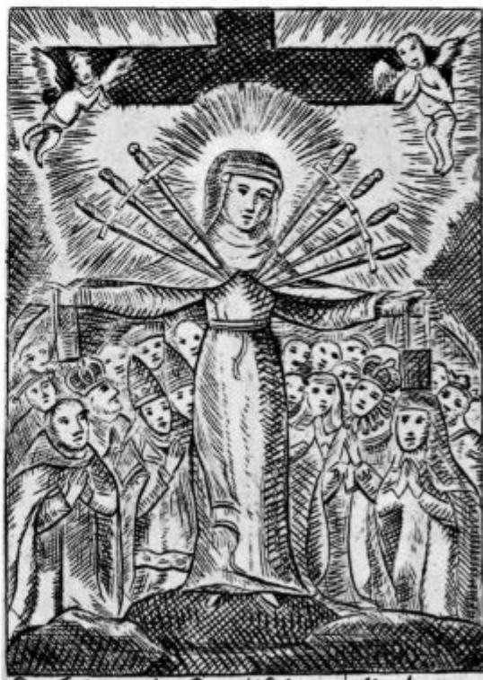
Confraternitas Sanctissimae Matris Dolorosa Sacri Scapularis in Parochia Madipediensis in Monte Dolorosa Anno 1717 Mensis Die