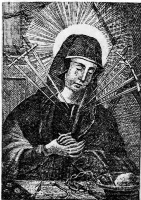
Vera effigies Originaria et taumaturga Imaginis B. V. M. 7 Dolorum monte Doloroso penes Madipedium.

Na zahodni strani Mokronoga se vzdiguje prijazna Žalostna gora, s katere je kaj lep razgled po vsi šentruprski dolini, ki se šteje med najlepše na Dolenjskem. Kdaj je bila zidana na tem griču cerkev žalostne Matere božje in kaj je bil povod, da so jo sezidali, ni nič