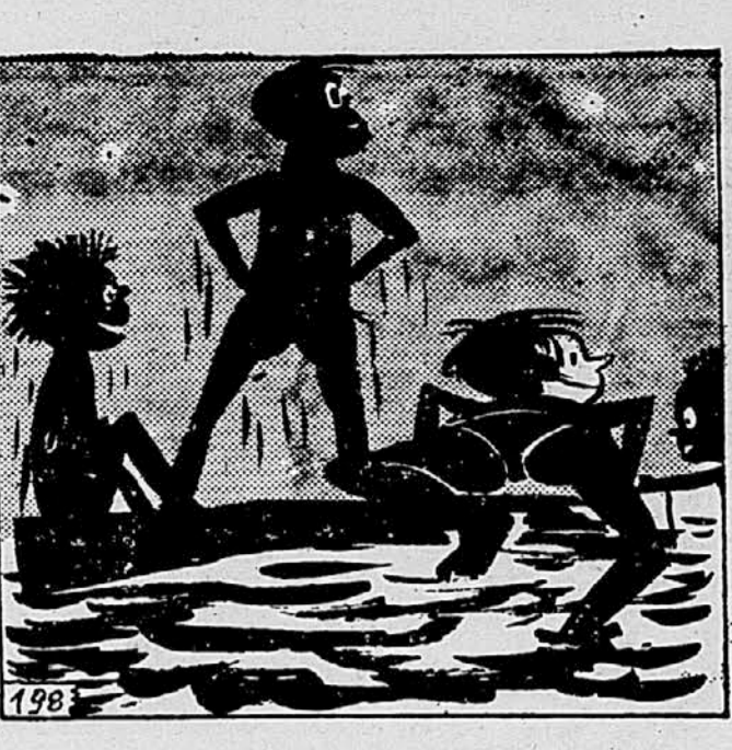
198. Nekaj krepkih zamahov in že so pristali na deski. Res so se imenito počutili. Voda je bila prijetno topla, le večerni veter jih je nekoliko hladil. Pa kaj zato, če je koga zaredilo, se je potunkal v morje, kjer je bilo mehko in toplo.