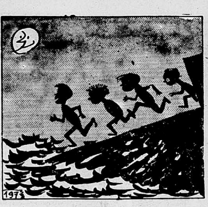
197. Naši prijatelji so se nekoli sklenili, da se bodo kopali ponoči. Tudi se je sililo ob prijetnostih in lepotah plavanja v mesečini, da so se nekoga lepega večera odločili in stekli v morje, ki jih je podpiralo s svojimi od mesečnih šarkov posrebljenimi valovi.