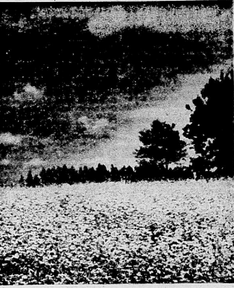
Ko ajda cvete

Kakšne organizacijske oblike pospeševanja kmetijske proizvodnje na Barju, bi glede na njegovo proizvodjalne možnosti ustrezale, je sedaj še težko reči. Sicer pa bo to stvar same poslovne zveze in njenega programa dela, ko bo enkrat ustanovljena. Namen tega sestavka je bil namreč samo ta, da pokaže na nekatere probleme, ki so povezani z ustanavljanjem kmetijsko-proizvodjalnih poslovnih zvez za tako obdelovalno območje, kot je na primer Ljubljansko barje.