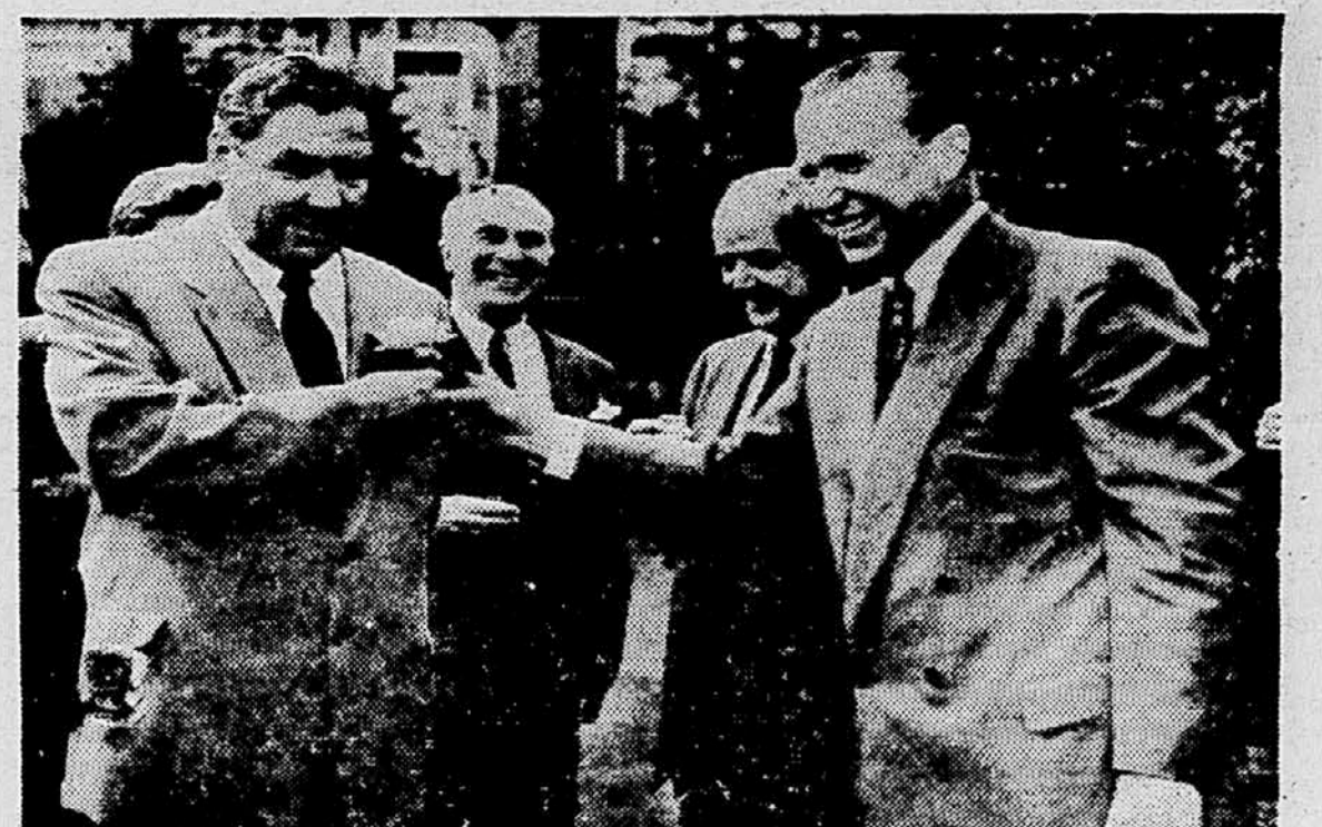
Sovjetski zunanji minister Sepliov je med londonsko konferenco o Suezu povabil na kosilo v sovjetsko veleposlanstvo tudi francoskega zunanjega ministra Pineauja. Na sliki: Sovjetski veleposlanik v Veliki Britaniji Jakob Malik opravlja Sepliovo rožo v gumbici. — Pineau je tudi navzoč (drugi z desne strani)

Tretje vprašanje pa se nanaša na dodelitev mest članom občinskega odbora in na imenovanje podžupana, za podžupana je