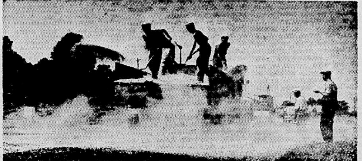
Gradnja in obnovi cest povečamo sadnji čas pri nas vse večjo skrb. Tako obnavlja te dni Okrajna uprava za ceste Ljubljana s posebno potrpano obdelavo lokalno ceste Črnuče-Sentjakob ob Savi in Sentjakob-Domača. Celotna dolžina obnavljane ceste bo okrog 8 km.