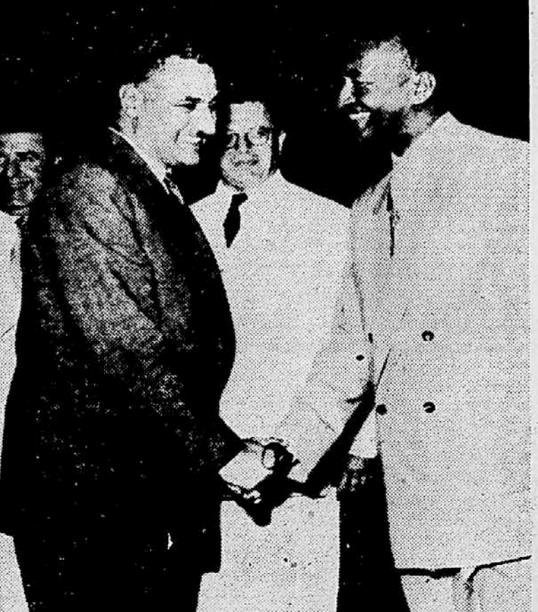
Egiptovski predsednik Naser je v palači Tahira priredil slovesno večerjo na čast arabskih delegatov, ki so prišli na konferenco političnega odbora Arabske lige v Kairo v zvezi s Suesko krizo. Na sliki: predsednik Naser (na levi) se rokuje s sudanskim ministrom za zunanje zadeve El Sajed Mohamed Ahmed Mahgubom.