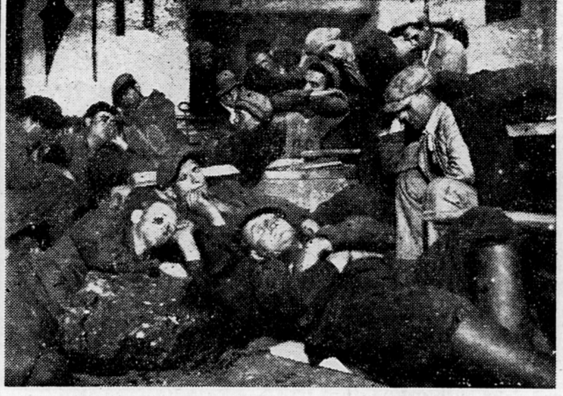
Meseca junija 1934 je Trboveljska premogokopna družba napovedala znižanje rudarskih mezd na 6%, ukinitev deputatnega premoga in nove redukcije delavcev v vseh obratih. Ker vsa posredovanja in protesti niso pomagali, so se konec meseca v Trboveljah in Hrastniku začele gladovne stavke rudarjev v rovih in tudi na separacijah. Kjer je kdo delal, tam je ostal brez hrane, in vozčke, s katerimi so jim družine pošiljale nekaj hrane, so rudarji iz jam pošiljali nazaj s sporočili, da bodo vztrajali, dokler družba ne preklicuje svoje napovedi. Šele po 4 dneh se je to zgodilo. (Na sliki stavkajoči v obratu Dobrni.)