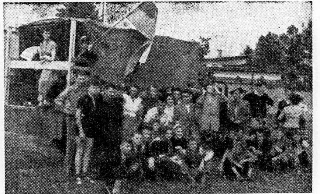
Mladina, ki je na festivalu v Bujah, obiskuje okoliške vasi. V nedeljo pa se bodo vsi zbrali v Koprno na zaključni prireditvi.

Iz Sarajeva so poslali zdravniške ekipe za pomoč ponesrečenecem, izvršni svet LR Bosne in Hercegovine pa je poslal strokovnjake za pomoč organom ljudske oblasti na terenu. Tudi državni zavarovalni zavod je danes odposlal svoje komisije v prizadete kraje, da bi ocenile