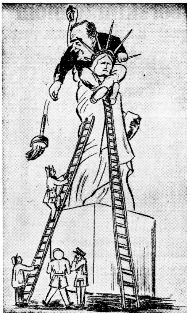
McCarthy: »Sedaj me ne spravite več dol le«

London, 18. jun. (Tanjug). Danes je bil drugi sestanek britanske vlade v tem tednu. Kakor se je zvedelo, so v glavnem pretresali domača vprašanja, med drugim tudi vprašanje plač narodnih poslancev. Vlada je verjetno proučila tudi zadnja poročila britanskega ministra za zunanje zadeve Edena iz Ženeve ter priprave za bližnji obisk predsednika vlade sira Winston Churchilla v Washingtonu.