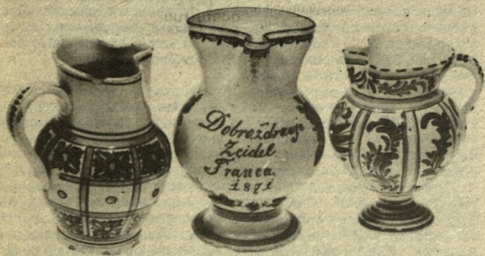
Majolika — izdelek tovarne v Nemškem dolu z napisom in letnico 1871 med dvema majolikama, ki sta bili izdelani v Schützovi tovarni v Kasazah. Nahajajo se v Pokrajinskem muzeju v Celju.