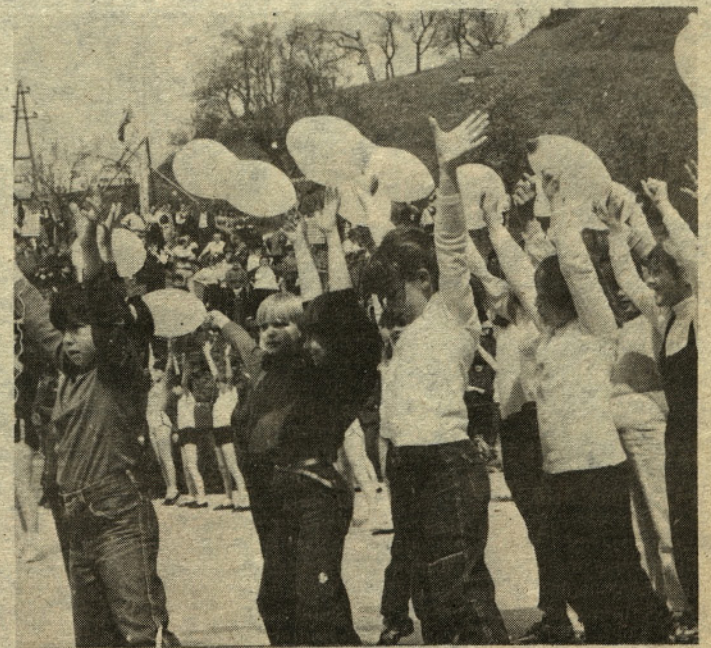
Ne samo s pesmijo »Ko si srečen . . .« ampak tudi z nastopom so najmlajši izrekli zahvalo borcem za to, da so lahko srečni in se v miru igrajo.

Tekst: J. KROFLIČ, T. TAVČAR