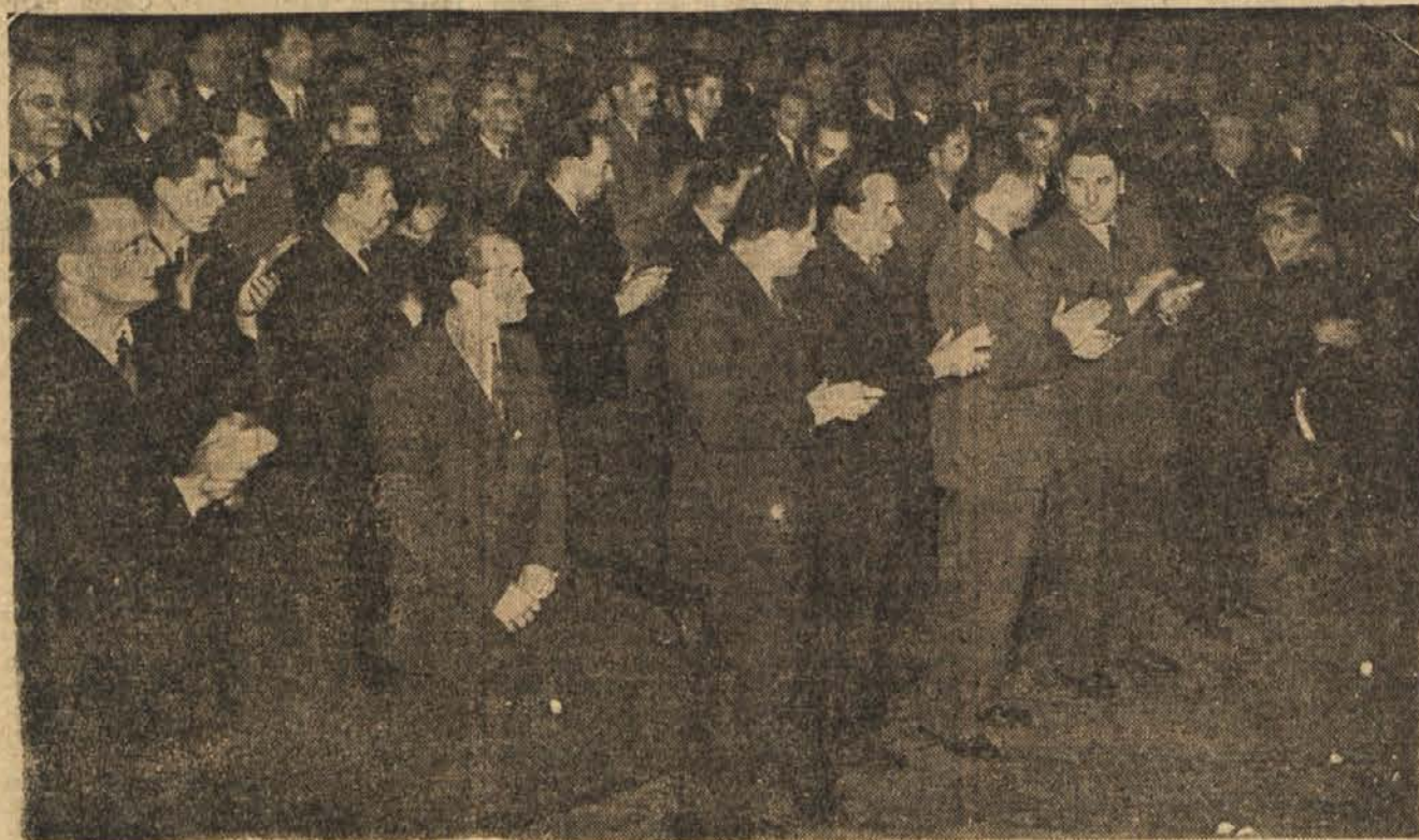
Pogled v dvorano, v kateri zaseda I. kongres ESJ. V prvi vrsti so člani Politbiroja CK KPJ tovariši Milovan Djilas, Boris Kidrič, Ivan Gošnjak, Aleksander Ranković in Moša Pijade

Živel naš ljubljeni voditelj tovariš Tito!