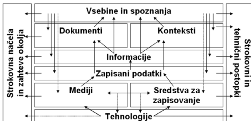
Slika št. 1: Poenostavljeni model relacij osrednjih entitet pristopov reševanja arhivskih strokovnih problemov

In archives a great attention is given to the rationalization of the professional processes and to the demands on professional treating of archival material. These include not only activities in the original documents, but also their wide range of reproductions and archival finding aids, including the management of historical, material-technical and user's context. Basic units of treatment of archival content represent a variety of recorded data. In the archival theory and practice the "data"