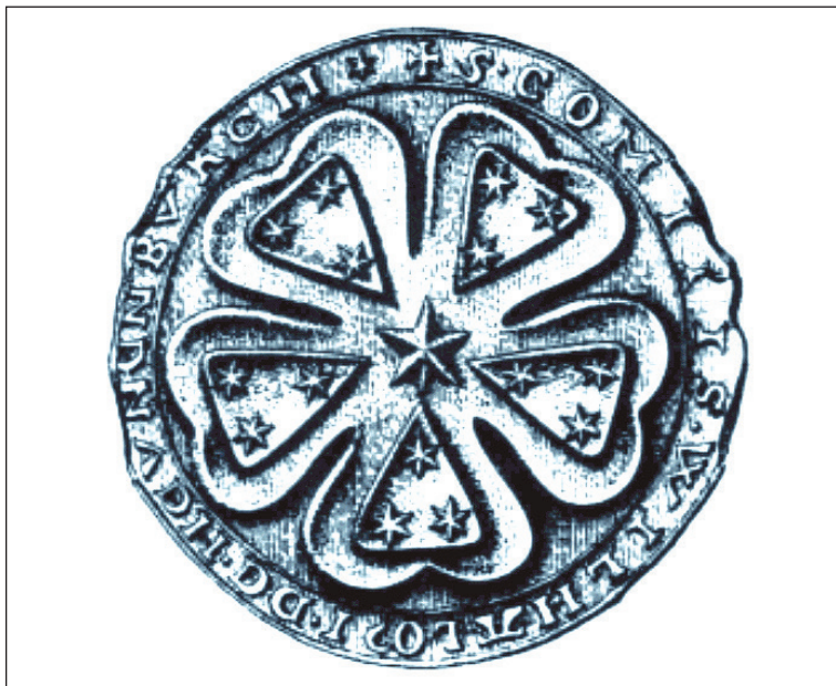
Slika 2: Pečat grofov Vovbrških iz sredine 13. stoletja.