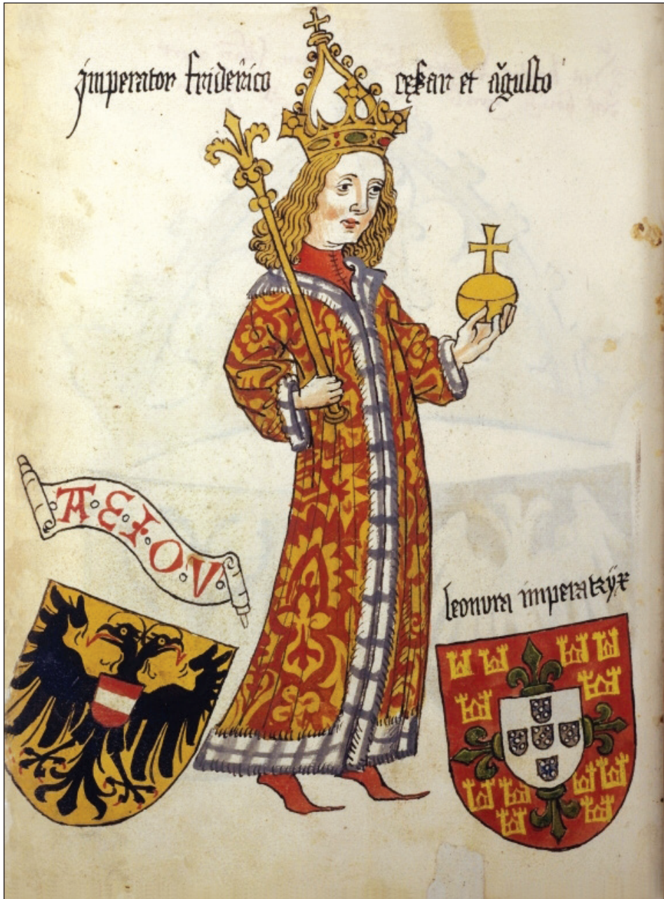
Slika 3: Friderik III. Habsburški, kot upodobljen v zadnji tretjini 15. stoletja.