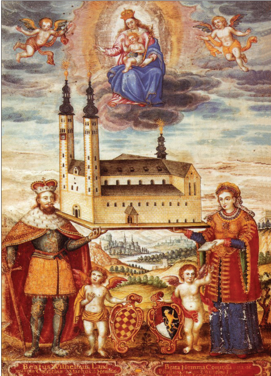
Slika 1: Hema in Viljem, kot upodobljena v 17. stoletju.