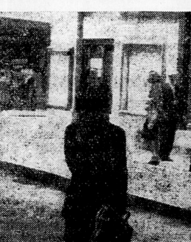
V »Tednu prometa« sodelujejo pri urejanju prometa tudi mladinci — pomožni prometniki. Mladinec opozarja pešca, kje mora prečkati cesto

Prav posebno je treba paziti pri prehitavanju. Prehitavanje je dovoljeno, ni mimo leve strani tistega vozila, ki ga hoče vozač prehiteti. Vozač prehitavečega vozila pa mora dati vedno znamenje s trobilom, da opozori sprejdeno vozilo na prehitavanje. Sprejdeno vozilo se mora umakniti, kolikor mogoče na desno in v času prehitavanja ne sme nikdar povečati svoje brzine. Pri prehitavanju mora