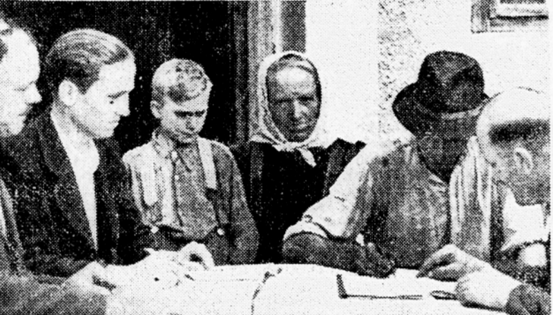
V Moškancih pri Ptujju podpisujejo pogodbe za odkup prostih presežkov žita

V Vojvodini je do 13. t. m. sklenilo pogodbe za odkup prostih presežkov žita že 8637 kmetov in 294 združev. Največji uspeh je do tega roka doseglo odkupno podjetje »Zitoprometec« v Subotici, ki je sklenilo odkupnih pogodb za 241 vagonov prostih presežkov žita. Na drugem mestu je bilo podjetje »Zitoprometec« v Zrenjaninu, ki je odku-