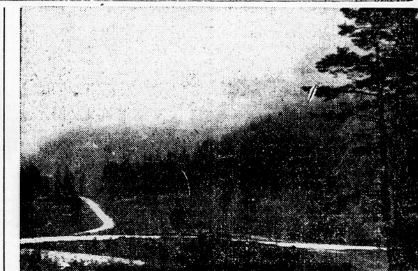
Na Romanji planini pelje pot proti Hanjესku

Bosna je bila v vojni najbolj prizadeta, toda videti je treba na svoje oči, s kakšno voljo in poirtvovalnostjo Bosanci obnavljajo svojo ožjo domovino ter istočasno grade prve elektrarne in tovarne v okviru petletnega plana. Ta, nekdo toliko zastala država, bo v najkrajšem času ena prvih republik v državi. Za razvoj turizma je letos predvideno 34 milijonov din, obnovljenih je bilo že 18 hotelov z-