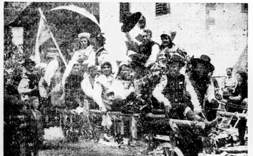
Festival v Stični: Skupina narodnih noš iz St. Vida na Dolenskem