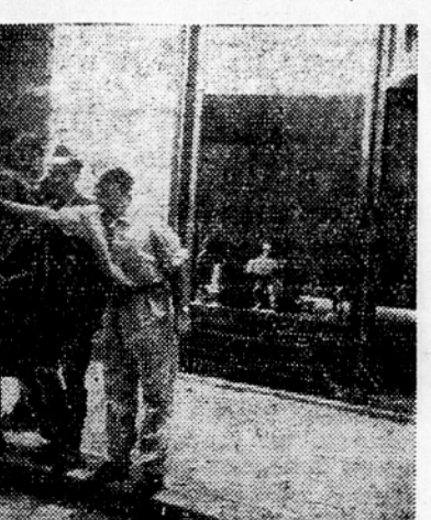
V »Tednu prometa« sodelujejo pri urejanju prometa tudi mladinci — pomožni prometniki. Mladinec opozarja pešca, kje mora prečkati cesto

vozač že v primerni razdalji prehajati na levo. Čim manjša je brzina sprejdenega vozila, tem večja mora biti razdalja, ko prehaja vozač na levo in prehitava sprejdeno vozilo. Ko prehitivo vozilo, mora vozač zaviti le polagoma zopet na svojo desno stran, toda nikdar ne tik pred vozilom, ki ga je prehitel. Prehitavanje tramvajev je dovoljena samo na njegovi desni strani, čim je med tramvajem in desnim robom vozišča dovolj širok prostor za prehitavanje. Samo, če je