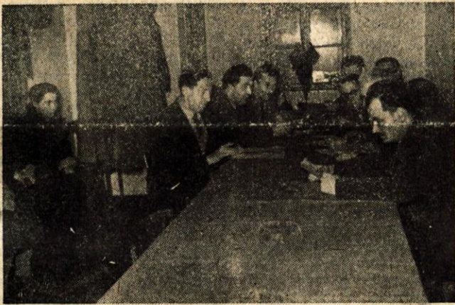
PRIPRAVE ZA VOLITVE POTROŠNIŠKIH SVETOV

V kranjski občini je te dni vrsta sestankov, na katerih pretesajo vlogo in pomen potrošniških svetov, ki jih bodo izvolili prihodnji teden