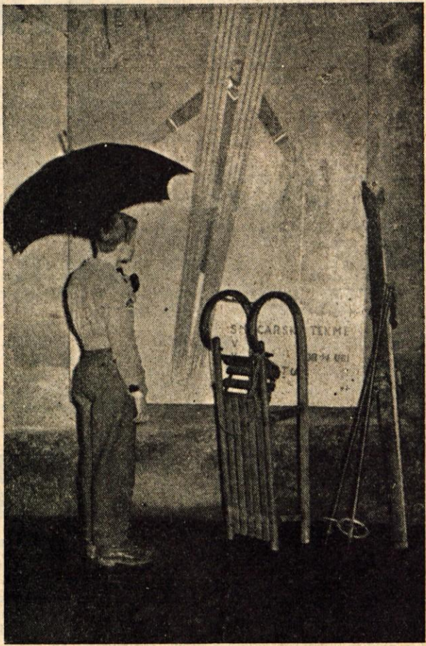
BO — ALI NE BO?

Subvencioniranje zgornje vrste zgleđa, da je danes in tukaj že postalo potuha kriminala. ABC