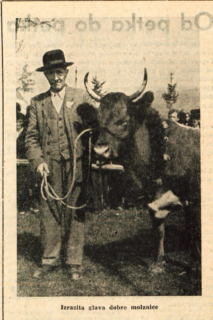
Izrazita glava dobre molznice

Za ureditve tega smotra pa sta potrebni še dve stvari. Rejci morajo postati boljši pridelovalci krme, zadržna organizacija pa mora dokončno urediti in izpopolniti organizacijo odkupa mleka.