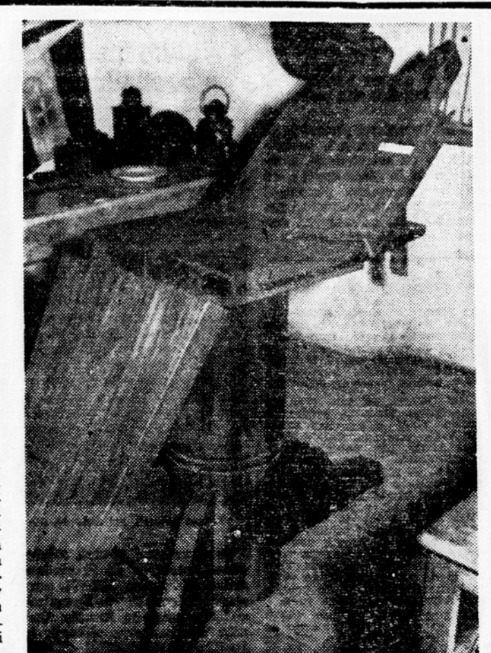
Lesena operacijska maza in civilna bolnišnica v Kanizariji

Italijani so v vsej dobi poslali lepo število granat iz svojih topov sem gor, učinek pa je bil majhen, le nekaj ranjencev. Poslopja so pa seveda vsa uničili in požgali. Zadnjič so pošiljali svoje »pakete«, tako smo jim rekli partizani, na sam dan kapitulacije Italije, to je 8. septembra proti večeru, ko je bila na Mavrenu zbrana velika množica Belokranjcev iz krajev od Vinice, Starega trga in Gradaca do Črnomlja, na mitingu, ki so mu prisostvovali tudi člani IO OF in CK KPS. Iz ruševin je v tej nekdanji