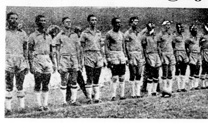
Nogometna reprezentanca Brazilije

(Od našega posebnega dopisnika) Baseli, 20. jun. (Po telefonu). — Pred nad 50.000 gledalci je danes madžarska nogometna reprezentanca, ki ni igrala z vsa svojo močjo, brez težav upornila Nemecku. Nemeški nogometaši ves čas igre niso bili resni in enakovredni nasprotniku, pri čemer pa je treba vedeti, da je trener reprezentance Sego Herberger poslal na igrišče močno oslabljeno garnituro brez skoraj vseh najboljših igralcev, ker jih je hotel očuvati za važnejše in odločilne tekme v drugem, in tretjem kolu. Vredni igralci našega moštva so bili: Hidegkuti, na položaju levi krilni igralec, ki je bil glavni nosilec vseh nevarnejših akcij na nasprotnikovo stran. Na njegovi višini je igral še srednji napadalec Fritz Walter, vendar ni vzhajal do konca slednjic, ki so jo skušali urediti Nemecku, ki na bil pozneje po-