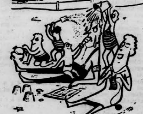
— Ah, ali ti ni lepo, ko se lahko ukvarjaš z otroki?