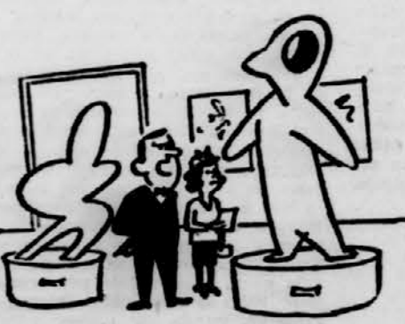
— Tole je pa gotovo hiparjev avtoportret.