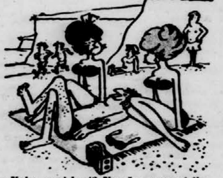
— Kako, moj brat? Ves čas sem mislil, da je tvoj brat!