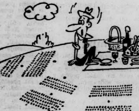
— Pohitival! Mravlje se pripravljajo na ncpad ...