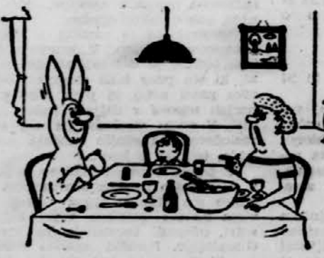
— Lahko bi kar naravnost povedal, da si že sil silose!