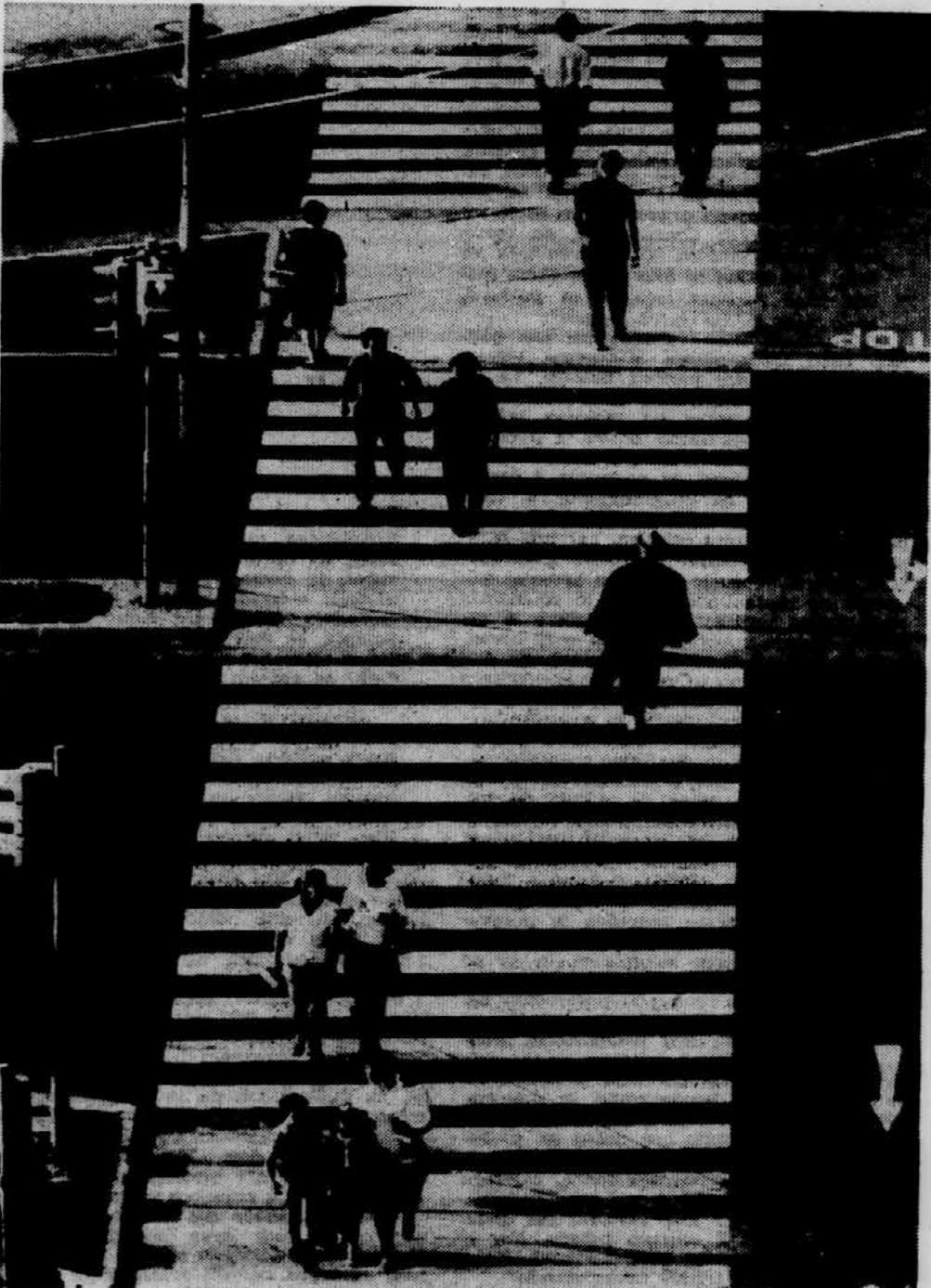
VLASTJA: UKROČENE SMERI

V vodilnih ali stičnih teh naših enot zaledja so navadno močni urbanizirani deli - večja mesta. Ta z druge strani tudi sa-