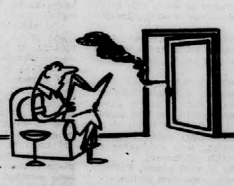
— Kaj delaš, draga: ali kuhaš ali likaš?