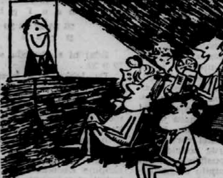
— Tako film je že napred poroke. Glejče, kako se smejem!