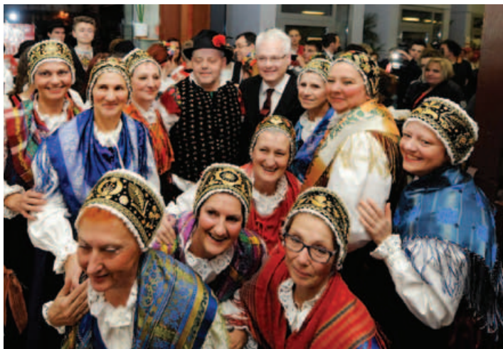
S predsednikom.

Pred osmimi leti je "češka obec" iz Bjelovarja prvič organizirala Večer narodnih manjšin kot predstavitev kulturne tradicije narodnih manjšin, ki živijo na tem območju. Letos je srečanje potekalo že osmič po vrsti, prvič pa je slovensko manjšino s tradicionalnimi jedmi in nastopom folklorne skupine predstavljalo KPD Bazovica.