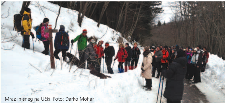
Mraz in sneg na Učki.

Prvi izlet planincev vsako leto postaja novoletni vzpon na Vojak, najvišji vrh Učke, v organizaciji pridnih članov PD Opatija. Kljub obilici snega, močni burji in mrzlemu vremenu se