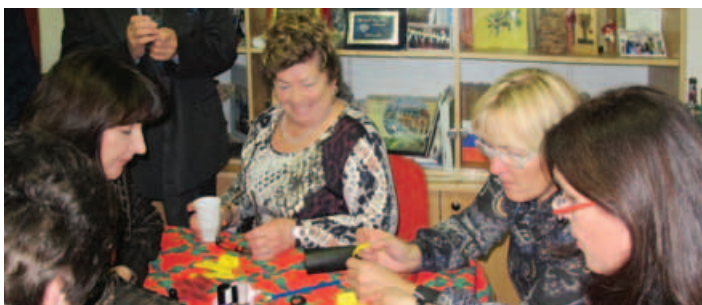
Druženje in delavnica.

13. december, Slovenski dom KPD Bazovica