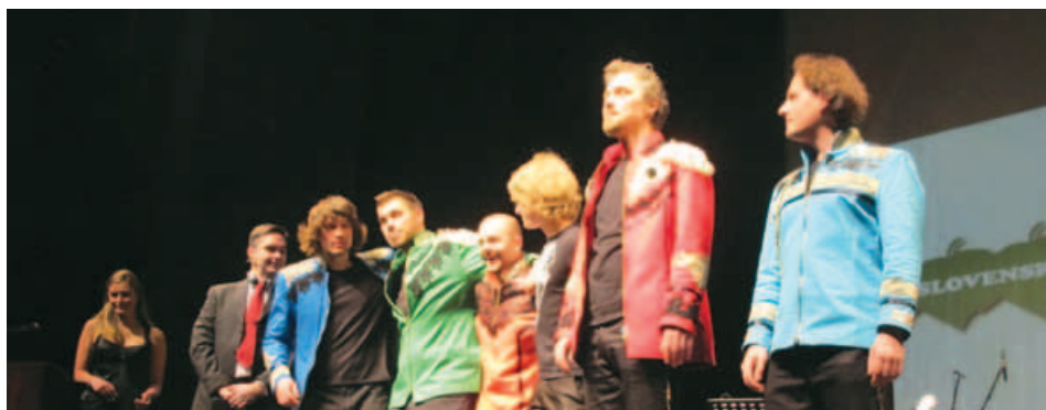
Skupina Sudar.