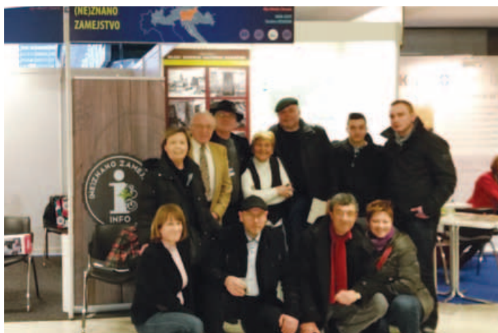
S srečanja.