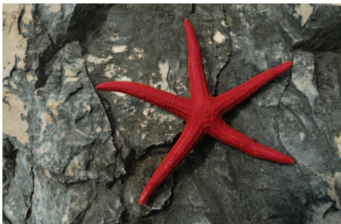
Morska zvezda.