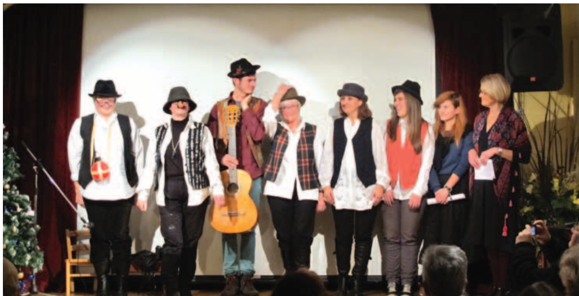
Po uspešnem nastopu.