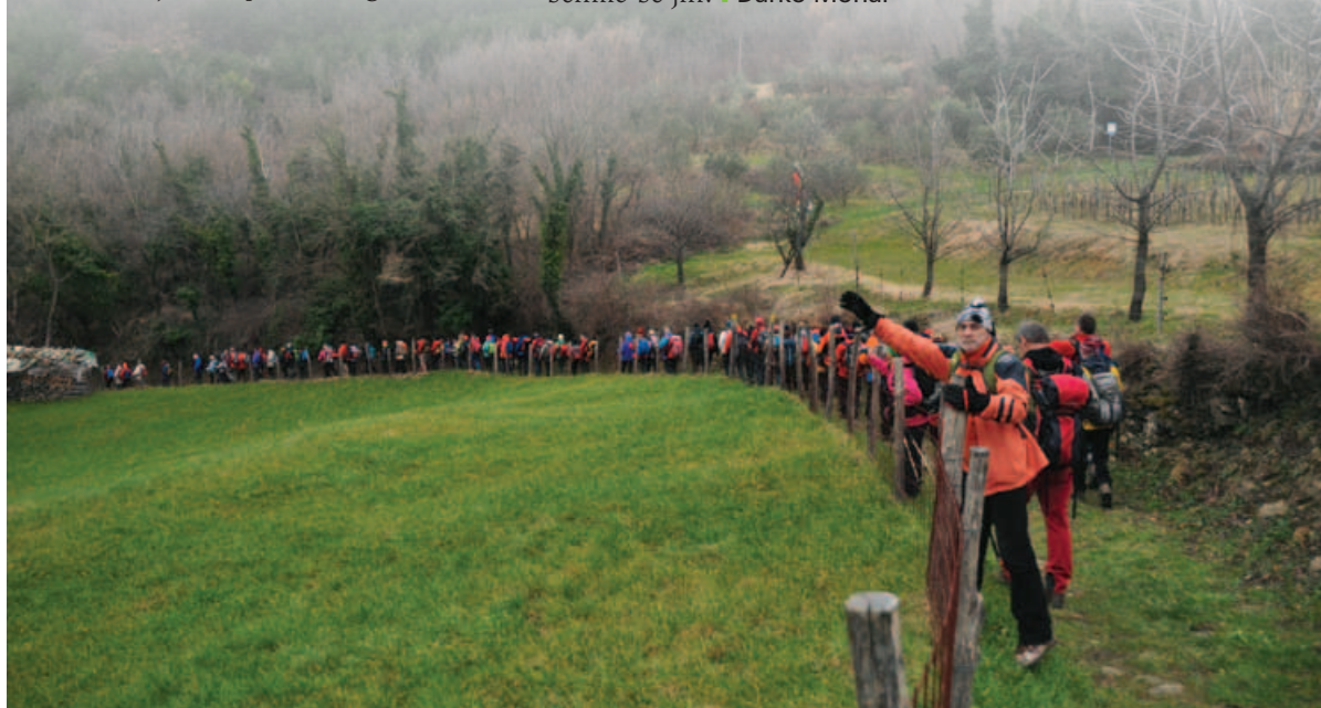
Pohod po istrskih gričkih. Foto: Darko Mohar

V februarju sledi še kar nekaj srečanj s člani Obalnega PD! Veselimo se jih! | Darko Mohar