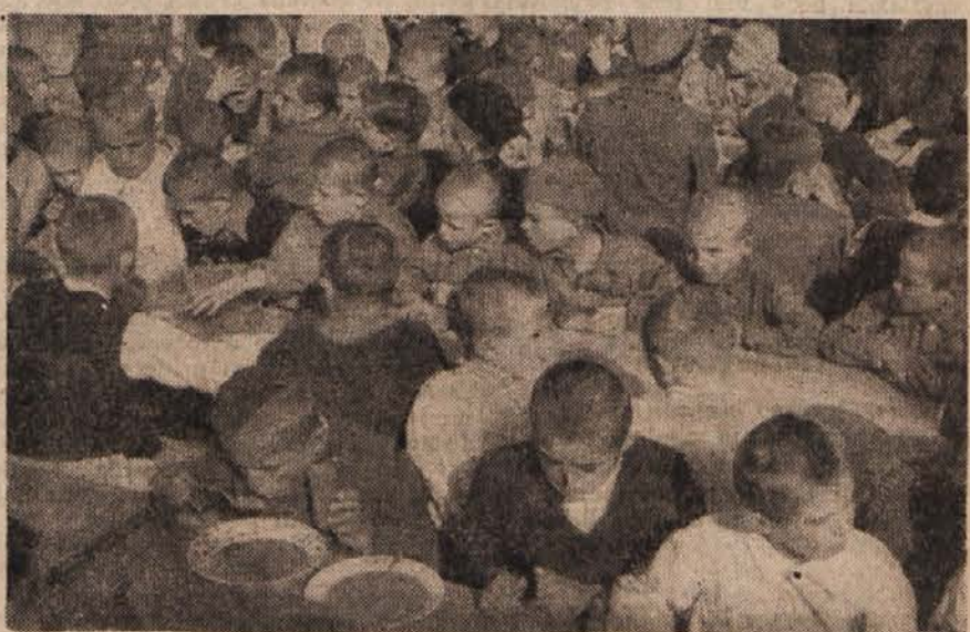
Danes so bosanski in hercegovski otroci, sirote brez staršev, našli varno zavetje v Sloveniji, kjer so dobro preskrbljeni in bodo lahko posejali šole.

Naj ne bo niti ene družine, ki bi dejala, da je obupala nad svojim rejencem. Kajti vsak otrok je v svoji duši dober in pristopen za pametno vzgojo. Le treba je, da jim tudi sami posvetimo vso ljubezen.