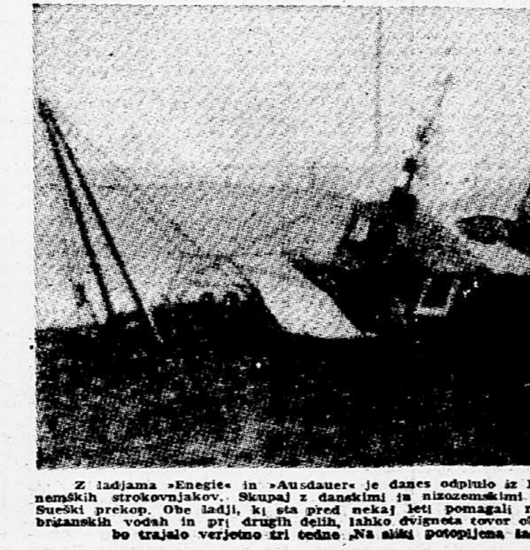
Z ladjama »Enie« in »Ausdauer« je danes odšlo iz Hamburga v Port Said 40 zahodno-sueški prekop. Obe ladiji, ki sta pred nekaj leti pomagali rešiti neko angleško podmornico v britanski vodni pri drugih delih, lahko dvigneta tovor črno 6.000 ton. Potovanje do Suez bo trajalo verjetno tri tedne. Na silki potopljena ladija v Suezskem prekopu.

Francija ima poleg tega resne ambicije, da bi tudi v bodočnosti igrala vlogo velike. V preteklosti, v času največjega divjanja hladne vojne, so desničarske vlade, ki so se stalno menjavale, omejevale Francijo na mesto drugorzredne sile. Kazalo je, da bo socialistična via-