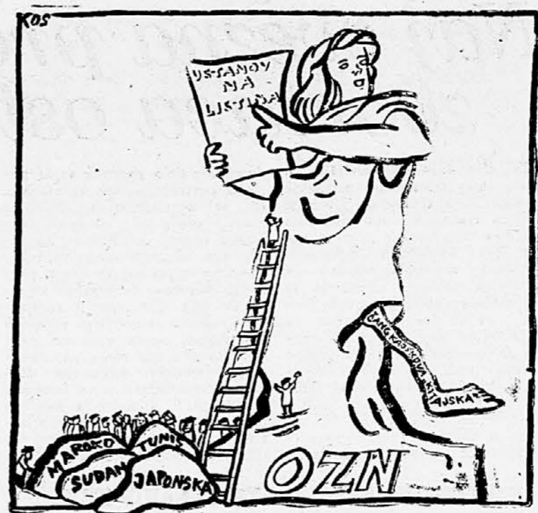
Zahodni kiparji: »Še iz material uporabimo, pa bo stvar popoln«

Moskva, 12. nov. Kakor poroča TASS, je predsednik sovjetske vlade Bulganin danes ugodno odgovoril na predlog predsednika švicarske konfederacije Marcusa Feldmanna za sestanek šefov vlad Sovjetske zveze, Velike Britanije, ZDA, Francije in Indije v Švic. Sovjetska vlada, pravi Bulganin, je prepričana, da je treba vse spore reševati na mirnem način, in se zaveda koristi, ki jo lahko imajo neposredni razgovori med šefi vlad različnih držav.