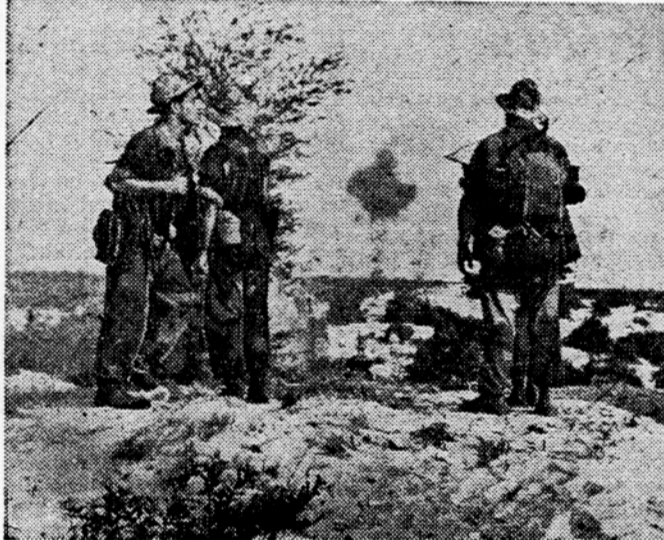
Patrolje na bojišču Indokine

ročil, naj se ta pomoč čimprej dodeli. Na razpolago pa ima vlada ZDA samo del te pomoči iz razpoložljivih sredstev, o večjem delu pomoči pa bo odločal šele kongres na svojem novem zasedanju. Med predstavniki obeh vlad so bili o dodelitvi nove pomoči že uradni razgovori, ki bodo