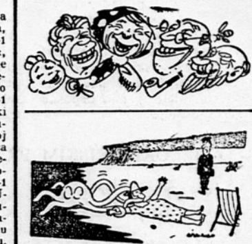
Glej, glej, že spet ste jo hoteli odkuriti, ne da bi plačali pristojbino za ležalni stol!

Za slovenske impresioniste je spodbetka, tudi tu kot pri Hrvatih pravzaprav z značilnim zamudništvom, ideal klasičnim impresionizem, ki ga razširi Gro-