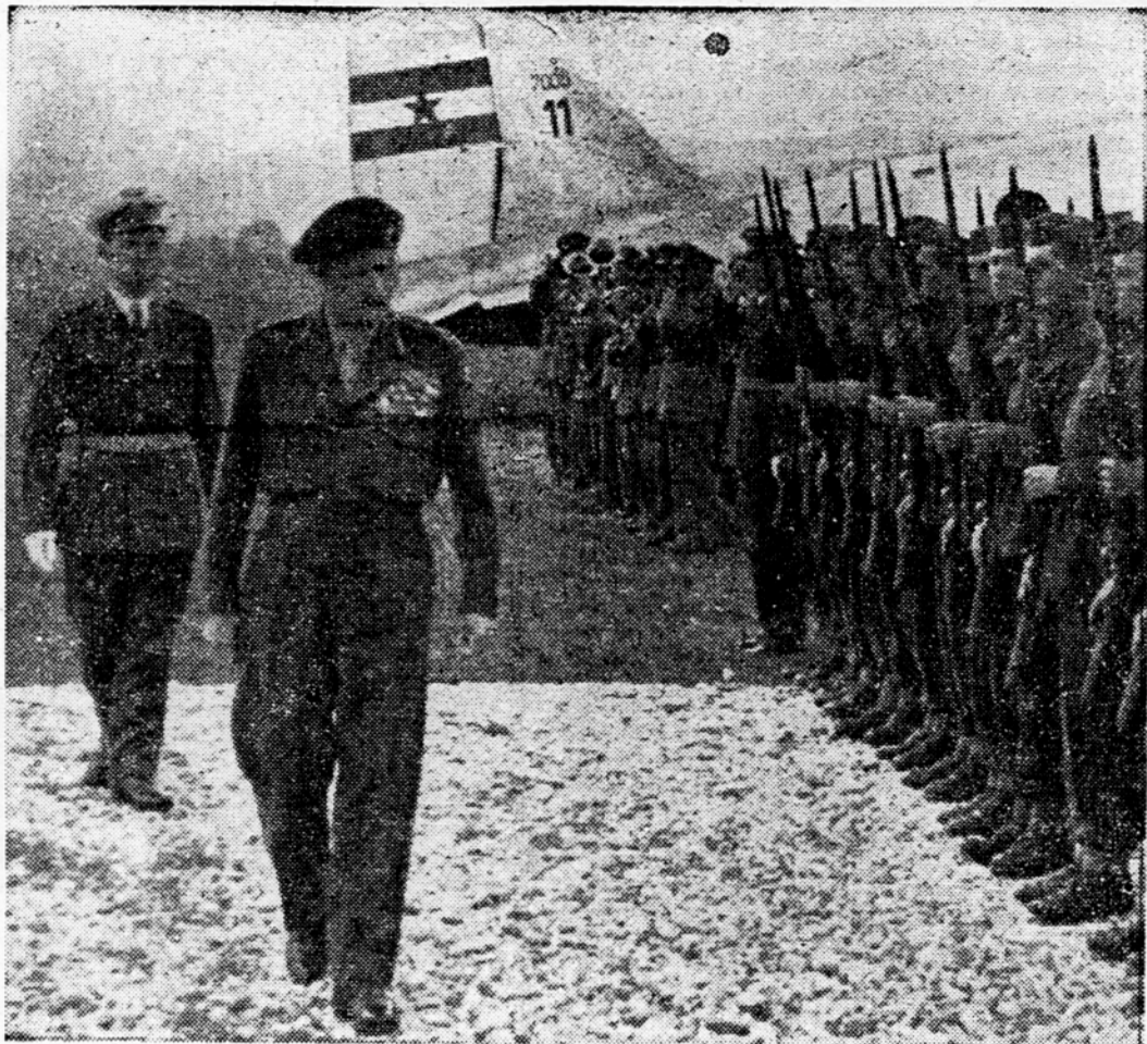
Maršal Montgomery pregleduje častno četo ob prihodu na ljubljansko letališče