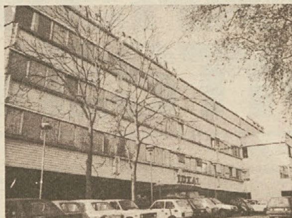
Poslovna stavba na Mariborski 7