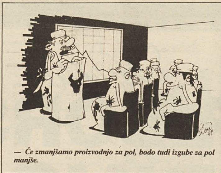
— Če zmanjšamo proizvodnjo za pol, bodo tudi izgube za pol manjše.

1. nagrado, 15.000 dinarjev prejme: Irena Kranjc, 63212 Vojnik, Cesta v Šmartno 15/a