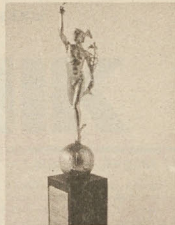
Mednarodno priznanje Zlati Merkur

Kovinitehna je eno največjih trgovskih podjetij s tehničnim blagom v Jugoslaviji. Njen sedež je v Celju. Začetke grosistične trgovine železninarske stroke v Celju pa najdemo že v letu 1810, ko je v Celju nastala privatna trgovina z železino »RAKUSCH«.