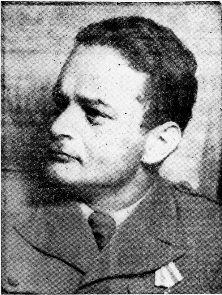
Beograd, 16. jun. Na seji vlade Federativne ljudske republike Jugoslavije 13. junija je bil imenovan za predsednika gospodarskega sveta FLRJ Boris Kidrič, minister za industrijo FLRJ.