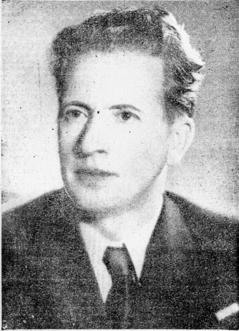
Tov. Miha Marinko, predsednik vlade LR Slovenije