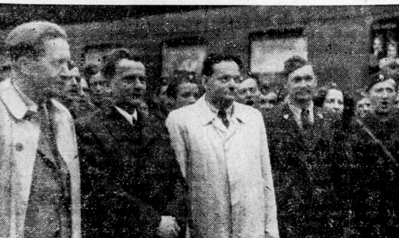
Odhod ministra Zvezne vlade za industrijo in predsednika Zveznega gospodarskega sveta tov. Borisa Kidriča iz Ljubljane v Beograd Zbor »Srečko Kosovel« je zapel za odhodnico ministru tov. Borisu Kidriču. V ospredju stoji od leve na desno: predsednik vlade Ljudske republike Slovenije tov. Miha Marinko, predsednik SNOS-a tov. Josip Vidmar in minister za industrijo pri Zvezni vladi tov. Boris Kidrič.