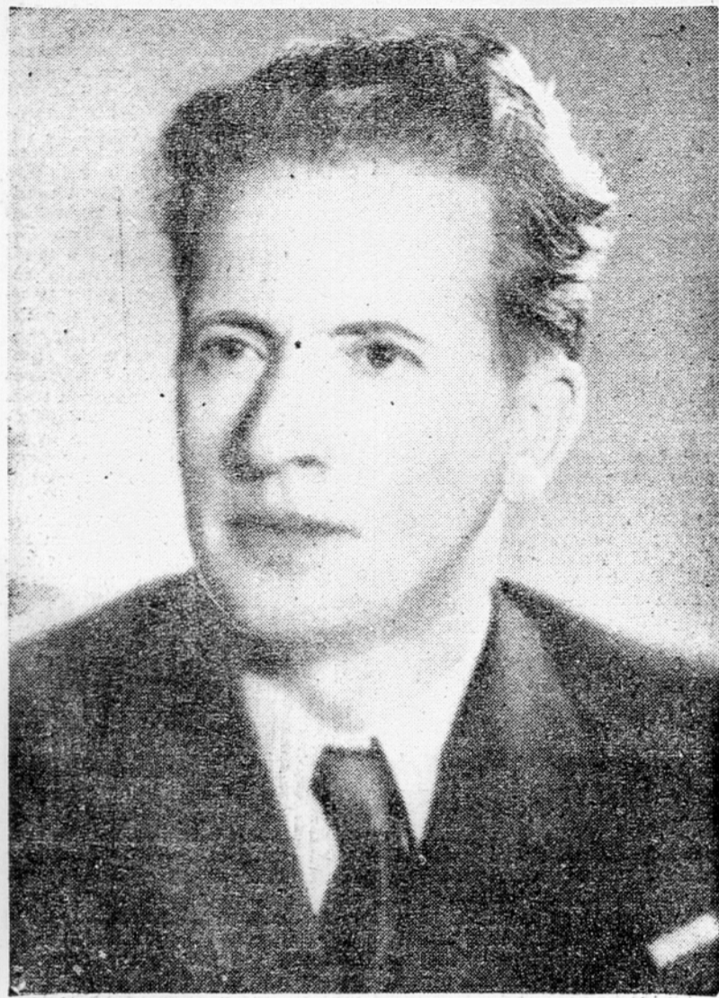
Tov. Miha Marinko, predsednik vlade LR Slovenije