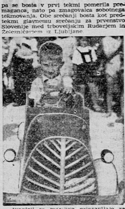
Pionirji se marljivo pripravljajo za bližnje tekmovalne z avtomobili in skitrmi.

Tudi letos bodo naši pionirji dostojno praznovali svoj tradicionalni praznik cvetočih pomladi. Mestni svet Zveze pionirjev in ostale množične organizacije pripravljajo za nedeljo več lepih prireditev. Tudi športna društva, sekcije in klub organizirajo za svoje najmlajše razne športne prireditve. Ljubljanska nogometna podzveza prireja v soboto in nedeljo pokalni nogometni turnir, na katerem bodo sodelovali pionirji Odreda, Slovana, Krima in ljubljanskega Zvezničarja. Začetek tekem bo v soboto ob 16.30 na stadionu Zvezničarja v Šiški, v nedeljo popoldne ob 14.30 na stadionu Rudarjem in Zvezničarjem v Ljubljani.