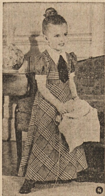
THE LONG LOOK—Cotton in a menswear pattern goes feminine in a long dress. In blue and white plaid, it's a simulated jumper with red-dotted shirt and navy four-in-hand tie. Styled by Cinderella.

Globoko žalujoca: sestra IVANA ZELKO ter OSTALO SORODSTVO Cleveland, O. 13. septembra 1972.