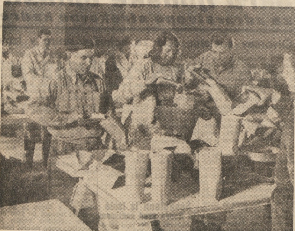
NASE DEMOKRATICNO LJUDSTVO, KI JE ŽE TOLIKO IN TOLIKOKRAT POKAZALO SVOJO BORBENOST JE KONČALO S PRIPRAVLJANJEM ZAVOJEV ZA STAVKAJOČE DELAVCE. NJIHOVO DELO NI BILO ZAMAN. DELAVCI IN NJIHOVE DRUŽINE SO S HVALEZNOSTJO SPREJELI TO KAR JIM JE ISTRSKO DELOVNO LJUDSTVO POSLALO V ZNAK SOLIDARNOSTI