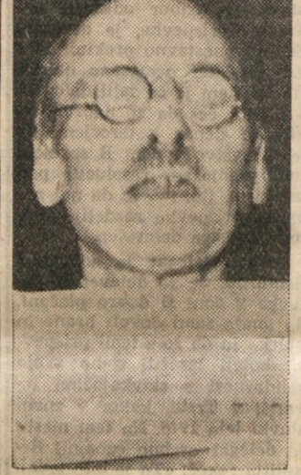
SEDANJI ANGLEŠKI PREMIER ATLEE

posledice vedno bolj šutile v inozemstvu. Politična situacija na Angleskem je bila v poslednjih mesecih, posebno po devalvaciji funta, vedno bolj pod vplivom predvolivne psihoze. Vsi razgovori in vse sple. kulacije na londonski borzi so se vedno bolj vrtele okoli volitev.