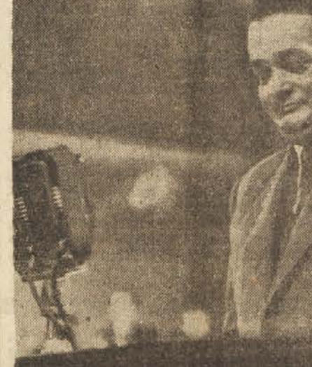
Tovariš Boris Kidrič govori na II. kongresu KPS

Ponovno naglašam, da je osnovna v našem planu — borba za socializem. Teža se morajo zavedati zlasti naše partijske organizacije. Če bomo to zavest v partijskih organizacijah in forumih dovolj visoko razvili in jo hkrati spreminili v praktično, borbeno dejstvo slehernega dne, nas v našem planiranju in v boju za plan us bodo več mogli varati razni lažnostrokovnjaki, na naše plane v