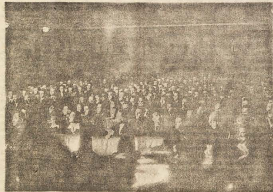
Pogled na dvorano med zasedanjem kongresa

Z rastočo politično aktivizacijo množic in v razmahom osvobodilne borbe v začetku 1942. leta je naša Partija pravilno postavila novo nalogo, formiranje večjih partizanskih enot, odredov in skupin odredov. Te organizacijske oblike so omogočile naši vojski povečan ofenzivni polet in likvidacijo cele vrste osamljenih sovražnikovih postojank ter meseca maja 1942. leta ustvaritev večjega osvobodjenega ozemlja na Dolenjskem in Notranjskem. Organizacijska učvrstitev je omo-