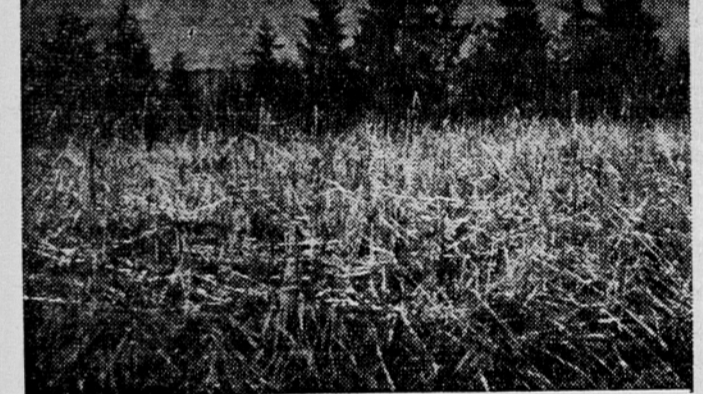
Ogromna škoda po toči v mozdinskem okraju 1. okleščeno žito