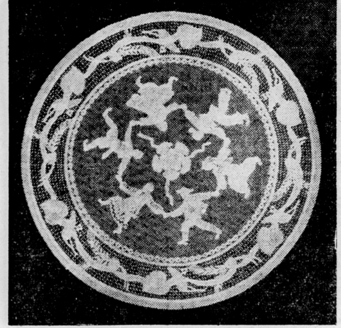
Jugoslovansko kolo v čipkah: šest bratskih republik v narodnih nošah

Se nekaj »Doms«, državnih prodajni zavod za domačo in umetno obrt v Ljubljani, skrbi za čipkarski material in odkup čipk. Ustanavlja 14-dnevne čipkarske tečaje, kjer se odrasle delavke učijo novih vzorcev. Res skrbi za razvoj čipkarstva, vendar bi spriču svojih velikih možnosti lahko skrbel še bolj, da ne bi zmanjkalo sukanca in naročil ter da bi čimprej nakazoval denar za izdelke. Zasluge čipkarice za njihovo precizno delo je res majhen: 6 do 10 din na uro. Za fin prtiček premera 25-30 cm, ki jih boste videli na razstavi, potrebuje odrasla delavka od 80 do 110 ur in dobi zanj od 600 do 1100 din. Tudi davek na čipke je prevelik, mislim, da 50 odstotkov, zato so čipke kljub majhnemu zaslužku drage. Odgovorni činitelji bi morali vedeti, da bi večina starih ženic, ki se sedaj preživljajo s čipkarstvom, brez tega zaslužka prišla v breme socialističnega krststva.