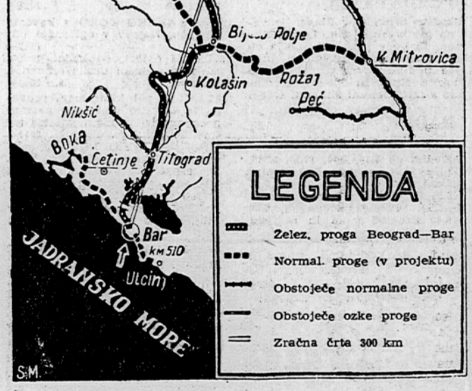
Zelezniška proga Beograd-Bar bo povezovala z Jadranskim morjem tretjino Jugoslavije

Za študij organizacije proizvodnje obstojajo na svetu posebni inštituti in biroji, ki se na znanstveni osnovi bavijo z vsemi organizacijskimi problemi proizvodnih podjetij (tudi pri nas že obstaja tak inštitut). Organizacija konkretnega proizvodnega podjetja ni in ne more biti ustvarjena stihistijski, po željah enega ali drugega, temveč jo diktira tehnološki proces proizvodnje. O najrazličnejših organizacijskih vprašanjih je bilo izdanih že mnogo knjig, publikacij in slično in to prav gotovo ne zato, da bi se v proizvodnih podjetjih uvedla birokracija, temveč zato, da bi organizatorji proizvodnje imeli na razpolago znanstveno obdelano osnovo, preizkušeno v praksi. Jasno in razumljivo je, da mora priti pri nas v Jugosla-