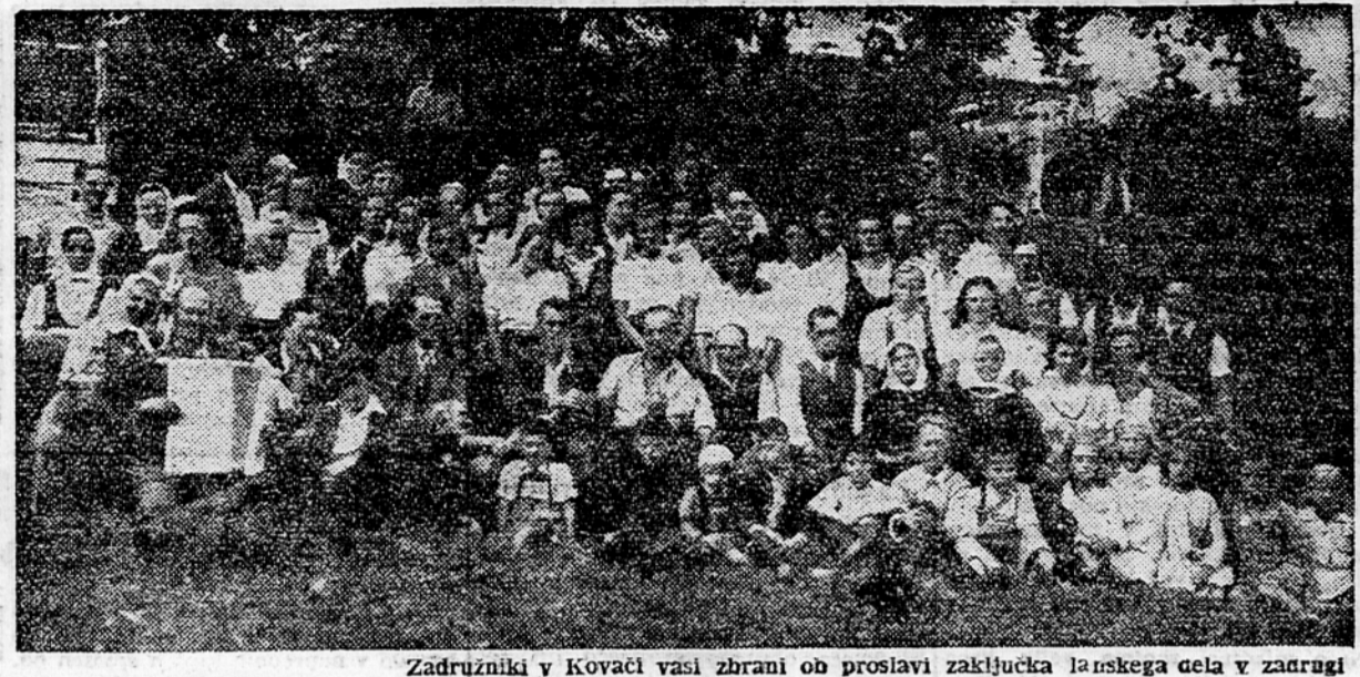
Zadružniki v Kovači vasi zbrani ob proslavi zaključka lanskega dela v zadrugi

Maršal Tito se je nato dotaknil potreb, o katerih so govorili predstavniki fizikulturistikov Jugoslavije. Strinjal se je s tem, da je potrebno, če že ne sedaj, zgraditi dvorane in telovadnice ali vsaj pripraviti teren za njih. Obljubil je, da bo storil vse, da bodo dobili fizikturniki in športna društva nazaj tiste dvorane, ki so bile prej zgrajene v ta namen, sedaj pa jih začasno uporabljajo v druge namene. Razen tega je poudaril, da se lahko grade, kjer bi bilo to potrebno in možno, tudi začasne telovadnice in barakah, dokler ne bodo zgrajene stalne in popolnoma opremljene telovadnice. O organizaciji fizikture in športa v JA je maršal Tito dejal, da je izolacija od civilnih društev nepravilna in nepotrebna, da je to stara praksa, ki jo je treba odpraviti. Na posebno vprašanje o priznanju dela v frontnih organizacijah tistim fizikturnim voditeljem, ki prostovoljno delajo v raznih društvih in fizikturnih aktivnih in jih je okrog 15.000. je maršal Tito odgovoril, da je treba to njihovo delo kot družbeno koristno evidentirati kot vsako drugo delo članov Ljudske fronte.