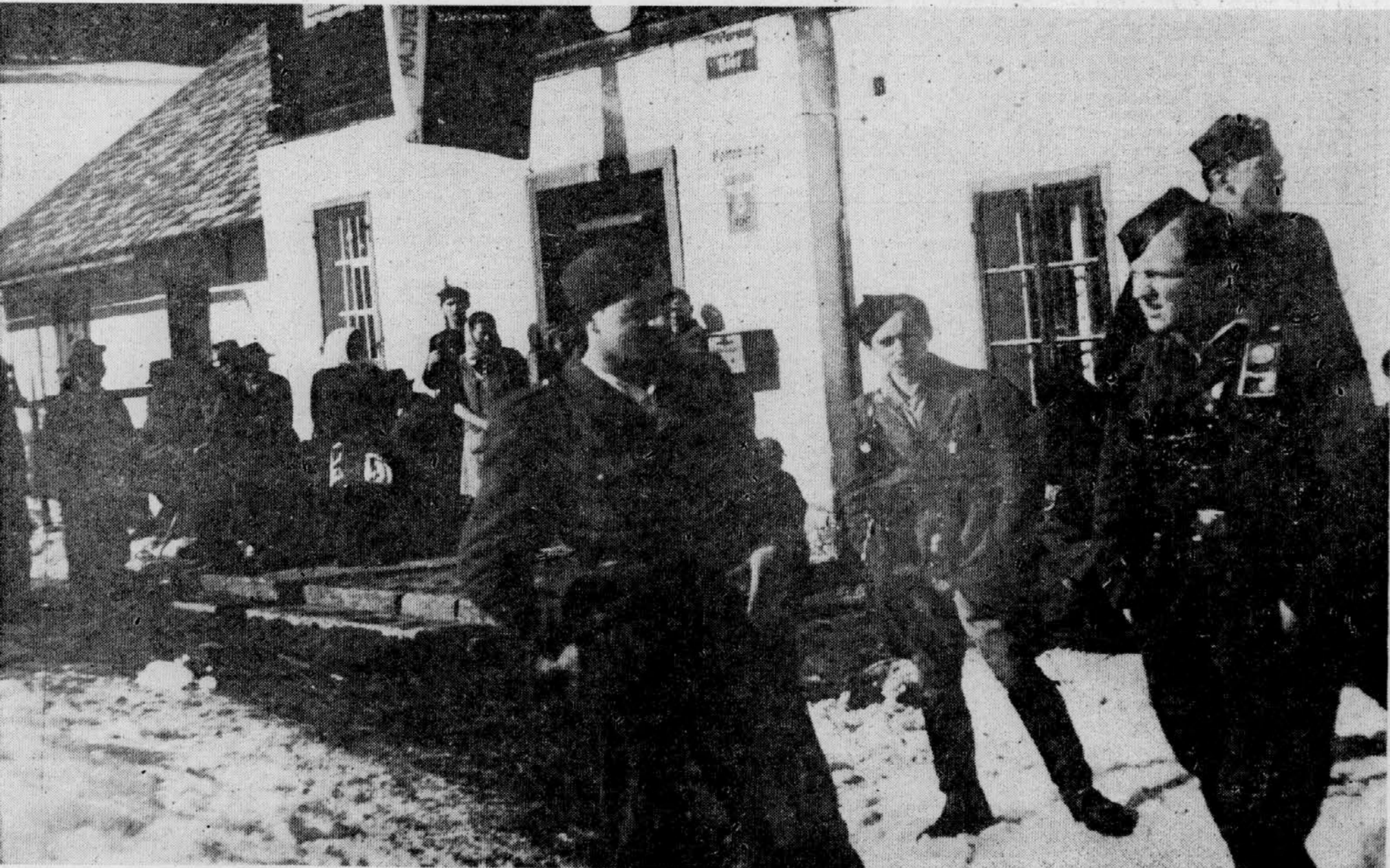
LACKOV ODRED: Februarja 1945.