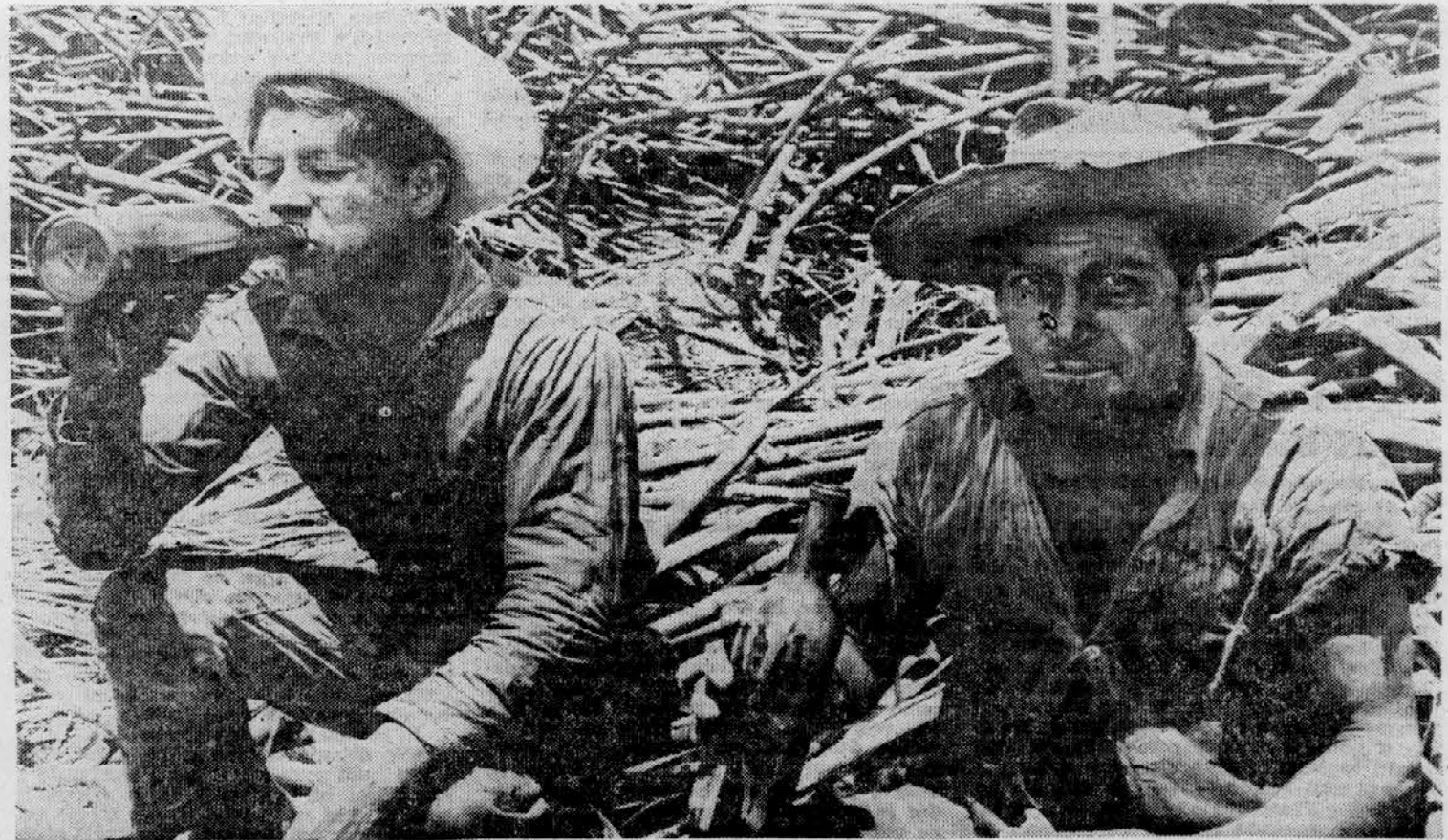
KMETI: Počitek na plantaži sladkornega trsa v Peruju

Toda tridimenzionalna idila ni trajala dolgo. Pučistični poskusi desnice so zrahljali center Suvana Fuma, ki mu levica ni zaupala in se je vedno bolj oddaljevala od njega. Iz sporadnih spopadov, najprej med enotami Pathet Lao in desničarskimi oddelki, se je izčimila nova državljanska vojna, ko so najbolj radikalni desničarji morali pobegniti iz dežele, medtem ko se je politična desnica stopila z nevtralisti Suvana Fuma; s čimer se je vsa nevtralistična sredina premaknila močno na desno. V razmerah, ko je v Laosu besnela državljanska vojna, v Vietnamski pa se je ameriška intervencija bližala vrhu, je to pomenilo, da se je nevtralist Suvana Fuma v boju proti Pathet Lao vedno bolj naslanjal na ameriški pomoč in na tajske najemnike, medtem ko je Pathet Lao dobival pomoč iz Severnega Vietnama. Vendar je tudi v tem treba opozoriti na laosko posebnost: osvobodilno gibanje Pathet Lao ni nikoli izpodbijalo