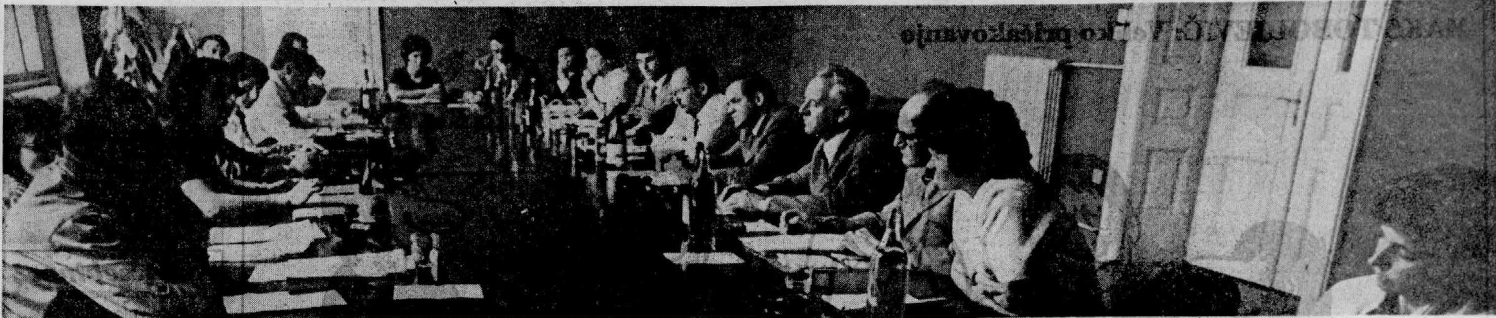
NEPRIZANESLJIVO SRECANJE: Deževala so vprašanja, ki niso ostala brez odgovora