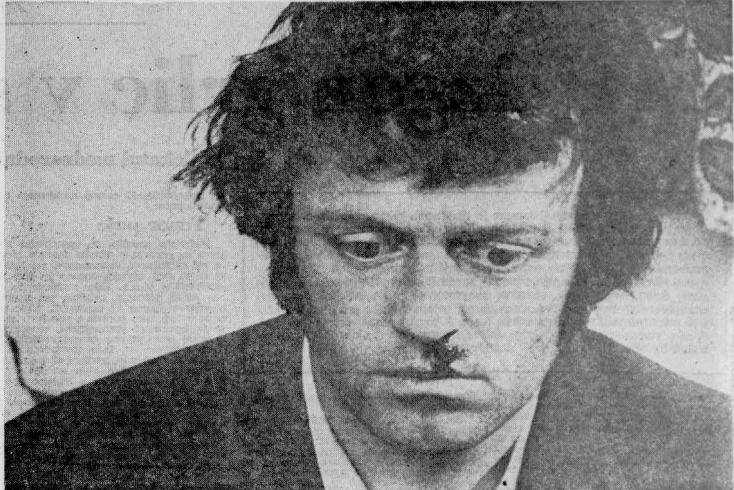
PRETEPENI IGRALEC MATTHIAS EYSEN: V zahodnonemškem filmu »Izvedenca«