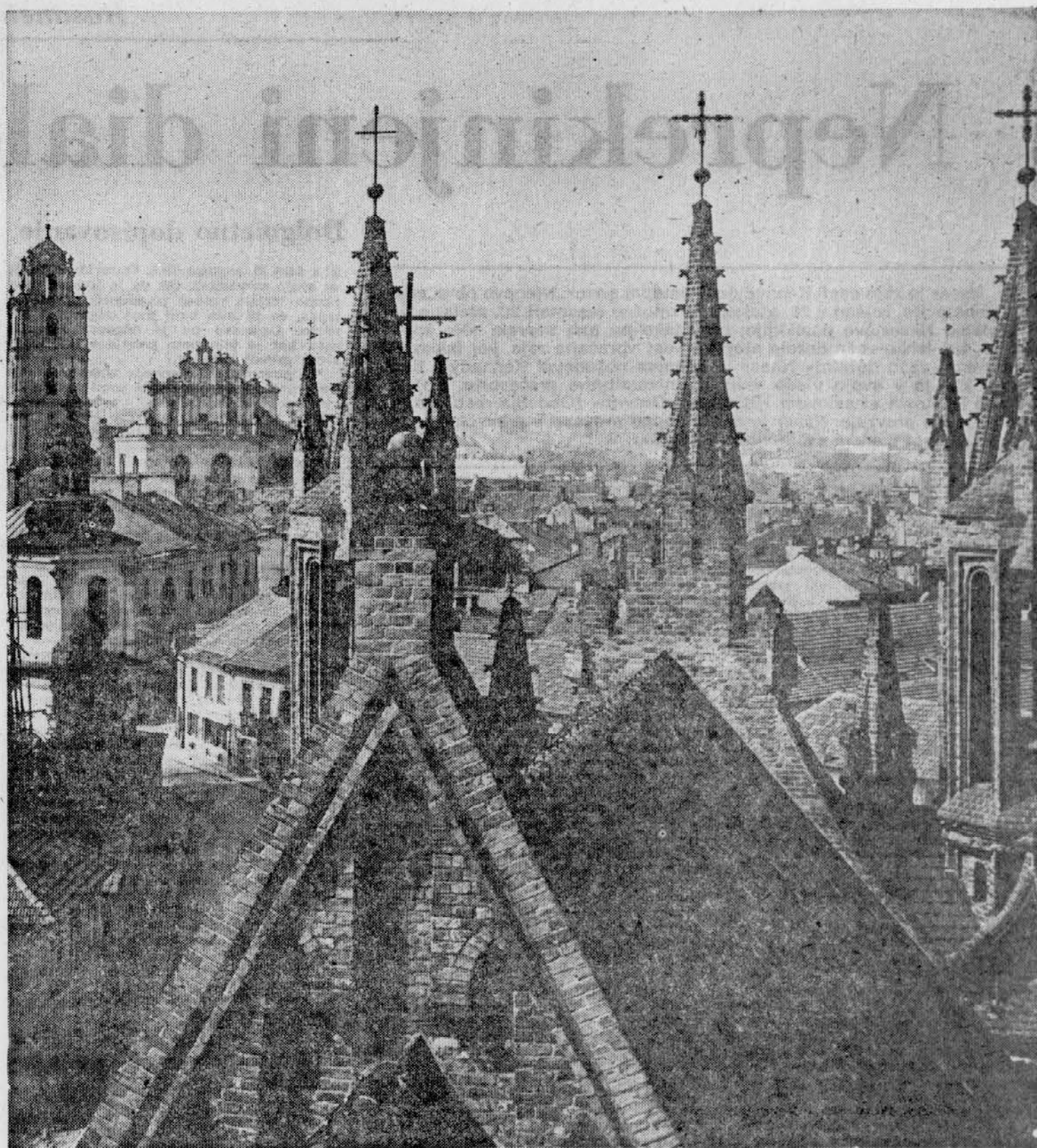
VILNIUS: Staro mesto